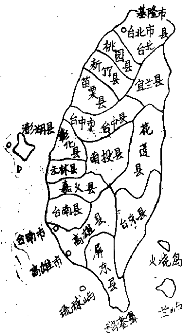
台湾行政区域示意图