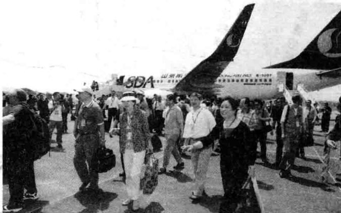
▲ 参加纪念活动的嘉宾抵梅