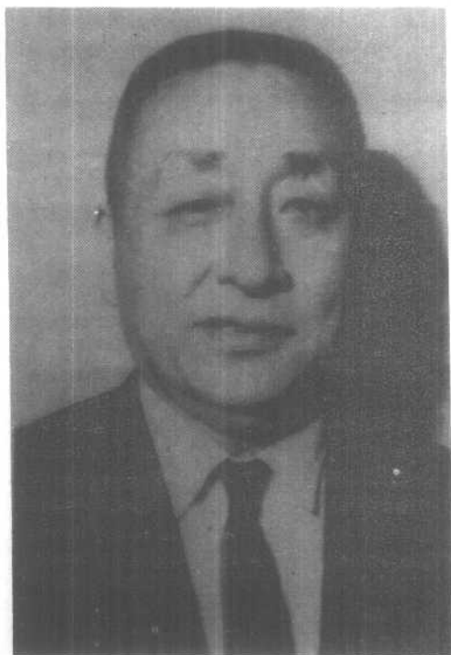
周宪文教授半身像