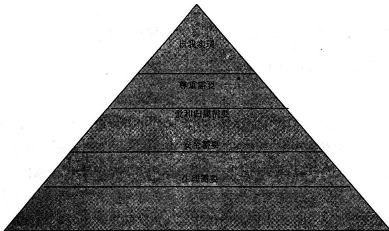
马斯洛需求金字塔

第一步，生理需要，这是人类维持自身生存的最基本要求，如衣、食、住、行等的需要。第二步，安全需要，表现为人们要求稳定、安全、受到保护、有秩序以及免遭痛苦、威胁和疾病等。如避免职业病及事故，摆脱失业威胁及得到某些社会保障的需要等。第三个需要是爱和归属的需要。处于这一需要阶层的人，把友爱看得非常可贵，希望能拥有幸福美满的家庭，渴望得到一定社会与团体的认同、接受，并与同事建立良好和谐的人际关系。工作的第四个理由是工作的成功使我们获得尊重的需要。它包括内在的尊重和外在的尊重，内在的尊重指自尊心、自主权、成就感等，外在的尊重指地位、认同、受重视等。第五个，也是最后一个需要——自我实现——是最高层次的需要，它是指人们希望自己的潜力能够最充分地发挥，使理想变为现实，成为自己所期望的人的需要。