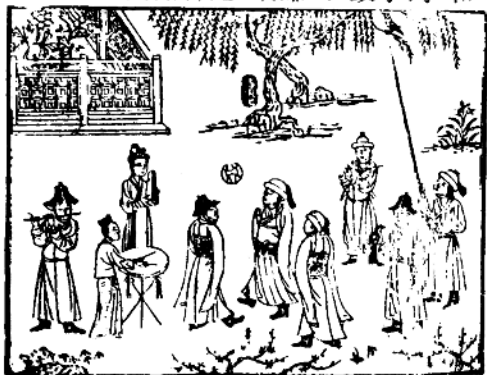
图2 (宋)《事林广记》唱赚图

虽然今已发现两汉时期的击鼓说书俑；唐代佛寺也有说唱变文留存，但民间大规模出现音乐表演比重较大、说唱演释传说故事的职业艺人，还是在宋代。宋元说唱艺术包括许多种类，其中最具有代表性的乐调类品种是“唱赚”、“鼓子词”和“诸宫