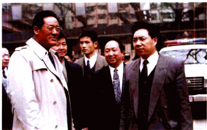
▲ 国家民政部长多吉才让(左一)在射洪视察民政工作