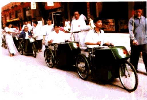
▶ 建国五十周年前夕，县民政局代国家民政部向全县特、一等伤残军人赠送轮椅。