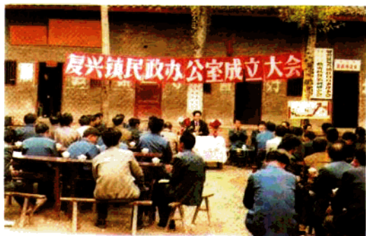
▶ 1991年 复兴镇建立民政办公室。