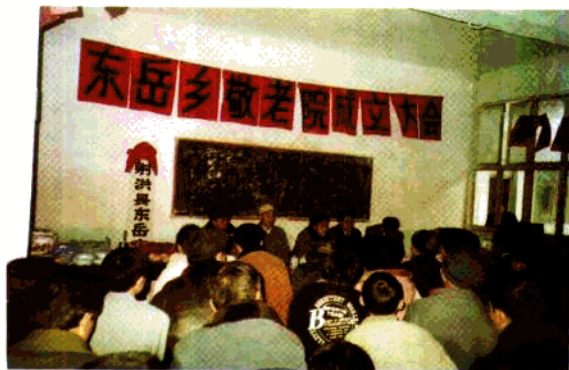
◀ 东岳乡成立敬老院。