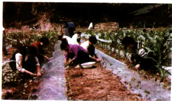
▲在1999年大战“红五 月”中,民政局全体机关干 部到太兴乡为贫困户助耕。