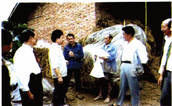
◀ 贫困户受到县民政局的关怀慰问