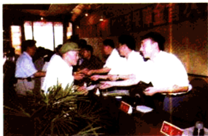
▲ 县政府举行最低生活保障金首发式。