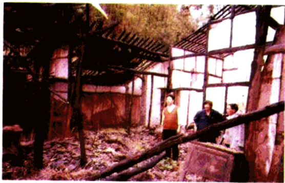
▲ 1998年，官升镇发生火灾后， 民政干部及时赶往现场查灾。