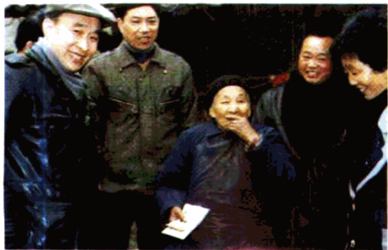
▶ 县委、县政府及民政局领导慰问五保老人