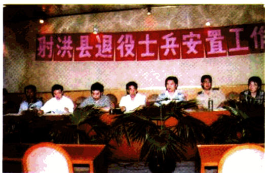
◀ 县政府召开退役士兵安置工作会议。