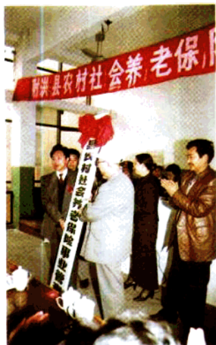
▲ 1997年，射洪县农村社会养老保险事业管理局成立。