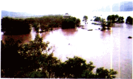
▲ 1998年8月21日，我县遭受 大洪灾