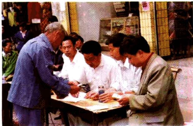
◀ 太乙镇首批投保对象喜领养老保险金。