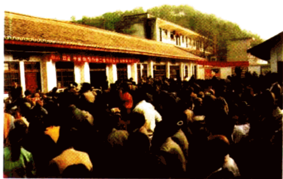
部 ◀ 金华镇高桥村公推公选村干部