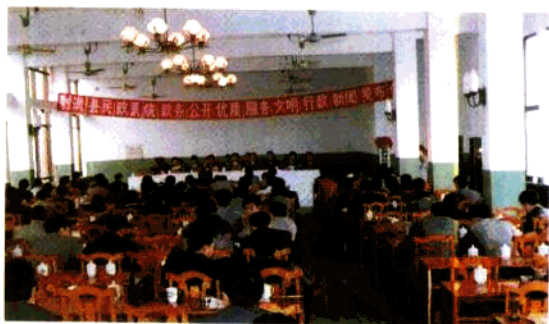
▲民政局于1993年3月 在县直属机关率先实行政 务公开、文明行政。