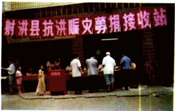
▲ 1998年8月下旬，发动群众 募捐赈灾。