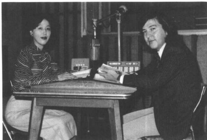
讲 师 待 场 裕 子 发音指导 高 山 和 也