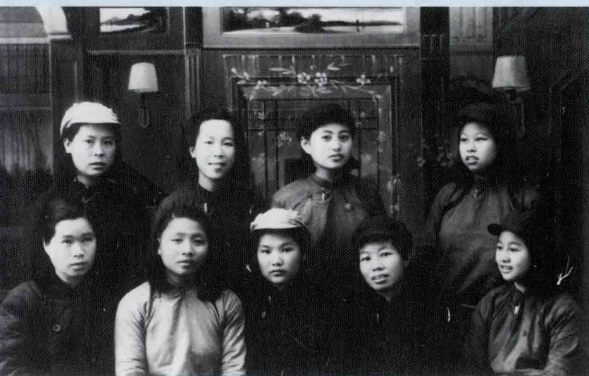
在城北工作時合影