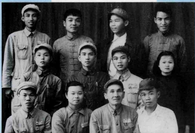
第 6 次紀念台委暨幹部全體組土改鄉坊松源縣梅 1952 年