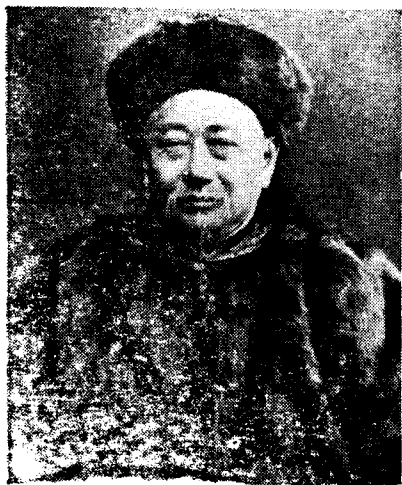
中国驻英公使郭嵩焘(在伦敦时)