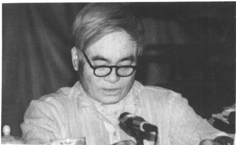
怒江州政协主席、联络处首席顾问查文汉在会上讲话