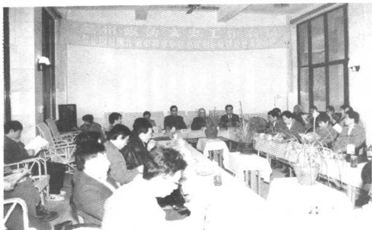
中国近现代史史科学学会怒江州会员联络处成立会议会场