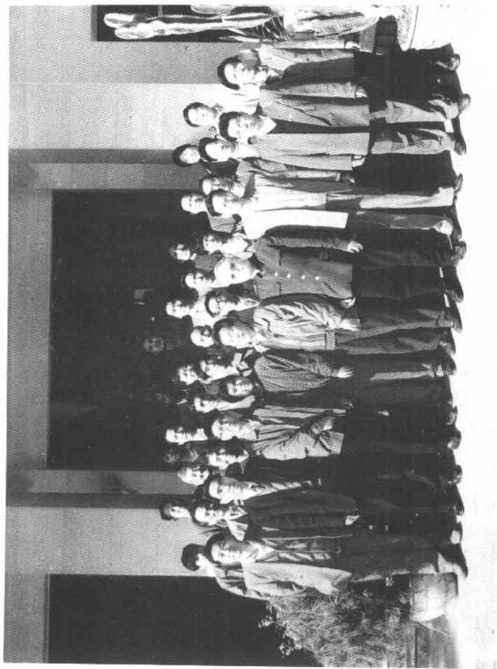
出席中国近现代史科学学会怒江州会员联络处成立会议的顾问及会员代表合影