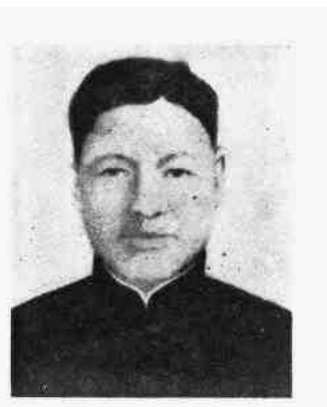
裴 蕾 (1921—1944.1)