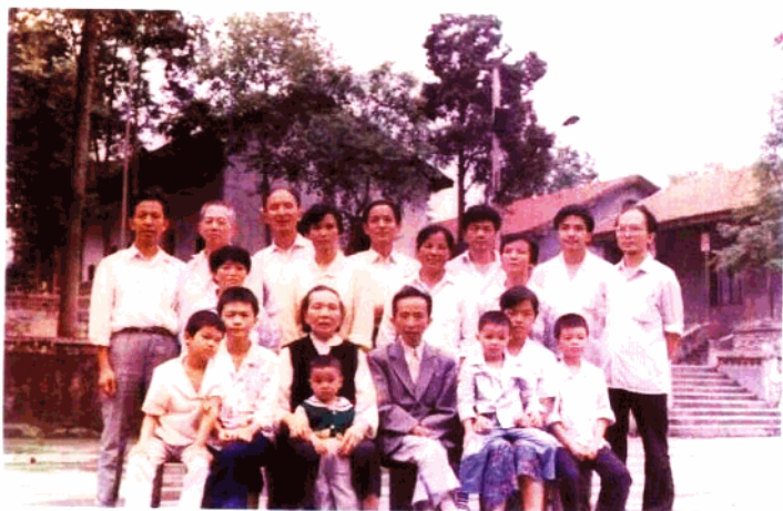
与部分家人合影，1991年