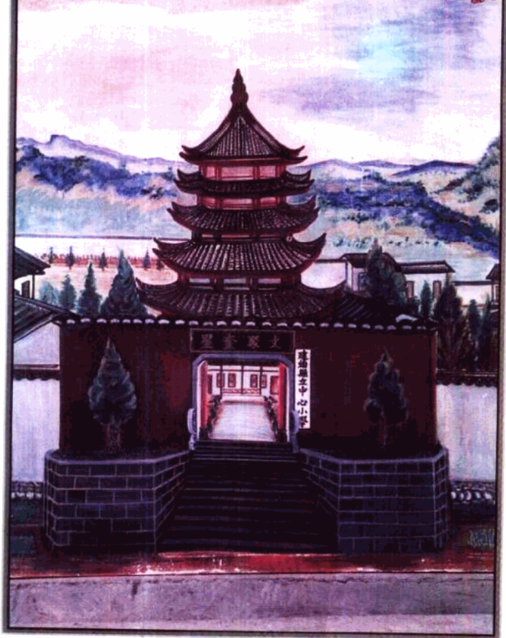
回忆画：解放前的实验小学（大门）