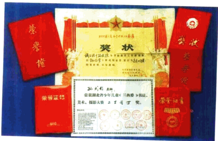
获得的部分奖状和荣誉证书