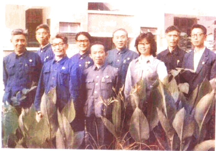
《建始县文史资料》编写组部分成员合影