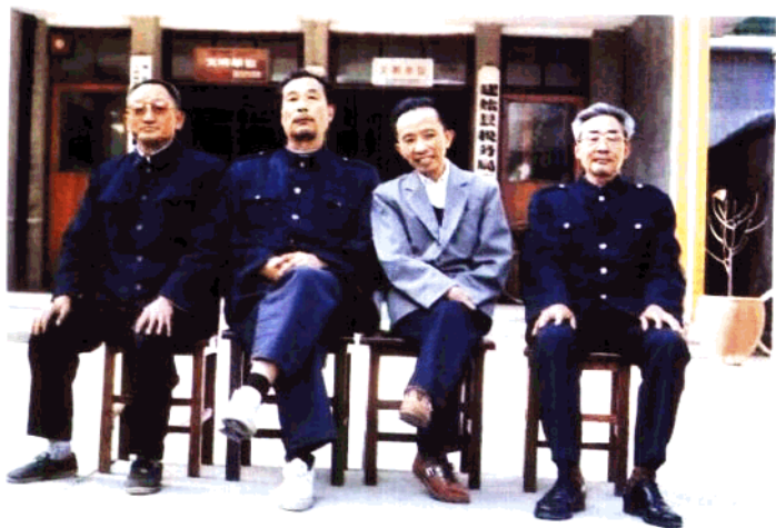
完成编写《建始县税务志》后合影，1989年