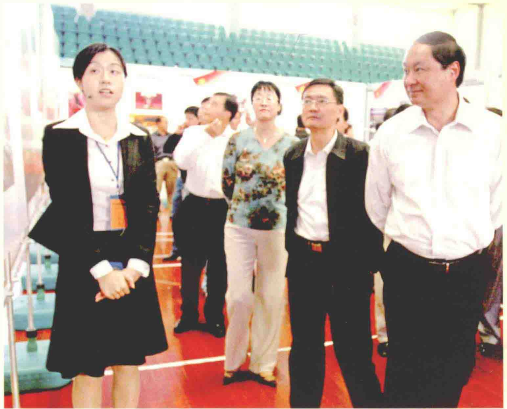
市委书记邵毅参观杭州市反腐倡廉成果展览