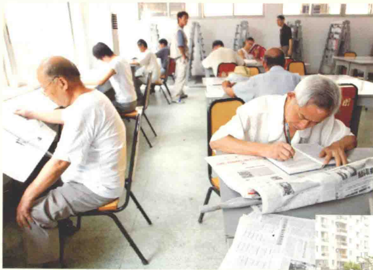
2004年以来，我市在锦城街道11个社区开展了以“清风入家园”为主题的廉政文化进社区活动。