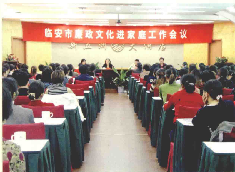
2006年我市开展了以“人生旅途廉内机构”为主题的廉政文化进家庭活动。