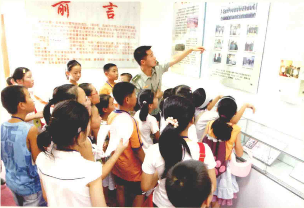
我市在全市各中小学开展了以“敬廉崇洁”为主题的廉洁教育进学校活动。图为市武警中队管兵向学生宣传反腐倡廉知识。