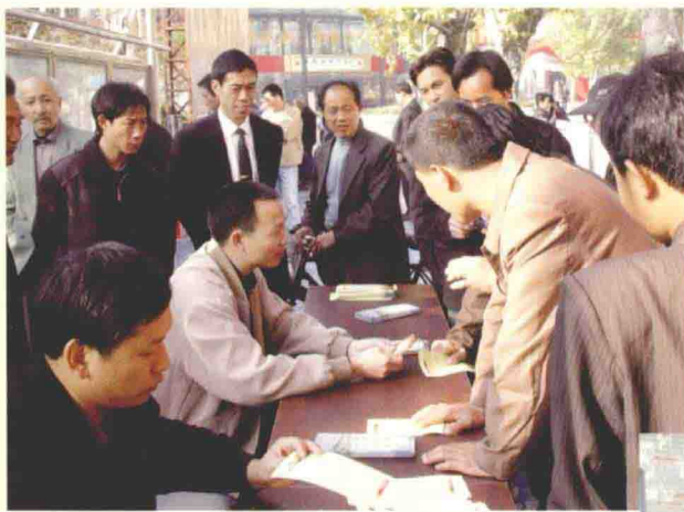
市纪委开展廉政知识咨询和 反腐倡廉图片展