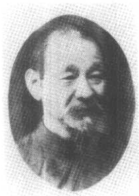
赵 舒