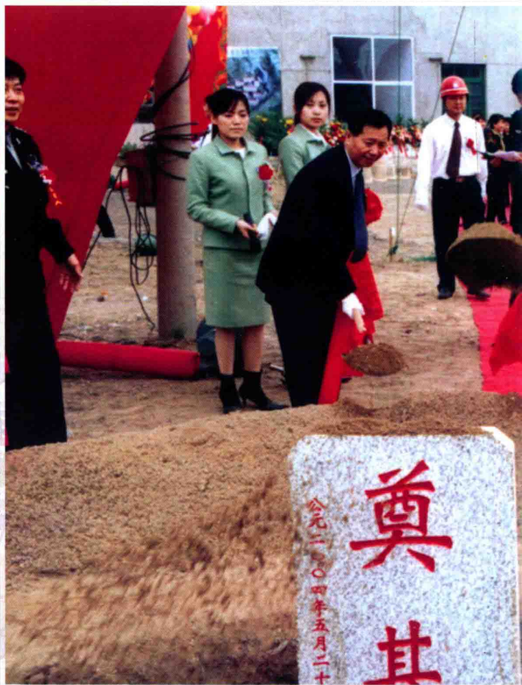
2004年5月28日，雁鸣湖畔彩旗招展、礼炮轰鸣，长春市司法服务中心和警官公寓工程奠基典礼隆重举行，在长春市司法局发展史册上留下了激动人心的一页。