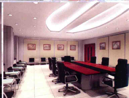
宽敞、明亮的办公室、食堂、会议室、多功能大礼堂、干警住宅小区和监所现代化的监控设施