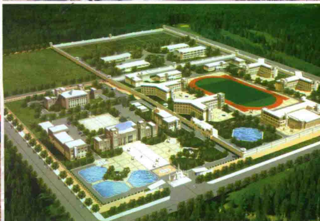
布局合理、宏伟庄重、设施先进的全新净月监狱