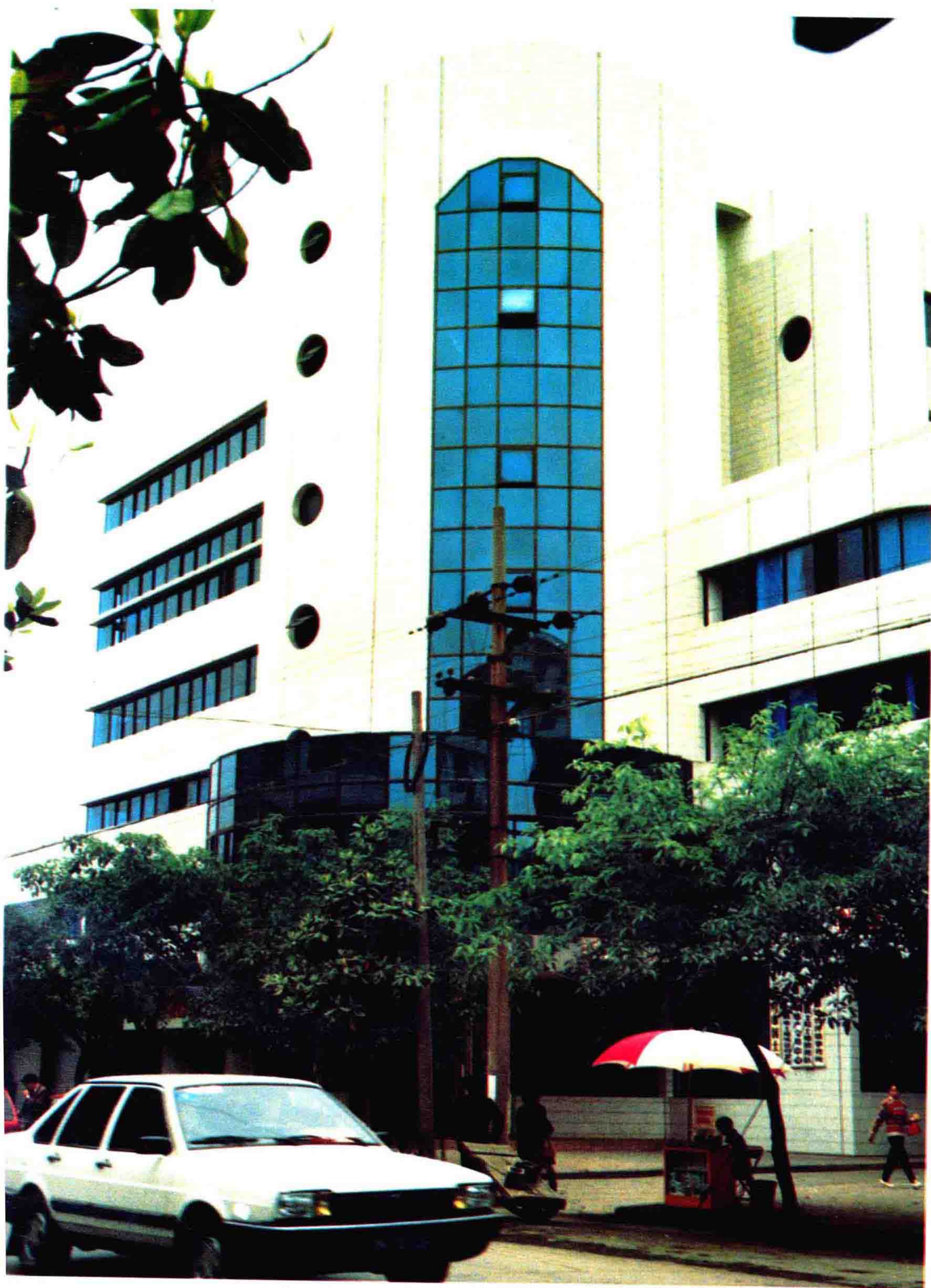
南 川 市 国 土 局