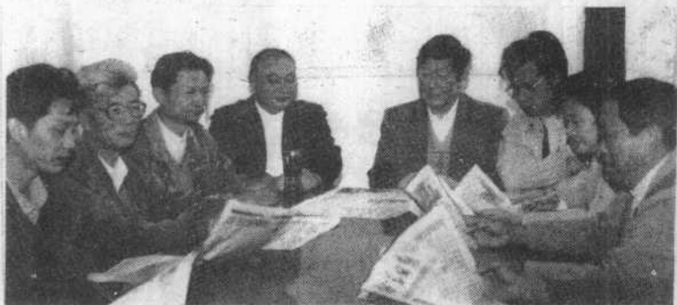
市政协学习中心组学习党的十四届六中全会文件