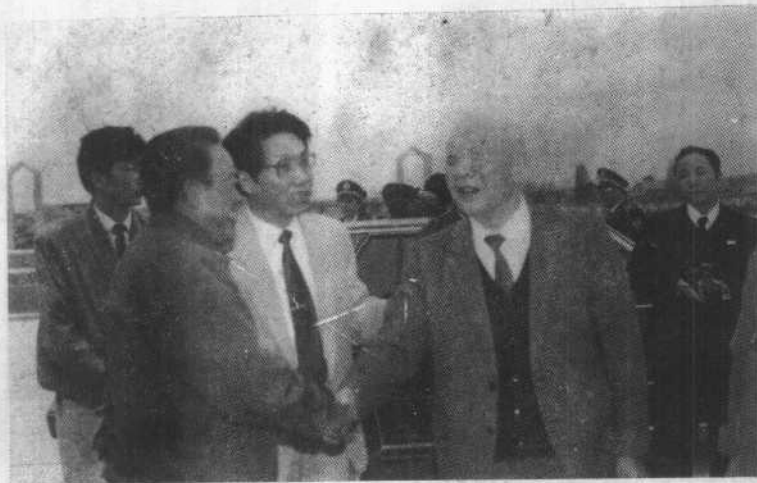
1991年秋,全国政协王思茂副主席莅淮视察