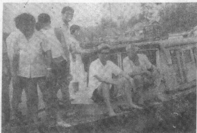
政协组织委员视察流均镇灾区情景