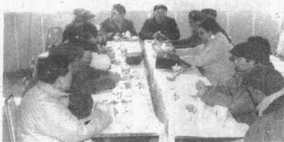
市政协与交通、公安等部门现场办理提案