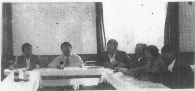
市委书记花法荣(左二)组织市委一班人研究政协工作