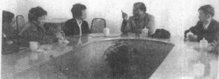
原市政协领导向全国政协赵炜副秘书长汇报工作