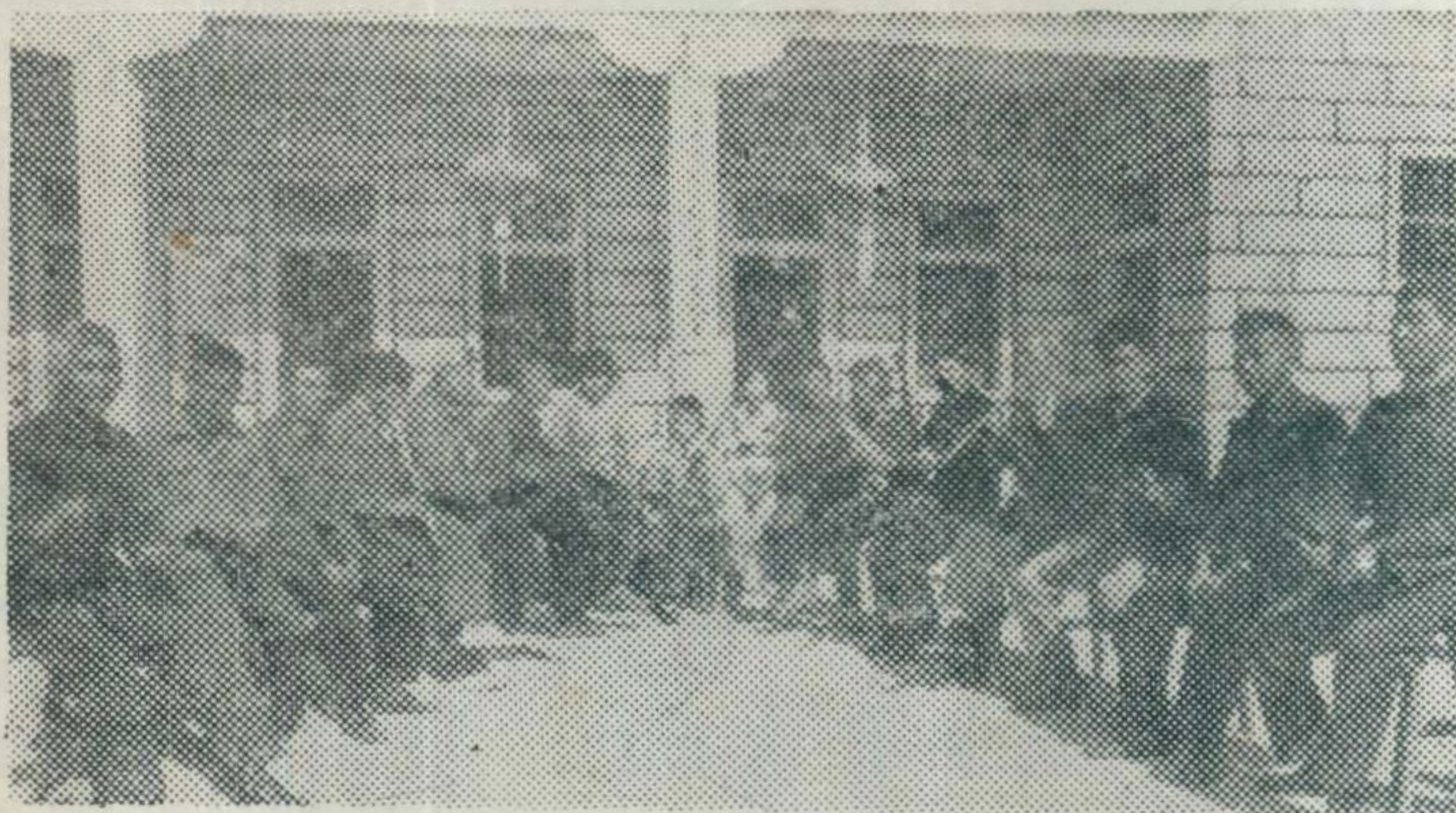
▲ 满堂红金浦大队南音组

短的一年多来，先后办了三班，已有相当部份学员，能够演奏南音器乐，并与惠安县的南音学员进行南音合奏。