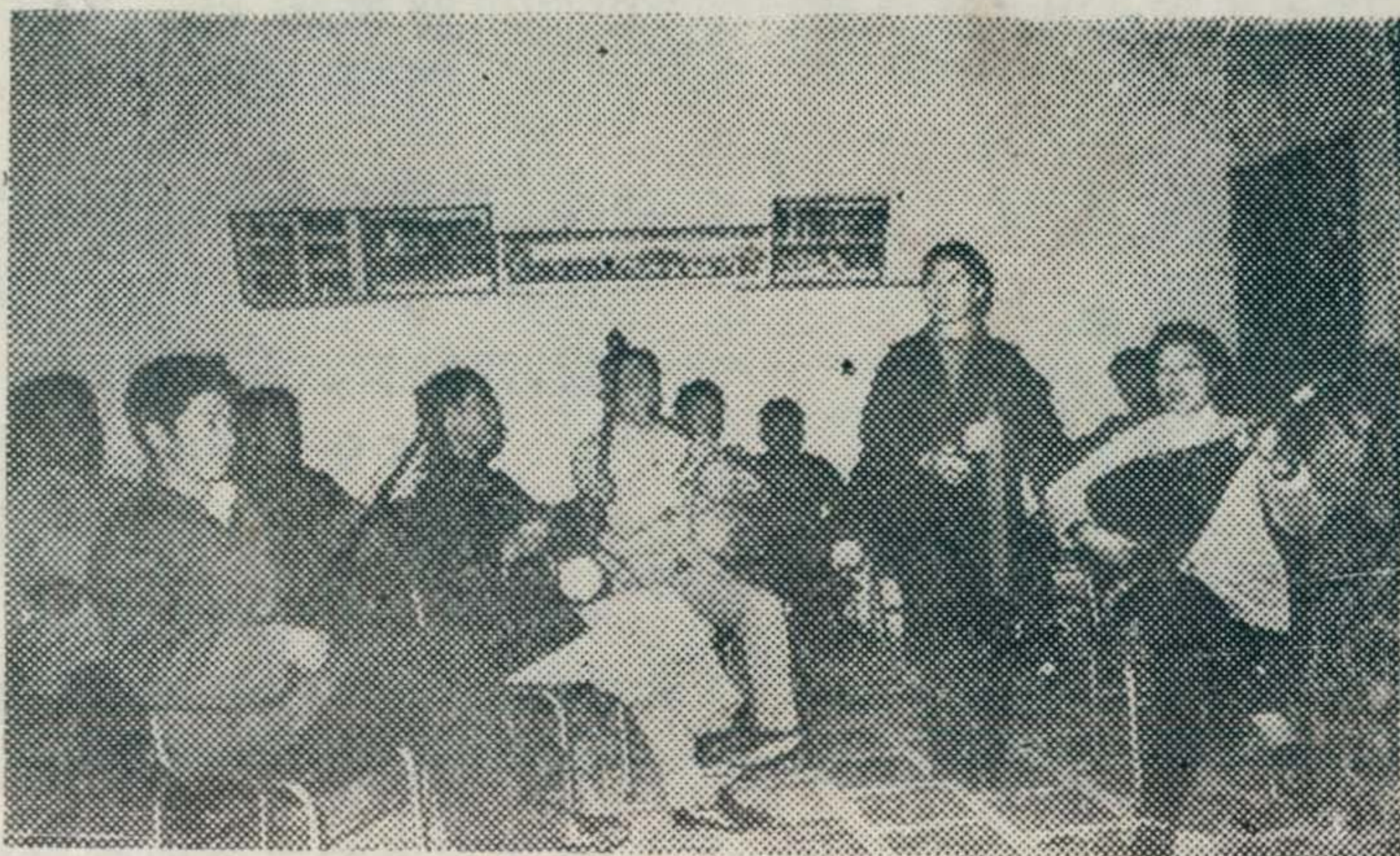
▼ 市业余曲艺队在排练

纵观几年来泉州南音活动情况，令人喜悦。一个具有三十多个南音小组，五百多人的群众性的南音普及活动，已在古城泉州形成，并日趋扩大。尤其是近年来泉州举行了南音大会唱，来自香港和菲律宾、印尼、新加坡等地的南音弦友莅泉参加会唱，以及福建南音演出团往港演出，交流经验，都对泉州南音艺术的发展起了重要的作用，并使南音更阔步迈向国际乐坛，受到各国的重视。电影《海囚》、《台岛遗恨》均以南音为主要乐曲，从而使南音的传播更为广泛。我们相信，南音，这朵美丽的“东方音乐之花”，必将在世界乐坛上，开得更加绚丽多姿。