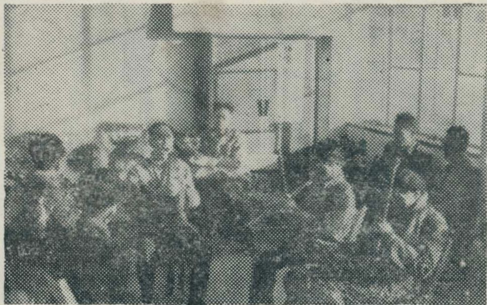
▲ 泉州工人文化宫南音班在活动

双阳农场前洋管区文化室，配合管区业余夜校，举办了以中、老年为主的南音班。在开展南音演唱活动的过程中，还有不少南音爱好者出钱资助，使南音活动更为经常亦更活跃地开展。通过南音班的教学活动，在短