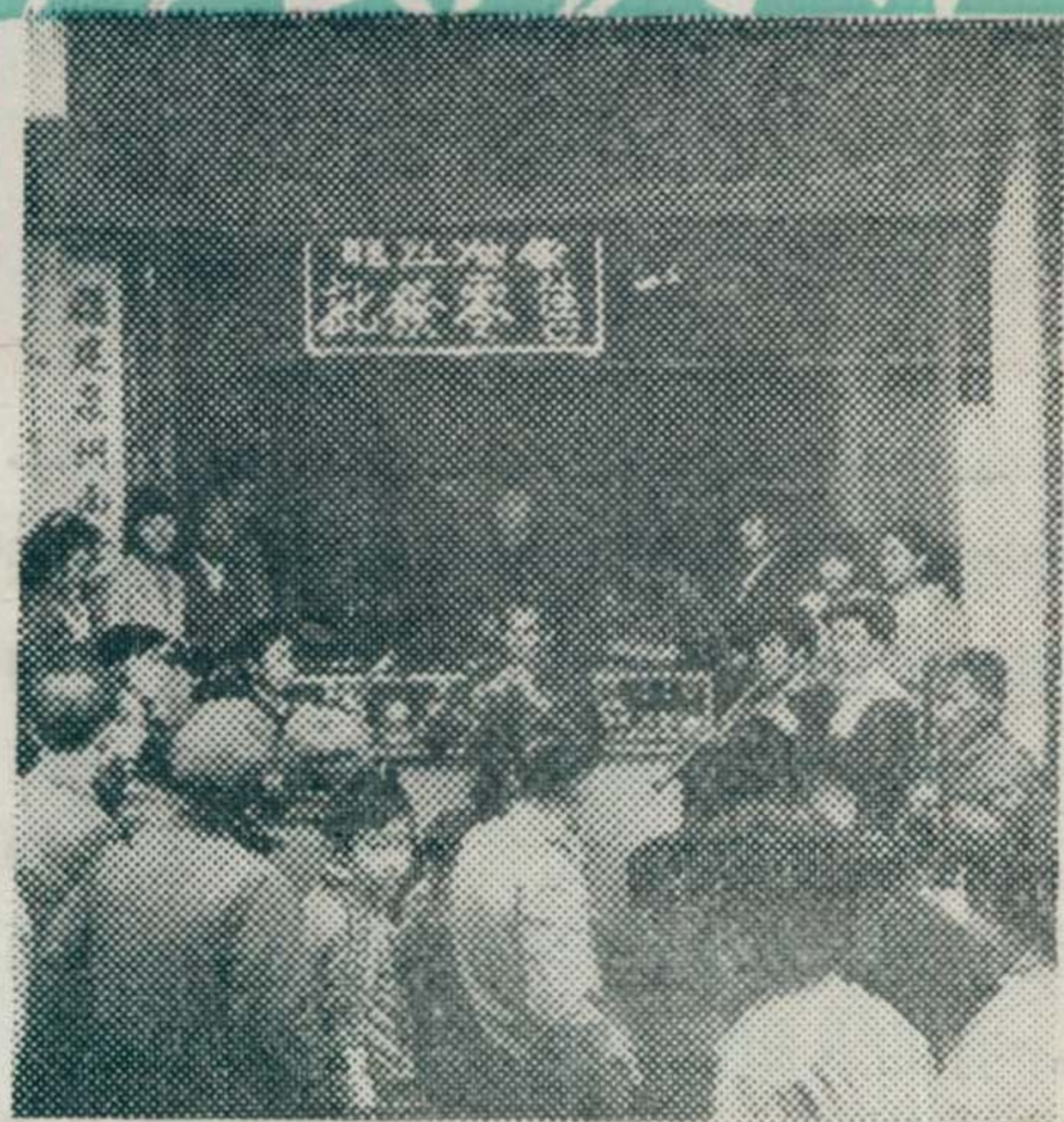
▲ 市南音研究社在演唱

苦钻研，提高业务水平。此外，也可以吸引更多的南音爱好者，参加到学习的行列中来，扩大了培养对象，造就更多人材。