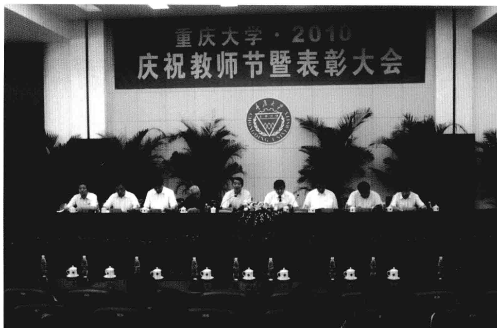
9月9日，重庆大学举行庆祝教师节暨表彰大会