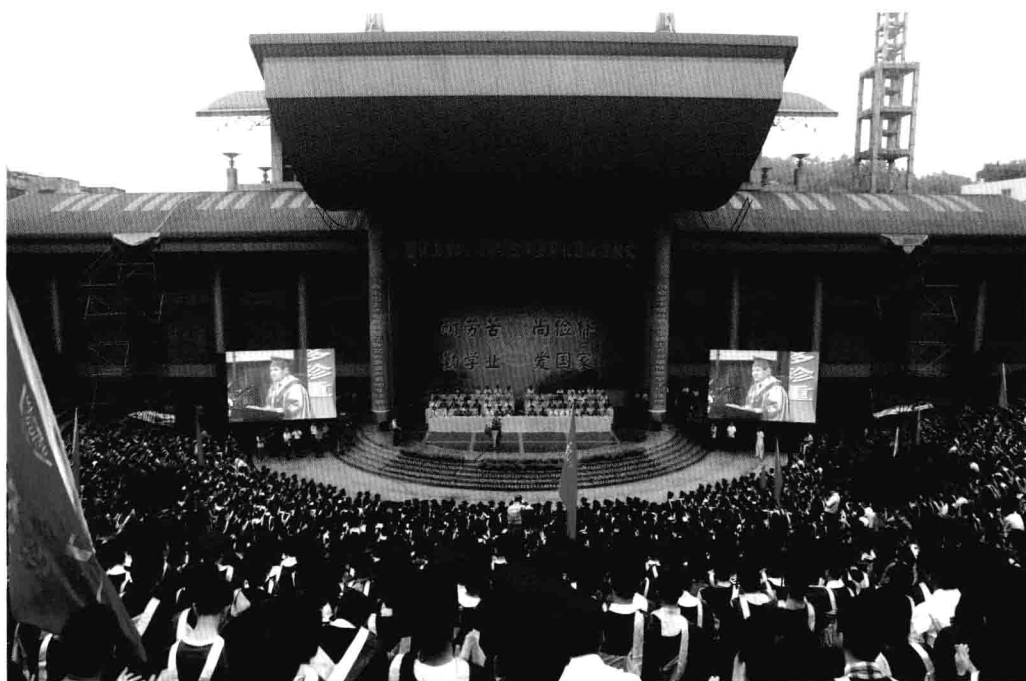
6月28日，重庆大学举行2010届学生毕业典礼暨授位仪式