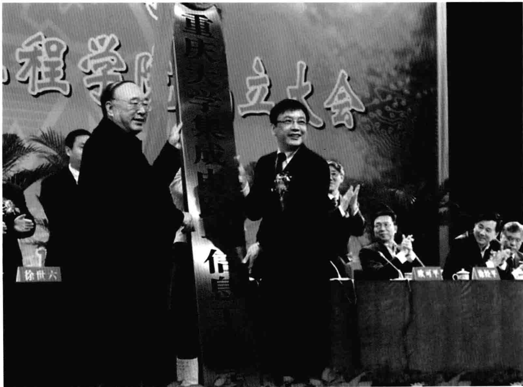
12月16日，重庆大学集成电路与信息工程学院成立，重庆市市长黄奇帆为重庆大学集成电路与信息工程学院授牌