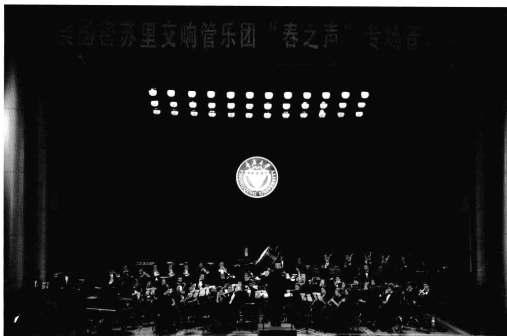
4月7日，美国密苏里交响管乐团来校巡演