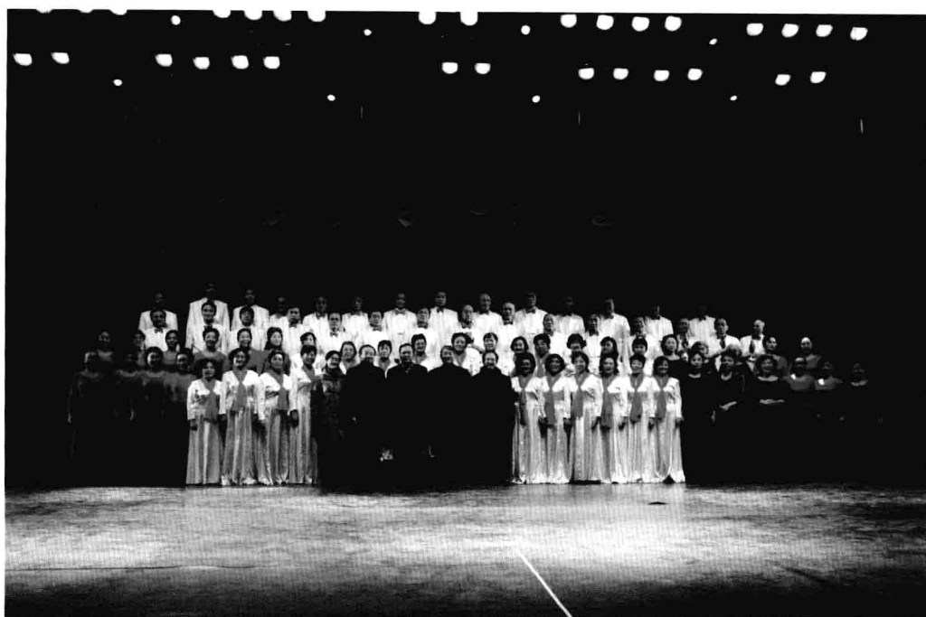
12月29日，重庆大学举行2011年新年晚会