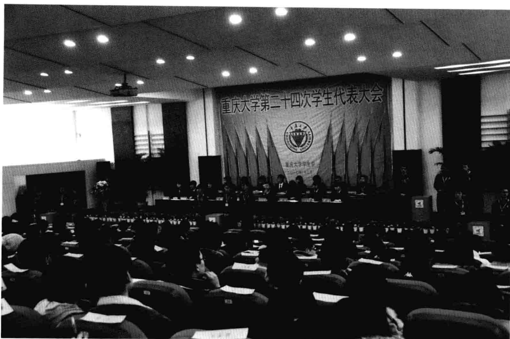
12月26日，重庆大学第二十四次学生代表大会在民主湖学术报告厅举行