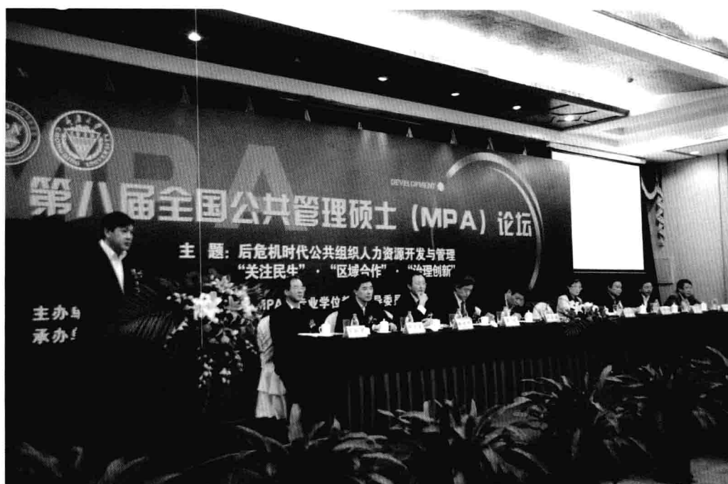
11月27日，第八届全国公共管理硕士（MPA）论坛在重庆大学举行