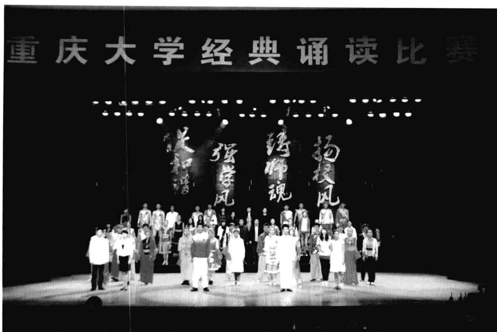
11月18日，重庆大学举行经典诵读比赛