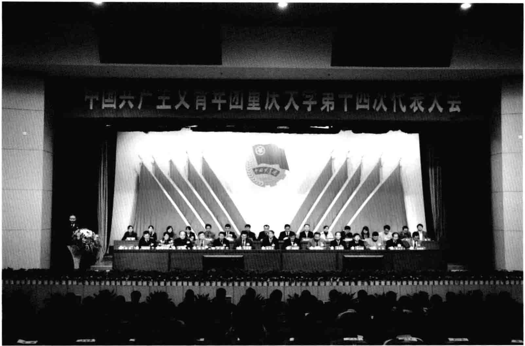
12月5日，中国共产主义青年团重庆大学第十四次代表大会隆重召开