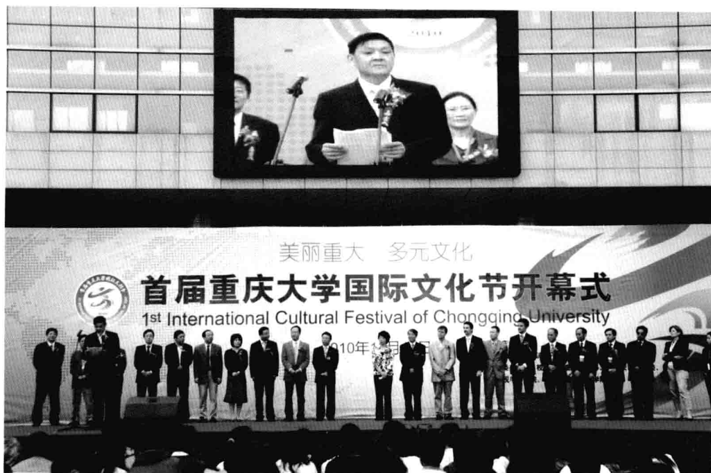
10月12日，重庆大学举行首届国际文化节