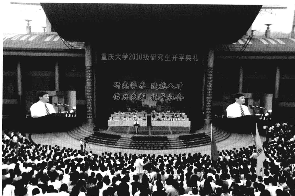
9月8日，重庆大学举行2010级研究生开学典礼