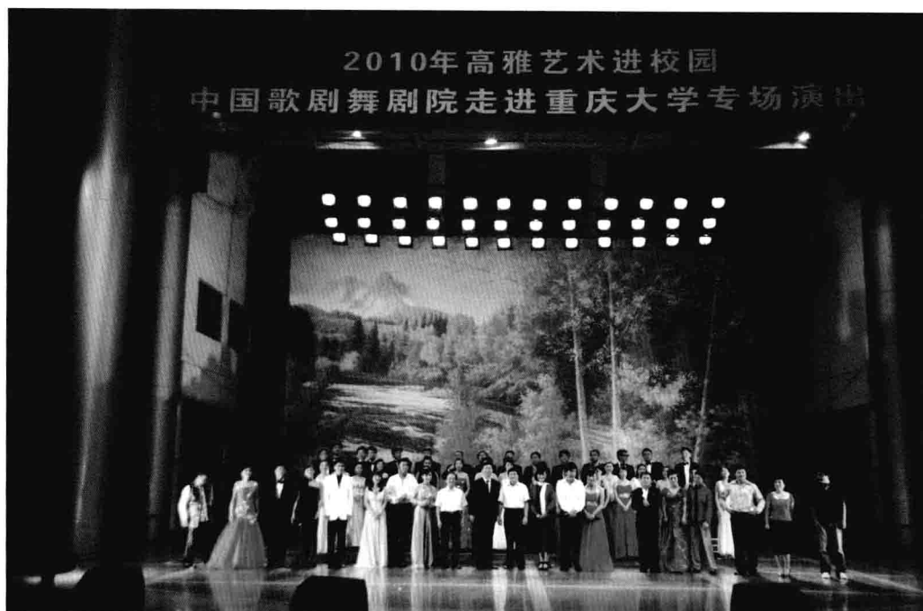
6月22日，2010年高雅艺术进校园——中国歌剧舞剧院走进重庆大学专场演出