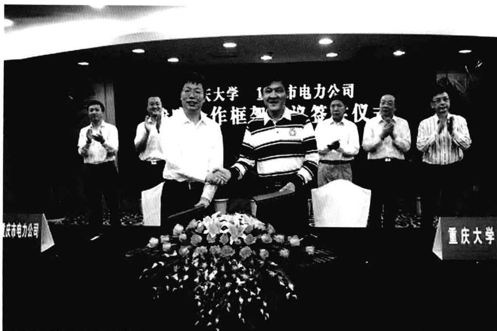
9月26日，重庆大学和重庆市电力公司签署《重庆市电力公司重庆大学战略合作框架协议》