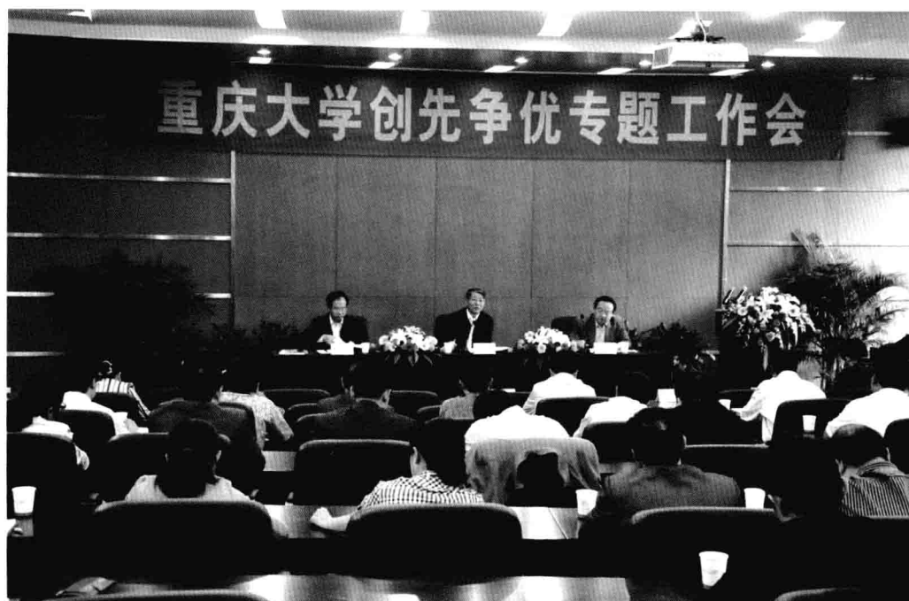
10月20日，重庆大学举行“创先争优”专题工作会