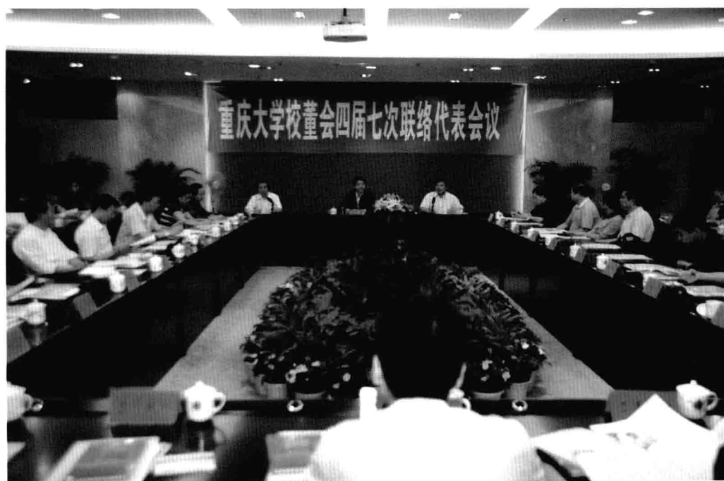
6月10日，重庆大学举行校董会四届七次联络代表会议