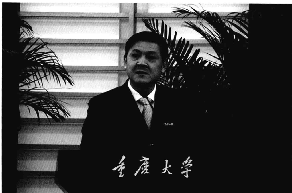
12月23日，重庆大学原校长李晓红在全校干部大会上讲话