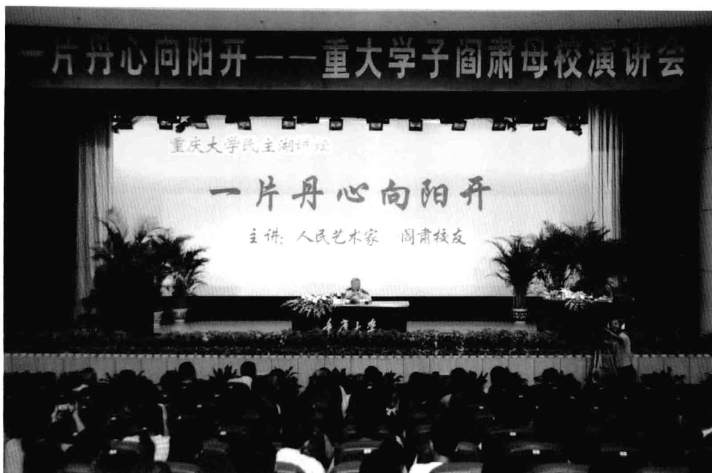
9月6日，著名词作家阎肃校友在重庆大学讲学