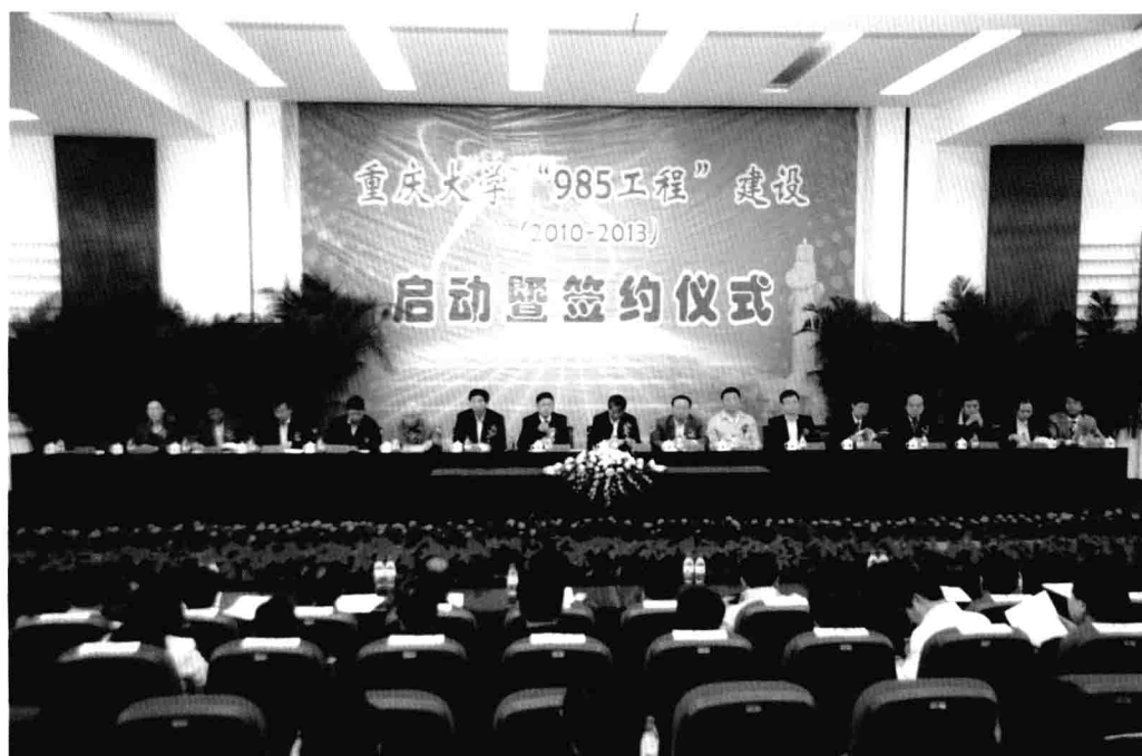
10月12日，重庆大学举行新一轮“985工程”建设启动暨签约仪式