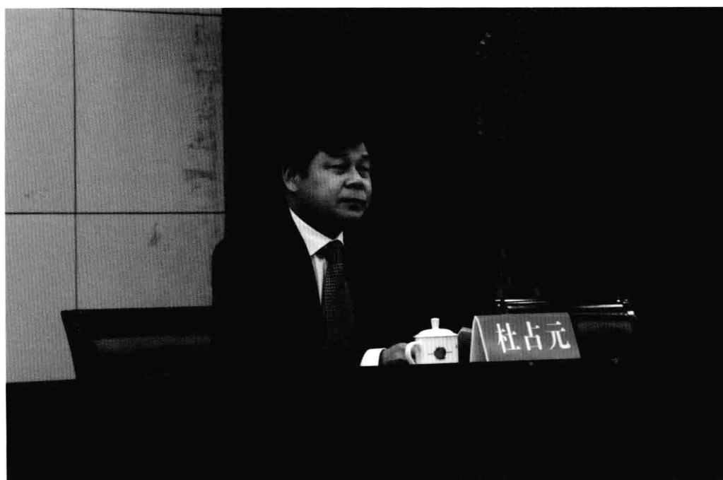
12月23日，教育部副部长、党组成员杜占元在全校干部大会上讲话