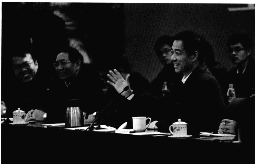
1月16日，重庆市大学生座谈会在重庆大学举行，中共中央政治局委员、重庆市委书记薄熙来出席座谈会并讲话