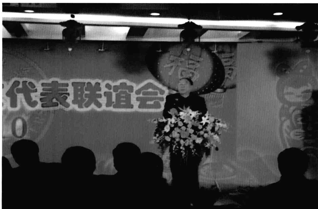
3月3日，重庆市市长黄奇帆出席重庆大学重庆地区校友代表元宵节联谊会