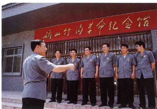
组织干警接受革命传统教育。