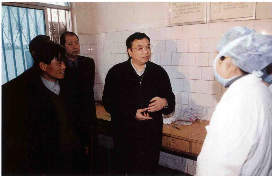
2003年4月2日，中共河南省委书记李克强（中）在上蔡县“非典”隔离点进行工作调研。