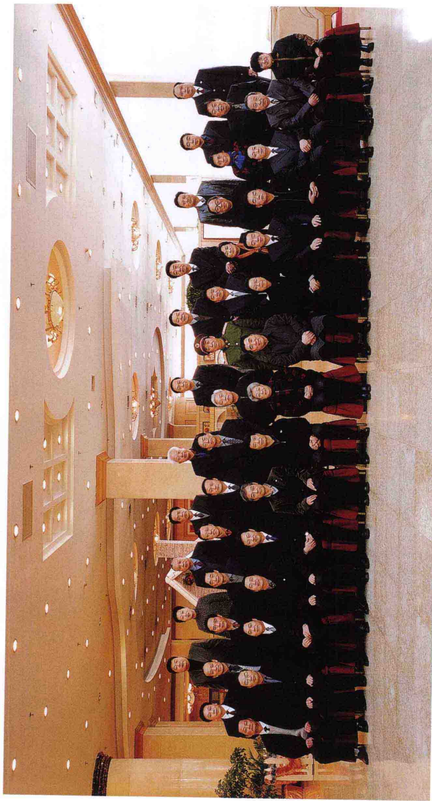
2003年12月18日至19日，中共中央政治局委员、国务院副总理吴仪（前排中）在驻马店市视察工作，图为视察期间与省市领导合影。