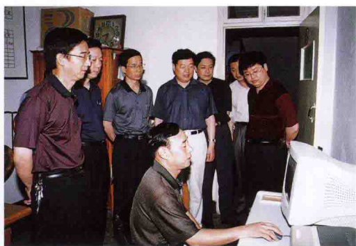
市领导参观红飘带网站。