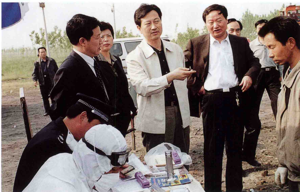
2003年5月10日，市委副书记、市长宋璇涛（中）到107国道宋集检查点检查“非典”预防工作。