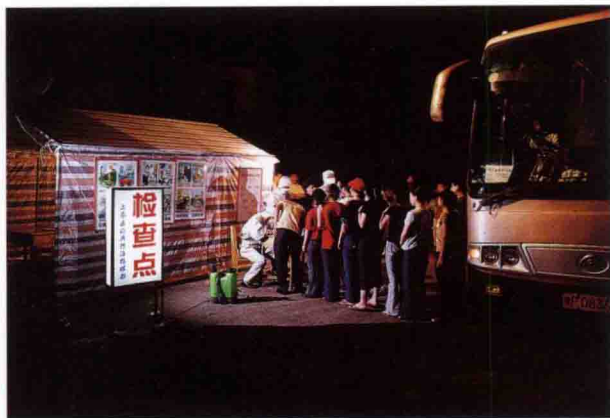
各乡村交通要道都设立了健康检查点，对返乡人员在入村之前进行身体检查并造册登记。