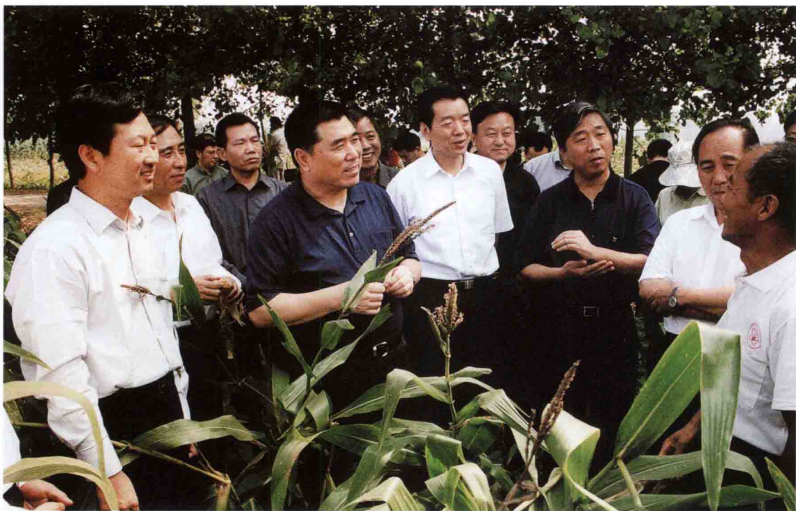
2003年9月12日，中共河南省委副书记、省长李成玉（前左三）深入汝南县、平舆县察看灾情、慰问群众。