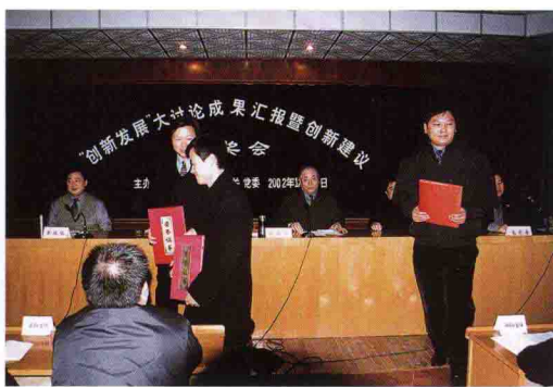
“创新发展”大讨论成果汇报会。