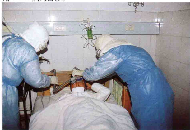
市中心医院隔离病房的医护人员正全力抢救重症SARS患者。