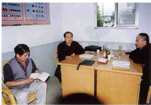
院领导坚持检察长接待日制度。