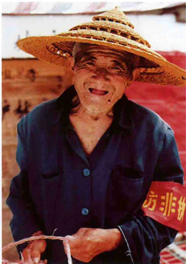
全民皆兵，众志成城，年已古稀的老人自觉加入“非典”防治工作中。