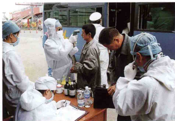
107国道健康检查站的工作人员为入境旅客进行健康检查登记。