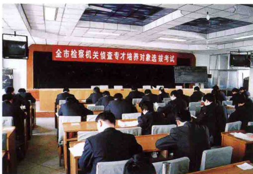
检察机关侦查专才培养对象选拔考试现场。