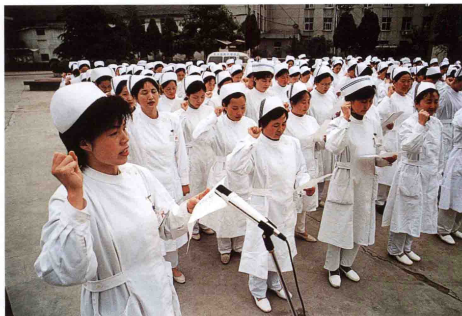
市中心人民医院全体护理人员宣誓，积极要求加入抗击“非典”第一线。

2003年4月，一场突如其来的“非典”疫情灾难性地席卷了中华大地，严重地威胁着人民群众的生命安全。我市也先后出现了4例输入性SARS病例和1例疑似病例，与此同时，数十万打工人员相继从疫区返乡，给疾病的有效控制带来严峻考验。在此紧急关头，市委、市政府领导全市人民团结一致，沉着应对，打响了一场抗击“非典”的人民战争。在这场特殊的战争中，我市广大党员干部特别是医务工作者不怕牺牲，顽强奋战，谱写了一曲“万众一心、众志成城、团结互助、和衷共济、迎难而上、敢于胜利”的恢弘乐章，赢得了这场战争的全面胜利。虽然这场没有硝烟的战争结束了，但那一幅幅动人的画面至今令人鼓舞、催人奋进。