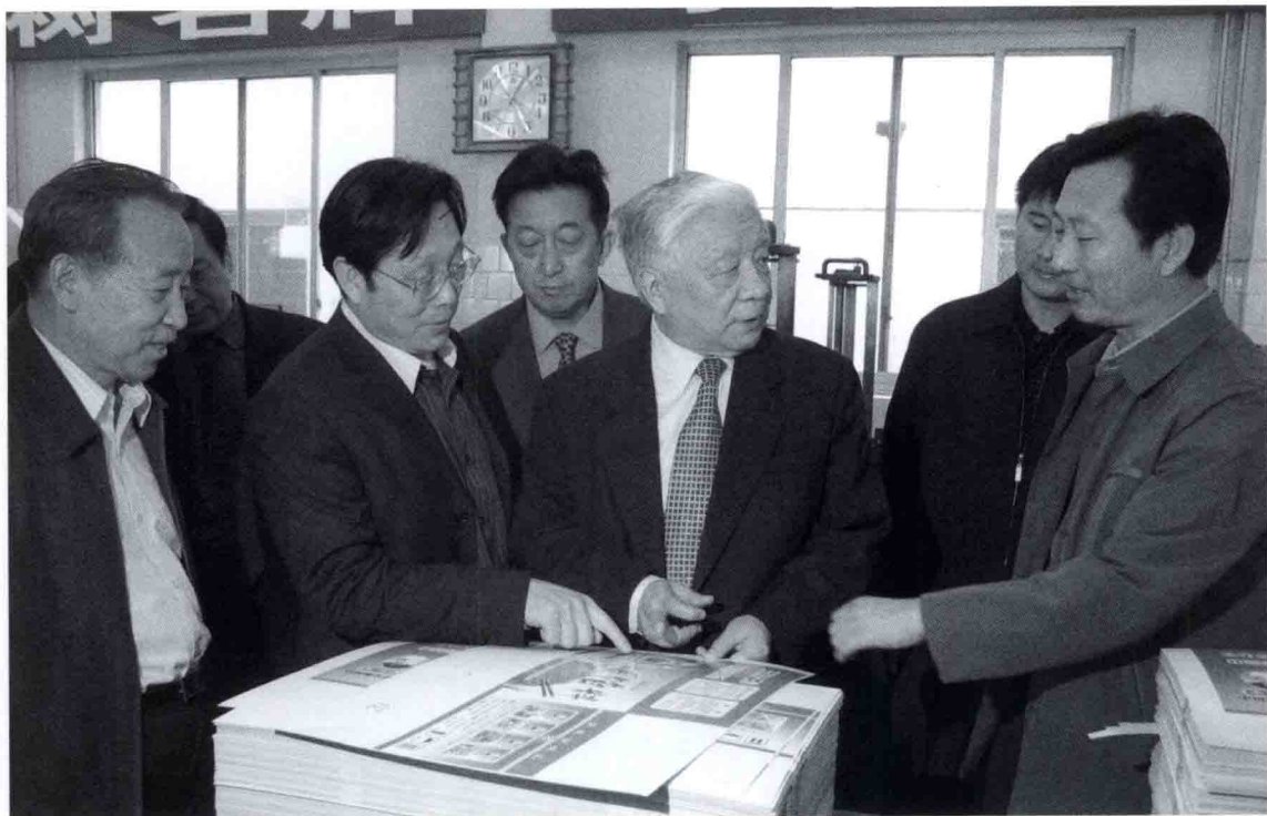
2003年10月28日，全国政协副主席王文元（右二）在驻马店市视察工作。