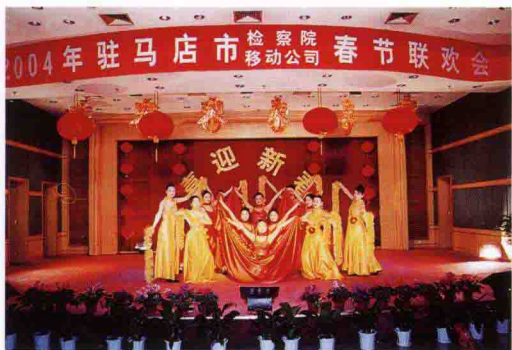
丰富多彩的干警文化生活。