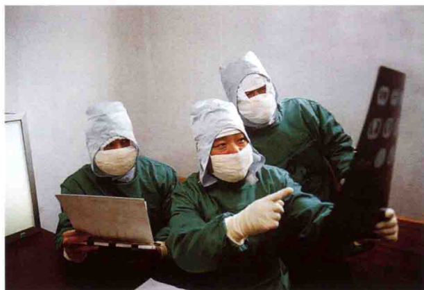
市中心人民医院自“非典”战斗打响以来，共收治2例SARS病人，1例疑似病人，图为该院隔离病区内医务人员给SARS病人会诊。