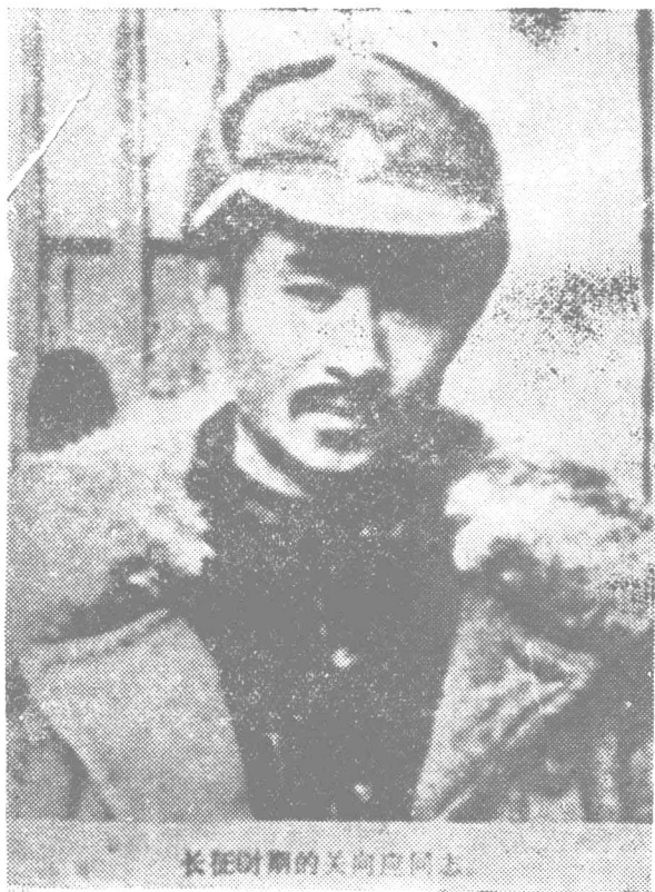
长征时期的关向应同志