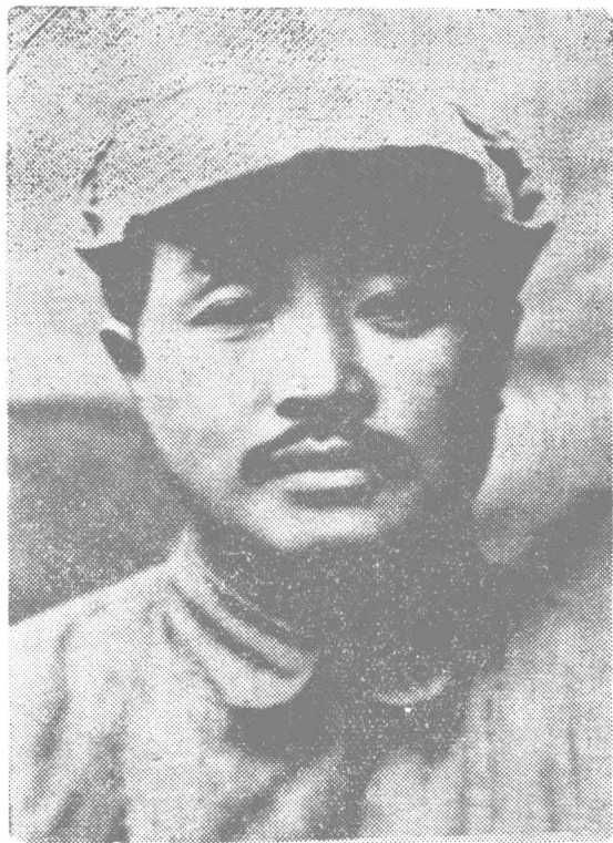
一九三七年时的 任弼时同志