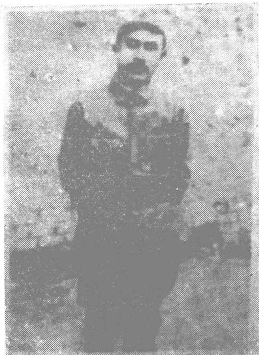
一九三五年时的贺龙同志