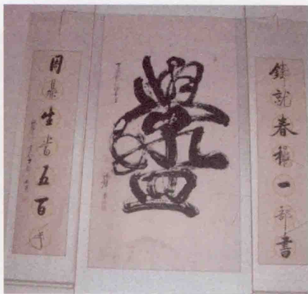
马氏庄园马吉樟宅居中堂对联 (丁亥秋于悟书庐 鸿声书于古都安阳)