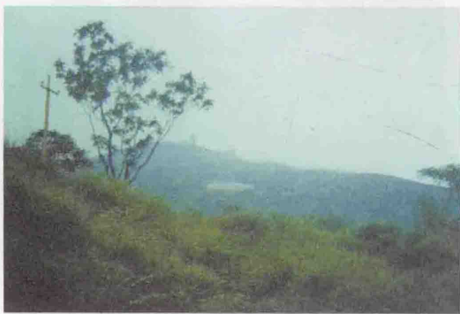
河北邯郸马服山远景