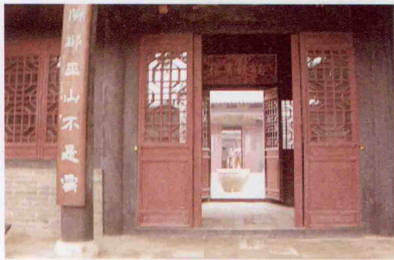
马氏庄园“九门相照”