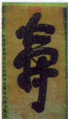
慈禧太后赐马丕瑶寿字中堂