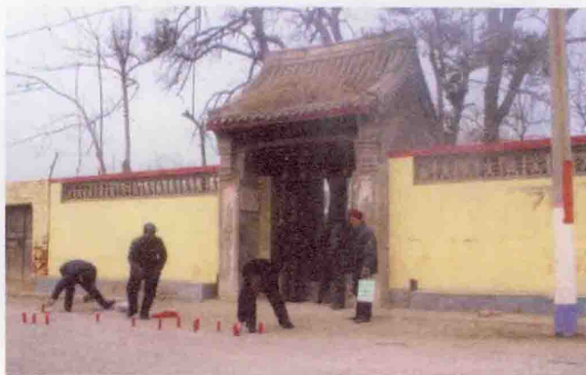
安阳县北务村马氏祠堂