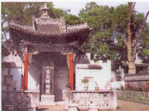
山西洪桐古大槐树遗址