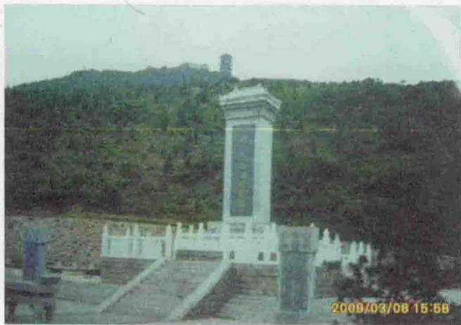
河北邯郸马姓始祖赵奢墓