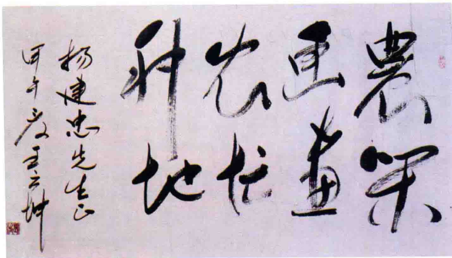
原吉林省委书记王云坤题字