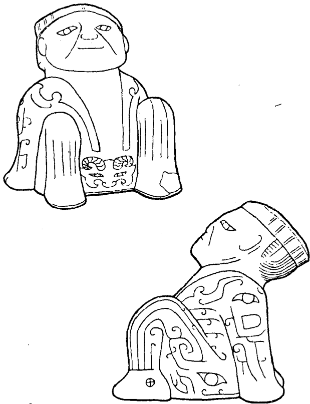
图2 商:平顶帽,翻领绣纹衣贵族白石雕像 (安阳四盘磨村出土)