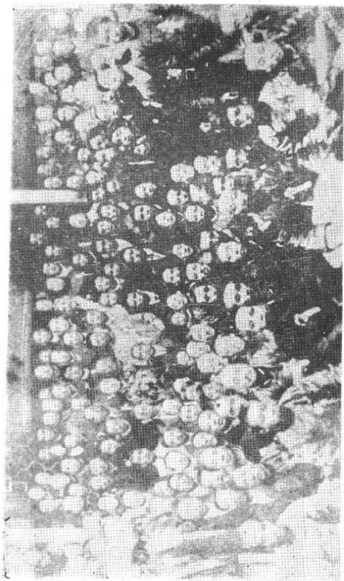
孙中山先生于一九一二年四月九日访汉慰问辛亥首义同志与孙武先生及各 界代表一百五十人合影