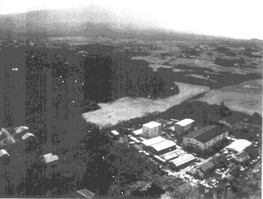
頂上終年白雪皚皚的富士山下，有一片邪惡的土地。真理教富士宮總部建築物俯瞰圖。