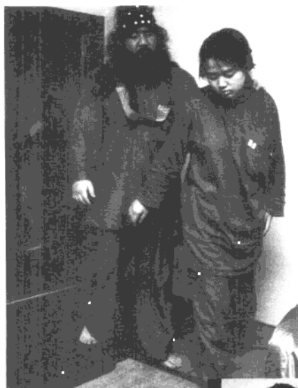
麻原彰晃在3.20慘案前不久，似患重病，身體極為虛弱，連走路也需女信徒扶持。