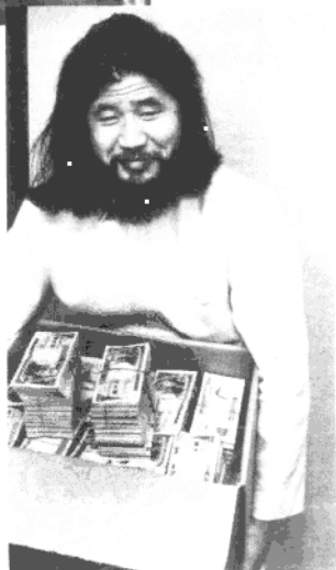
真理教教主麻原彰晃在三億日元失而復得時攝。（查實係內部“擺烏龍”）