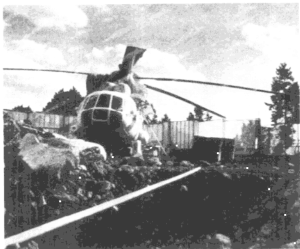
真理教購自俄羅斯的蘇製直昇機。