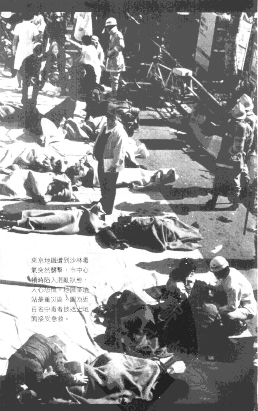
東京地鐵遭到沙林毒氣突然襲擊，市中心頓時陷入混亂狀態，人心恐慌。地鐵築地站是重災區，圖為近百名中毒者被送上地面接受急救。