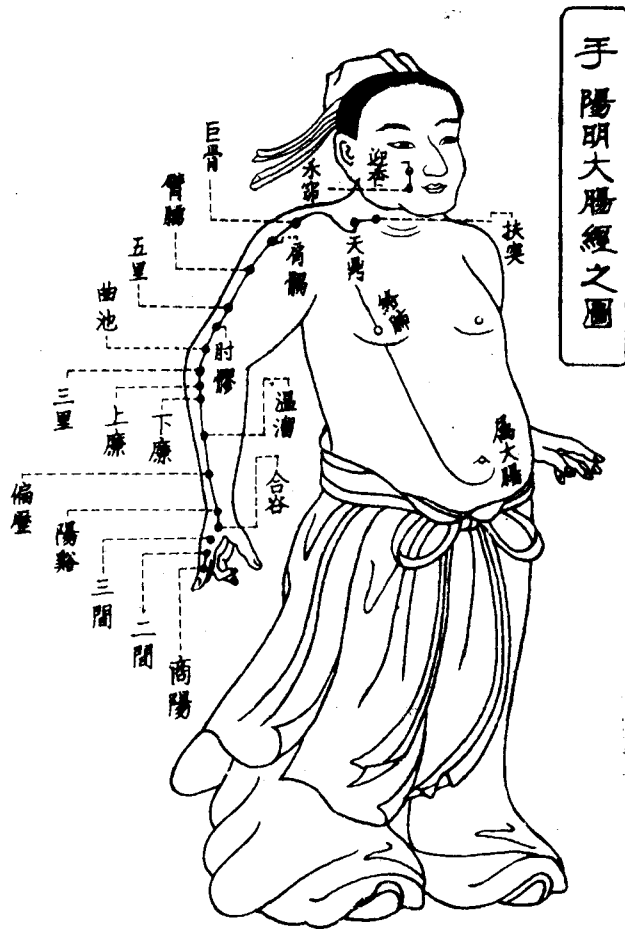
手陽明大腸經之圖