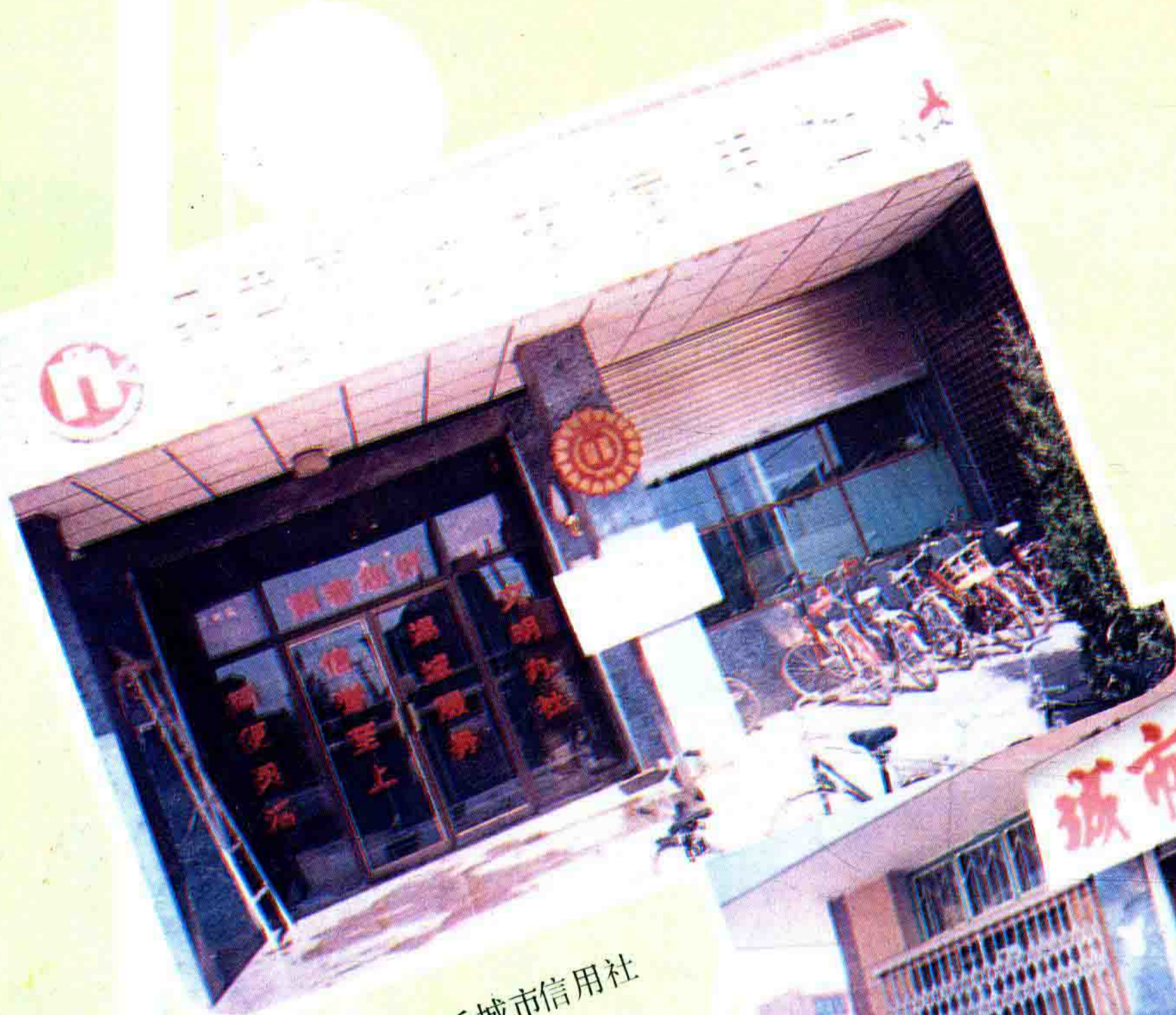
吴忠市中华桥城市信用社