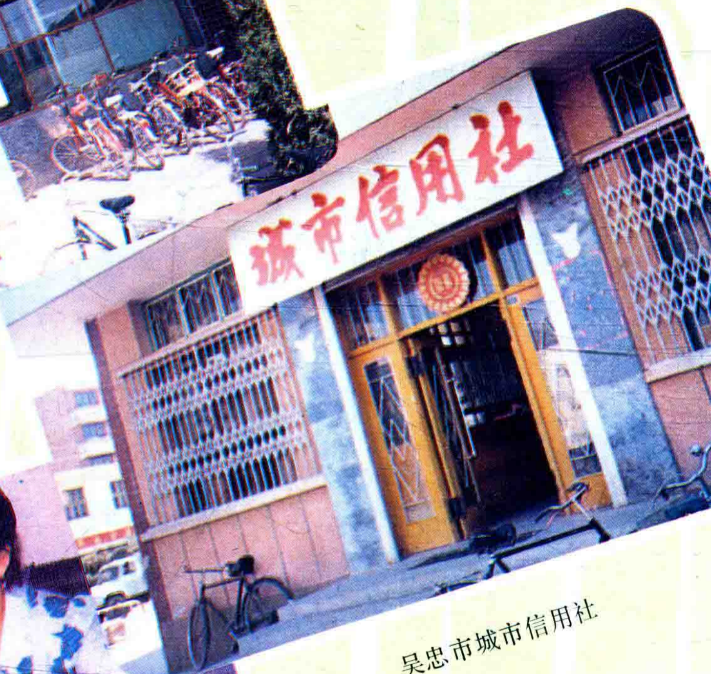
吴忠市城市信用社