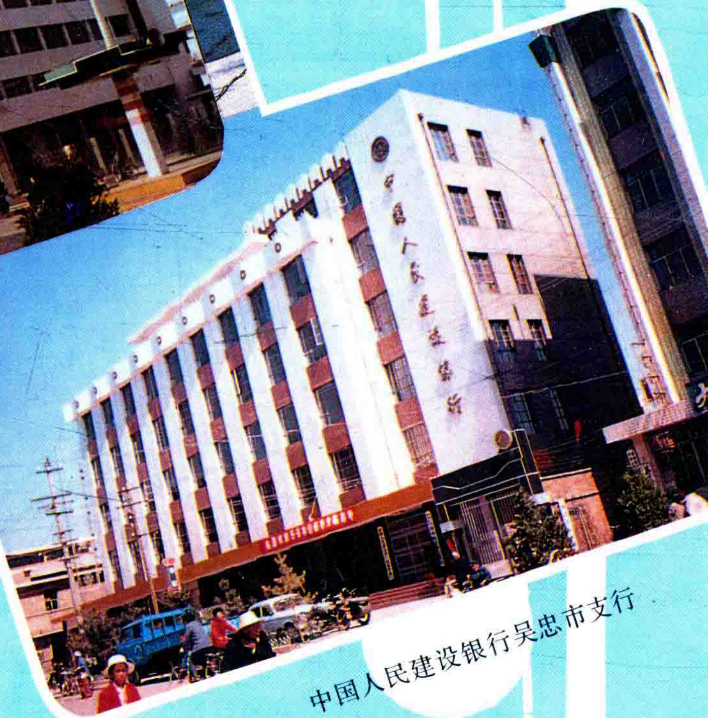
中国人民建设银行吴忠市支行