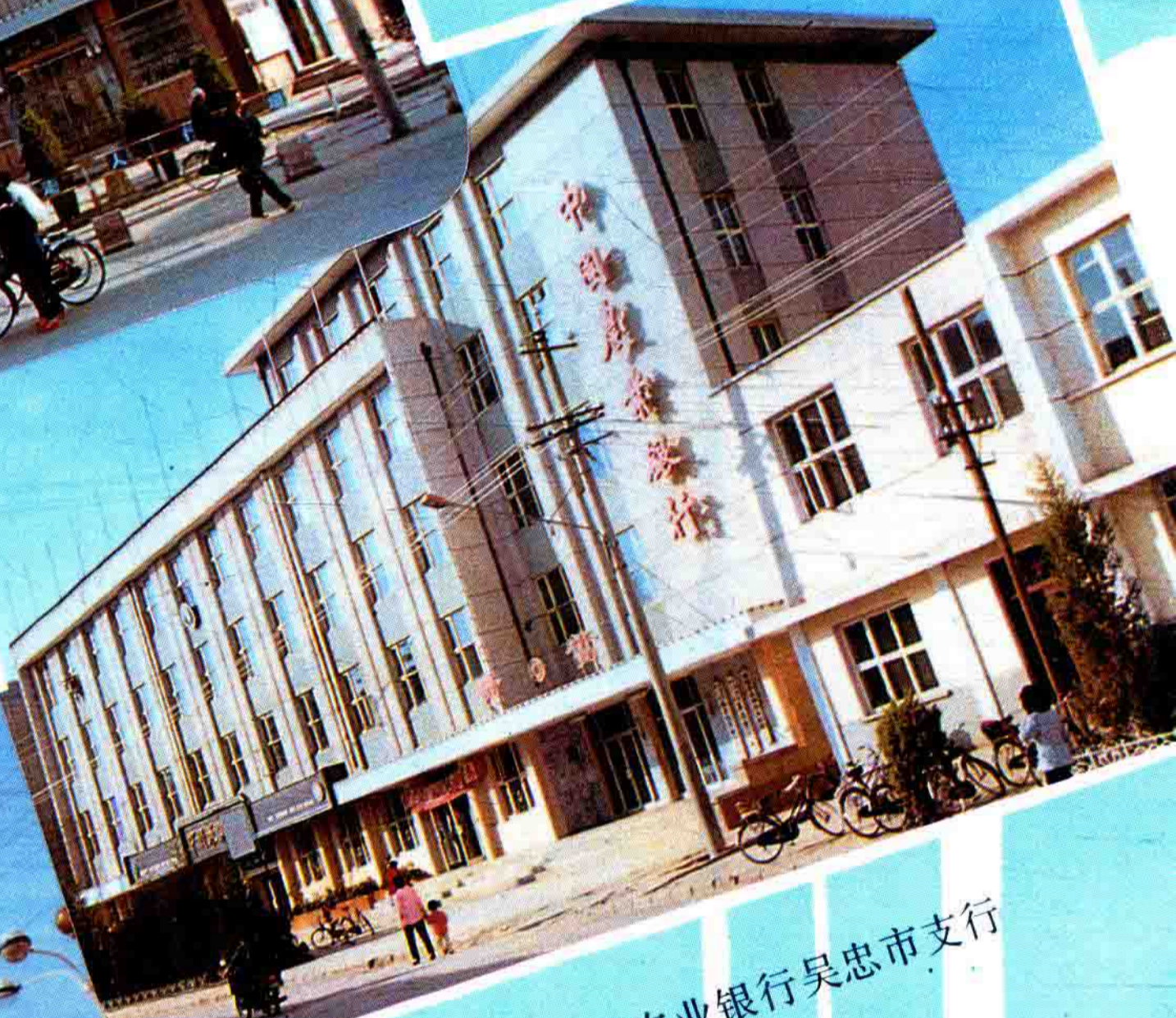
中国农业银行吴忠市支行