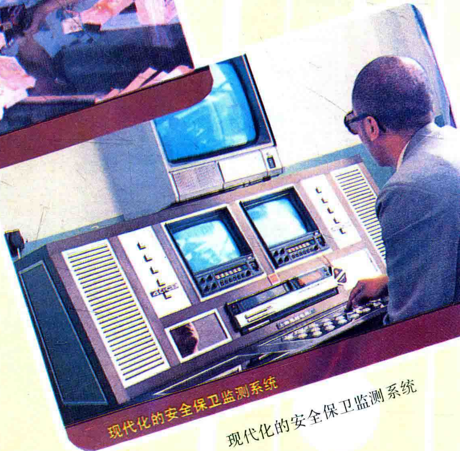
现代化的安全保卫监测系统