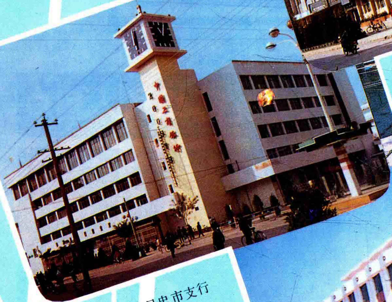
中国工商银行吴忠市支行