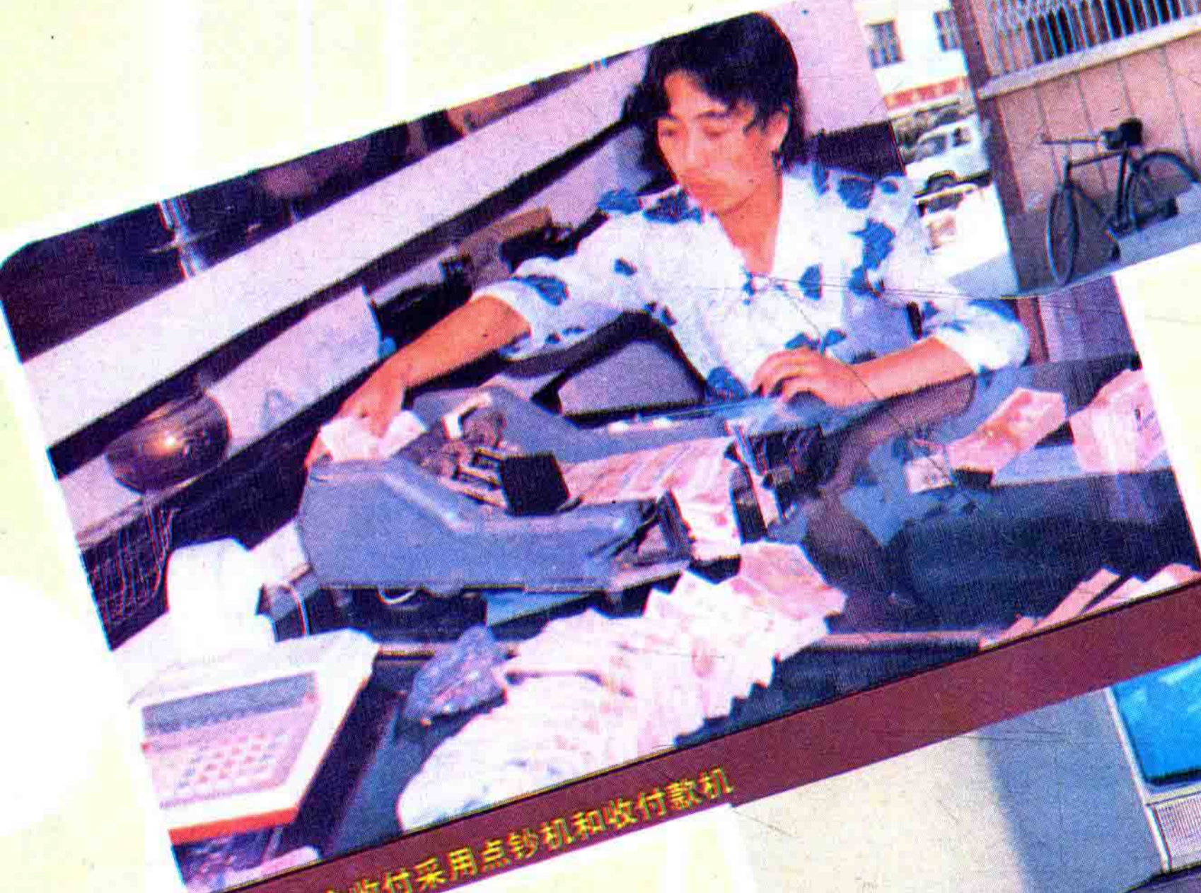
现金收付采用点钞机和收付款机