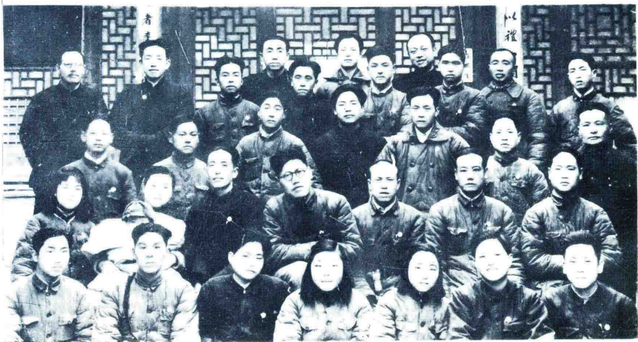
1950年3月中國人民銀行吳忠堡支行成立時全體員工合影