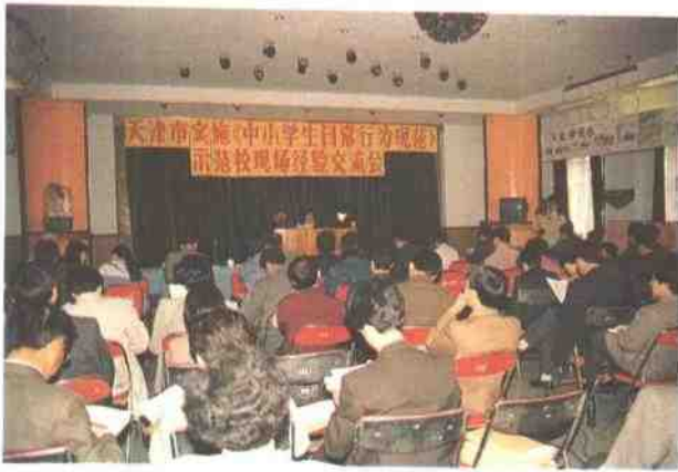
天津市在石化一小召开《中小学生日常行为规范》示范校现场经验交流会。