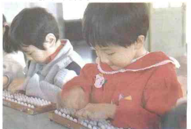
幼儿园孩子们在参加珠算比赛。