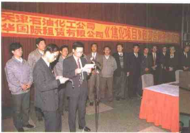
95年4月14日，延迟焦化工程实行总承包签字。