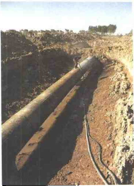
供排水厂宝坻水源地下管道防腐工程95年3月15日开始动工。