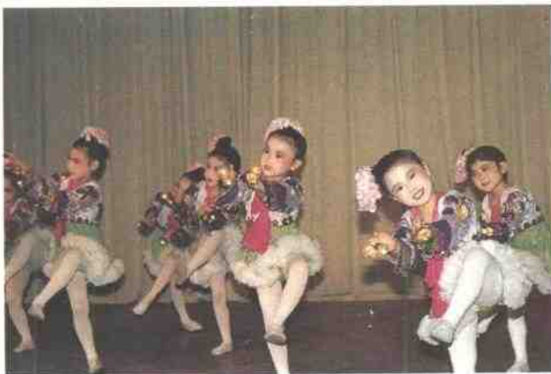
八幼小朋友表演舞蹈：《风铃牛》