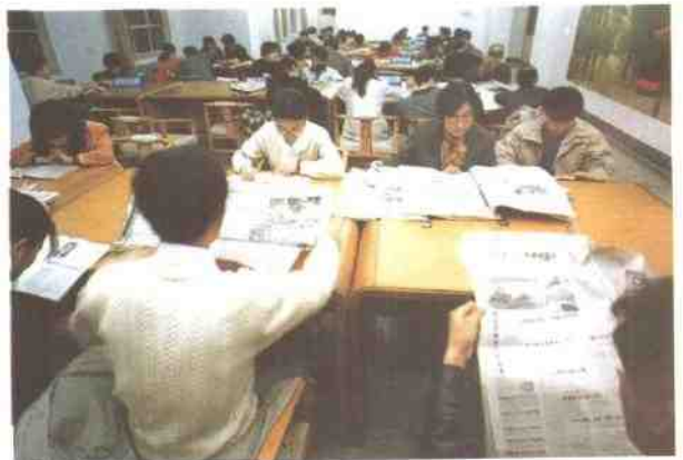
公司新建成的图书馆，每天吸引了众多的读者。