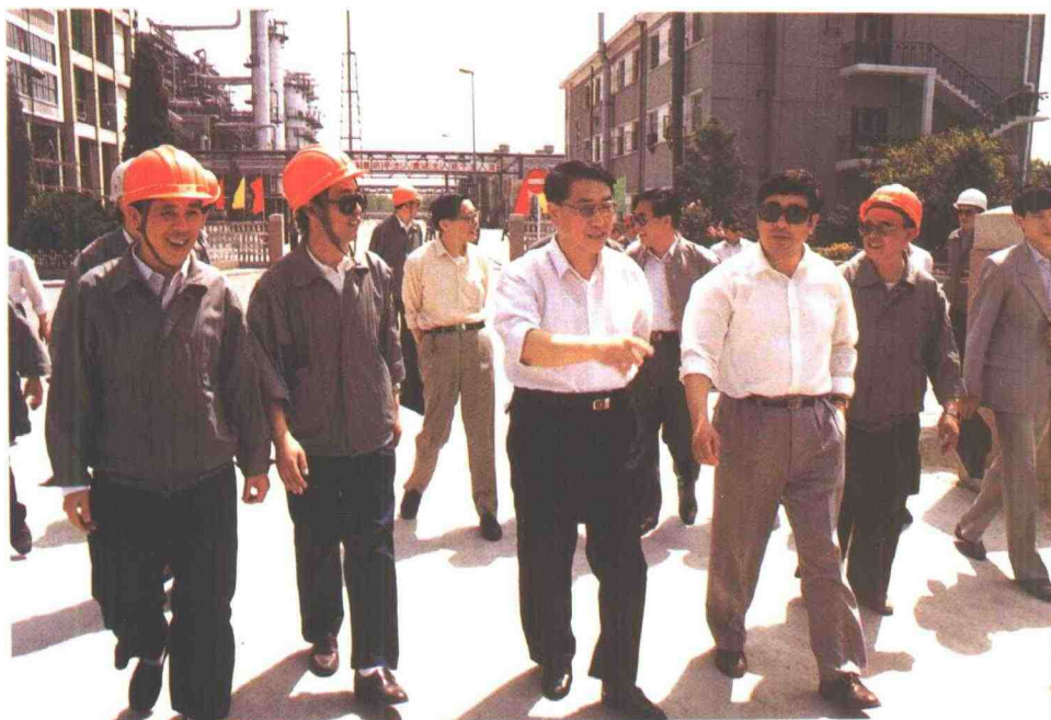
天津市委书记高德占来公司视察工作。