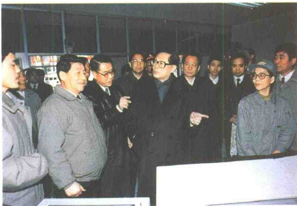
江泽民总书记在化工厂芳烃车间主控室询问生产情况。