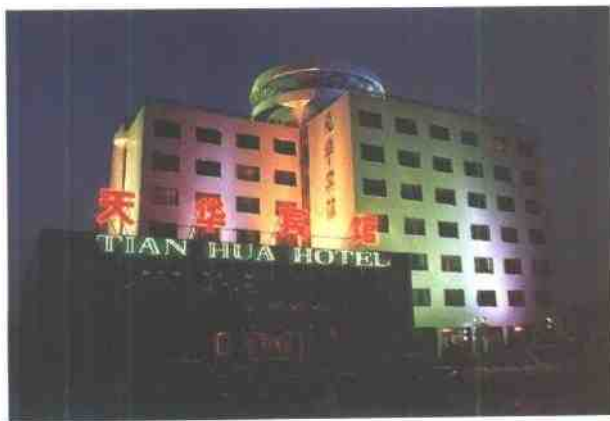
新扩建的天华宾馆夜景