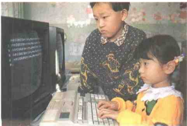
第七幼儿园的孩子们在电脑培训班认真打字。