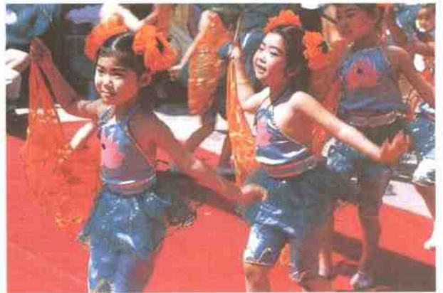
托幼办举办丰富多彩、活泼可爱的幼儿舞蹈节目。