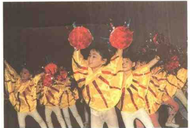
师花幼儿园表演舞蹈：《跨世纪的太阳》