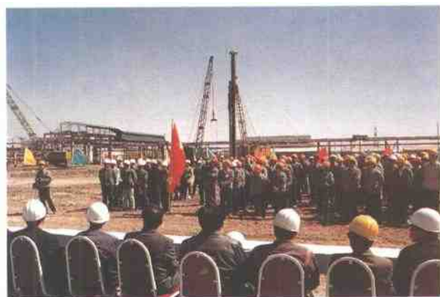
延迟焦化工程开工大会会场。