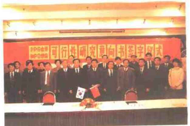
三石化厂与南韩签订PPG合资和Po供应可行性研究意向书。