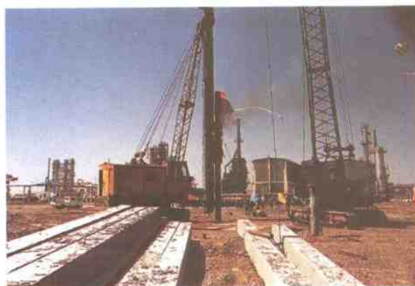
延迟焦化工程施工现场。