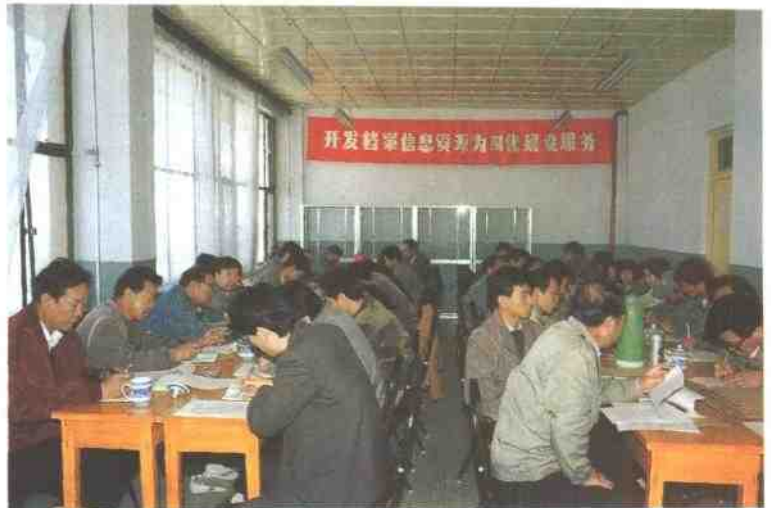
公司召开“开发档案信息资源，为四化建设服务”工作会议。