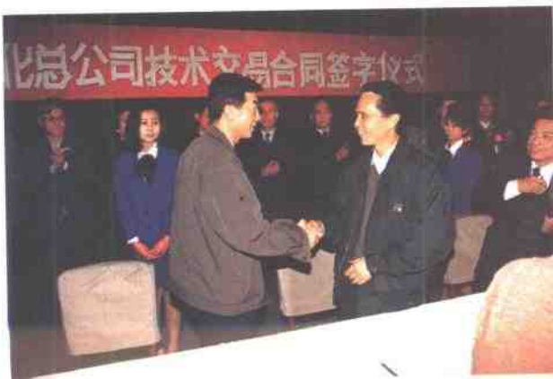
公司与中石化总公司签订技术交易合同。