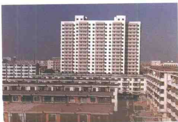
生活区职工高层住宅楼一角