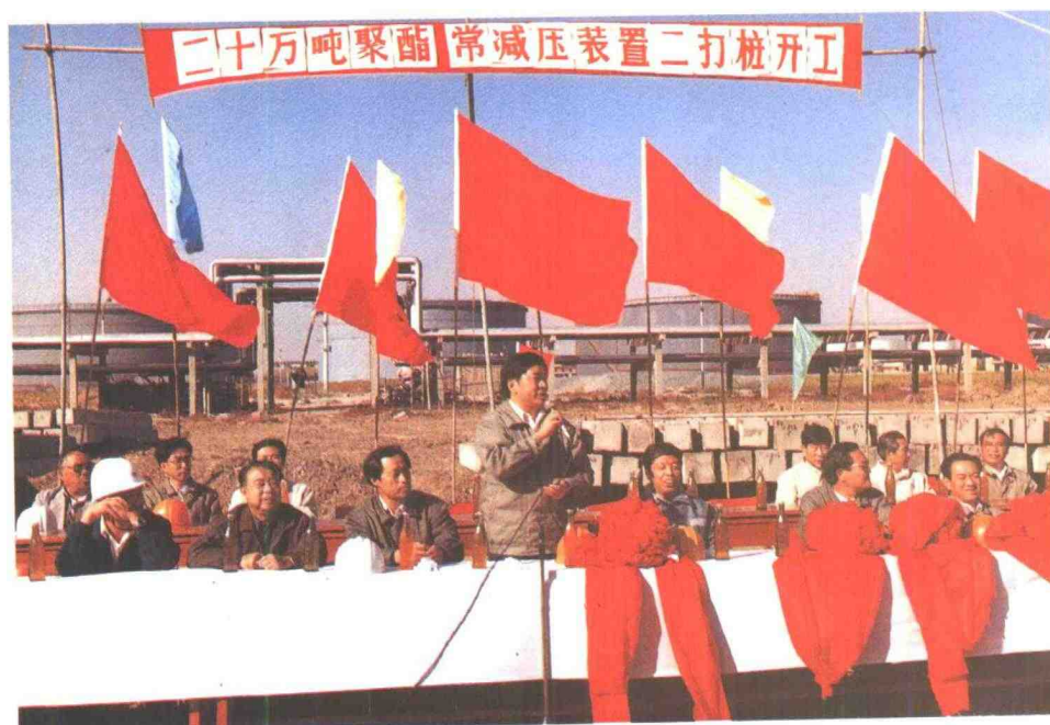
公司举行二十万吨/年聚酯常减压装置打桩开工仪式。