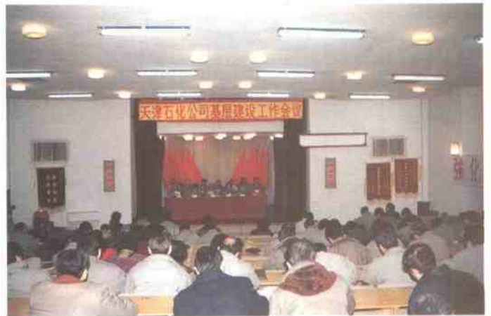
公司召开基层建设工作会议。