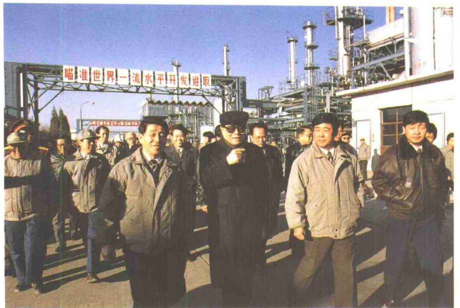
1994年12月12日，江泽民总书记在市委书记高德占、市长张立昌及公司领导李金锐、邢明军等陪同下，兴致勃勃来我公司视察。