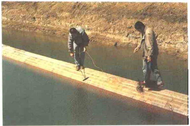
在防腐工程中，技术人员用火花检漏仪测量，检测防腐管道质量。