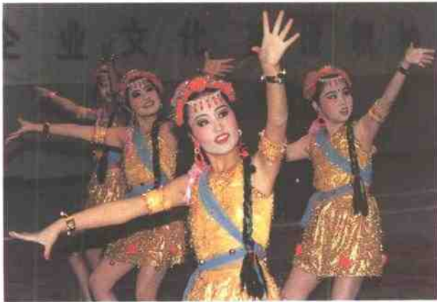
石化二小学生们表演舞蹈：《欢乐的童年》