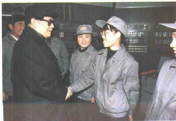
江泽民总书记同工人亲切握手交谈。