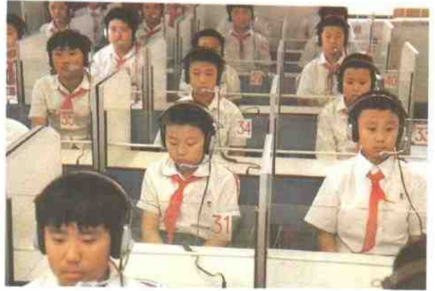
在现代化语言教室上课的石化一小学生们。