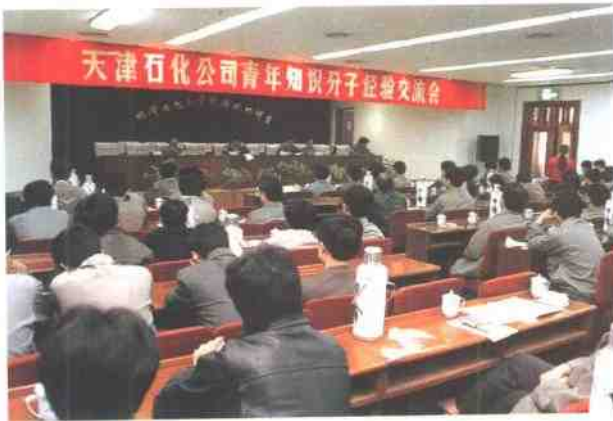
95年3月7日，公司召开“青年知识分子经验交流会”。