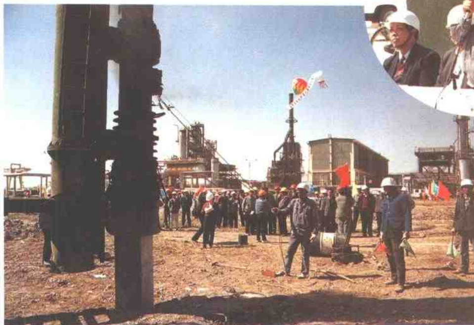
1995年4月25日下午，延迟焦化工程打第一根桩。