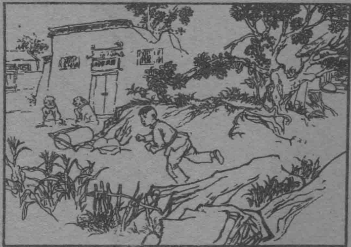
(6) 小嘎子通过暗道,直奔韩家祠堂后面去。