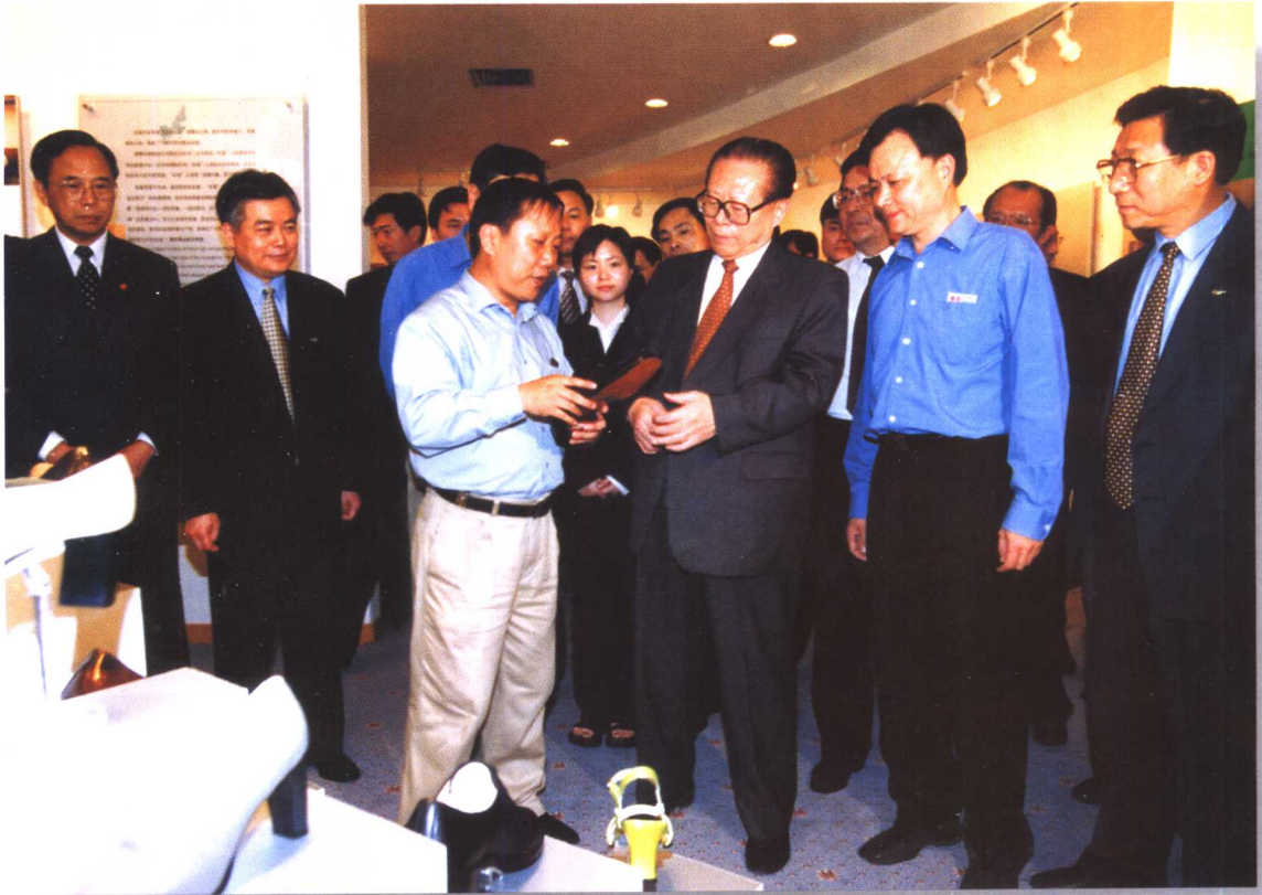
▲国家主席江泽民视察温州长城鞋业公司。图为该公司总经理郑秀康、副总经理周津淼向江泽民主席介绍该公司产品