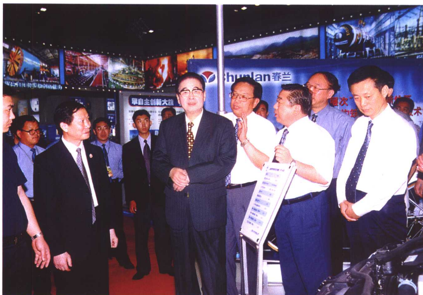
▲李鹏委员长参观国有企业改革与发展暨技术创新成果展览会 轻工业展区