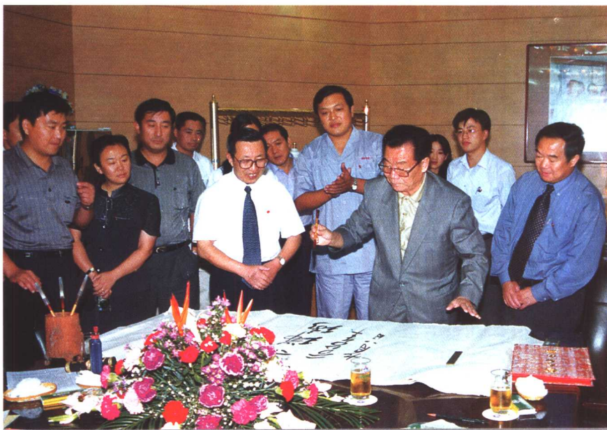
▲ 2000年9月8日，全国政协主席李瑞环视察青岛啤酒集团有限公司