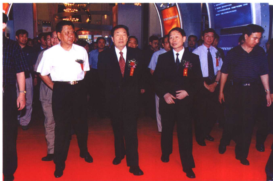
▲朱镕基总理参观国有企业改革与发展暨技术创新成果展览会