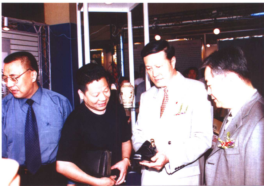
▲国家轻工业局局长陈士能(右二)在第三届温交会上参观温州东艺鞋业公司展品