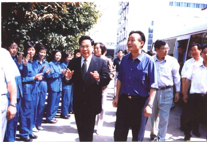
▲ 国务院副总理吴邦国2000年9月16日在绍兴黄酒集团公司董事长邱仁甫陪同下视察该集团公司