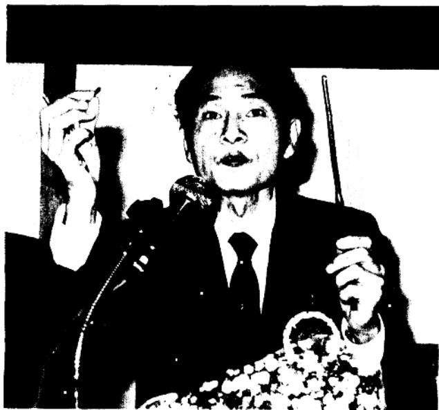
作者1987年在香港講學