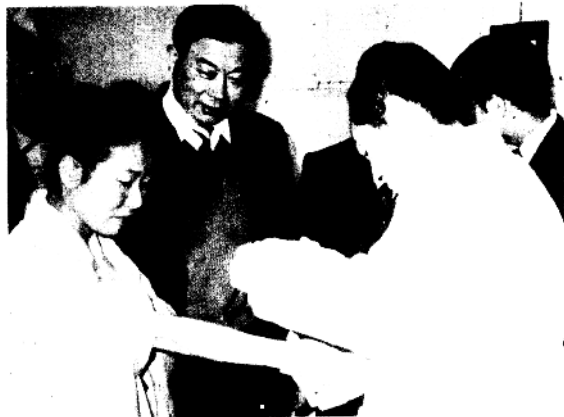
非洲醫生1987年在香港學習刺激神經療法