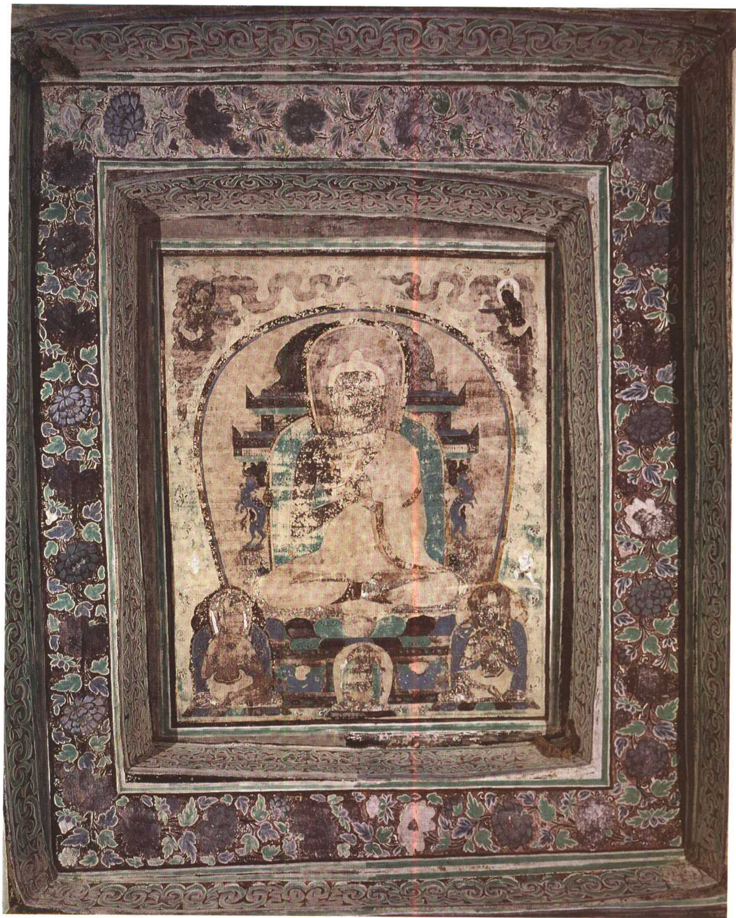
第四六五窟 藻井 大日如来