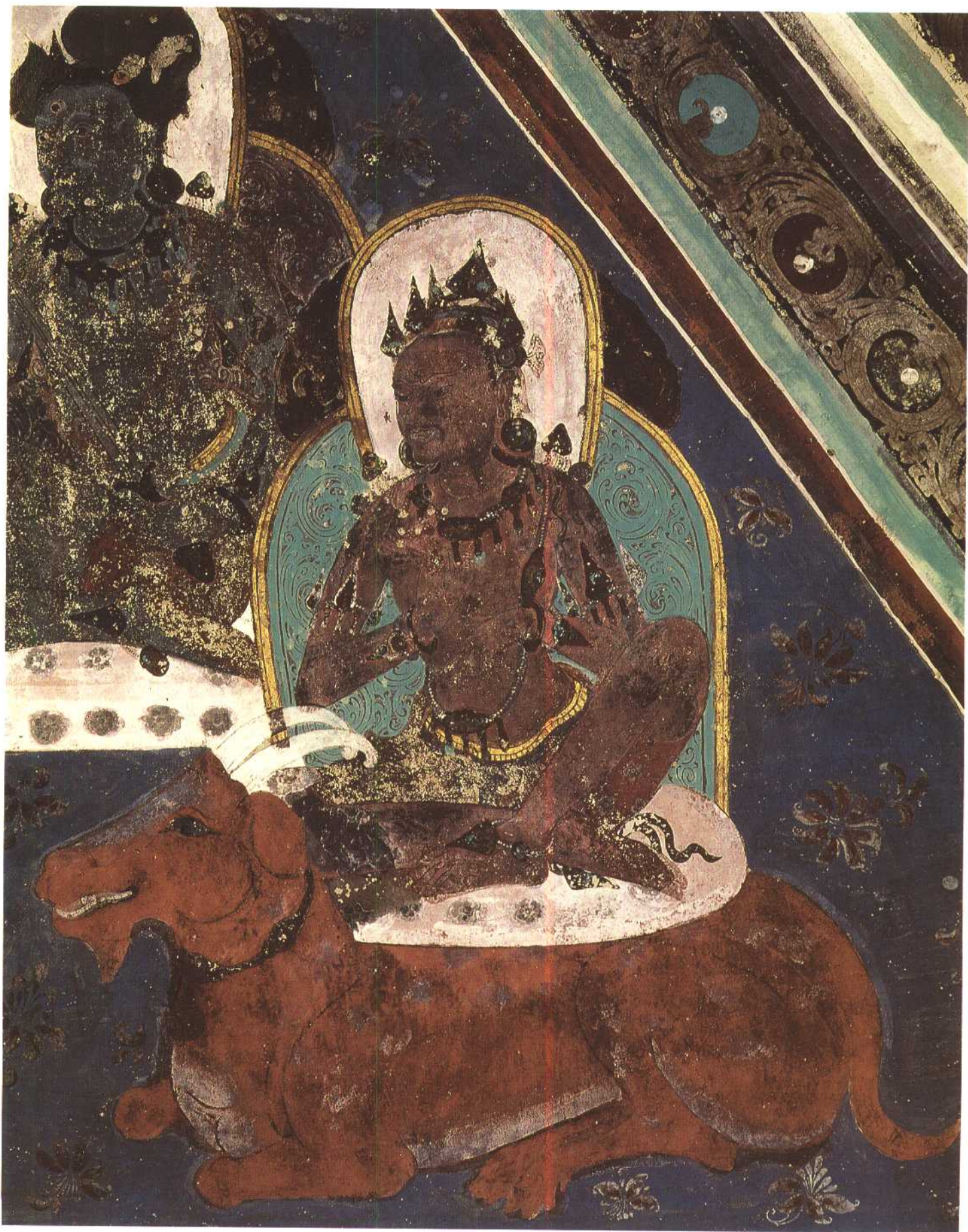
第四六五窟 东披 菩萨