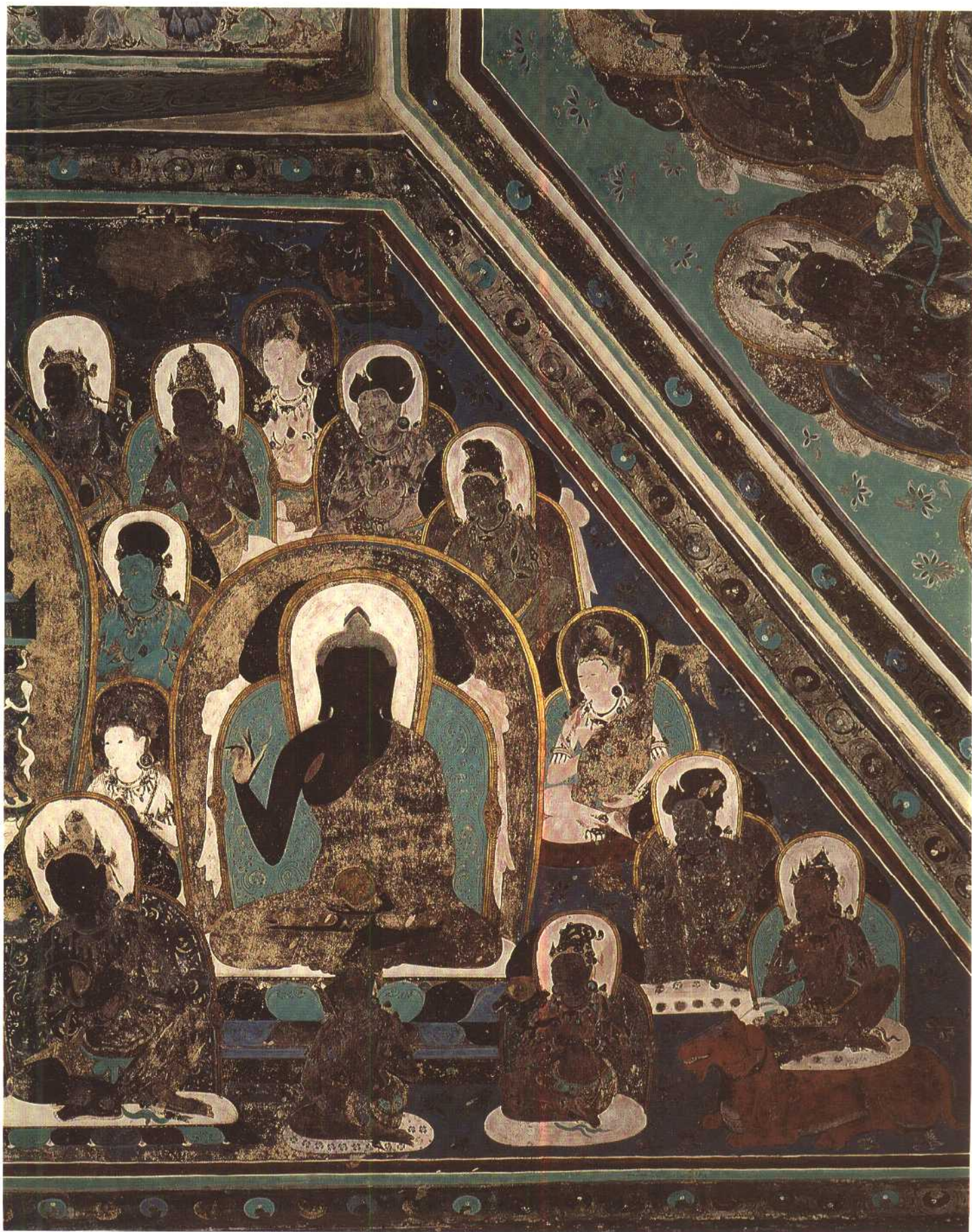
第四六五窟 东坡 佛、菩萨