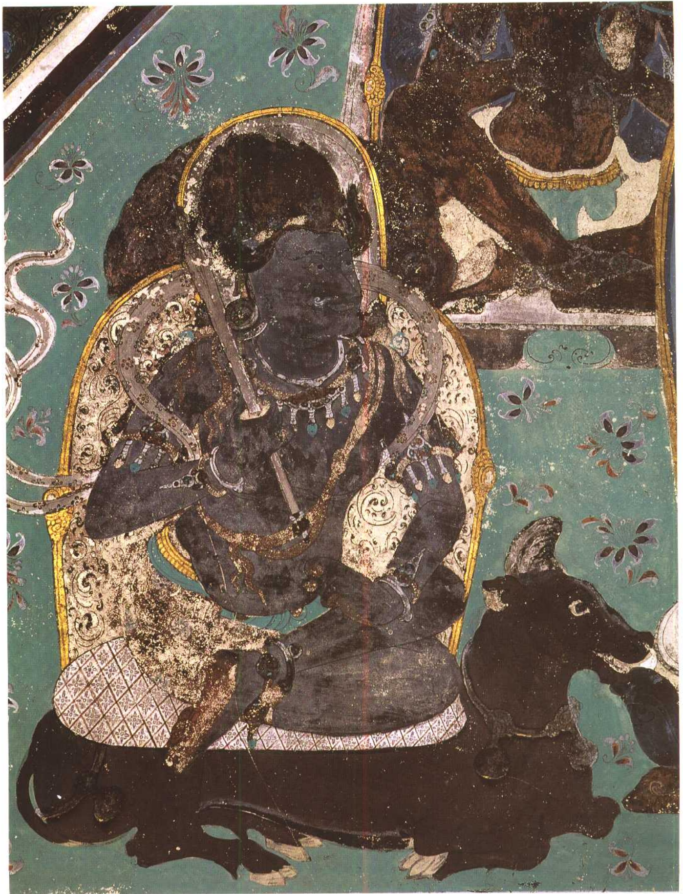
第四六五窟 南披 乘牛护法