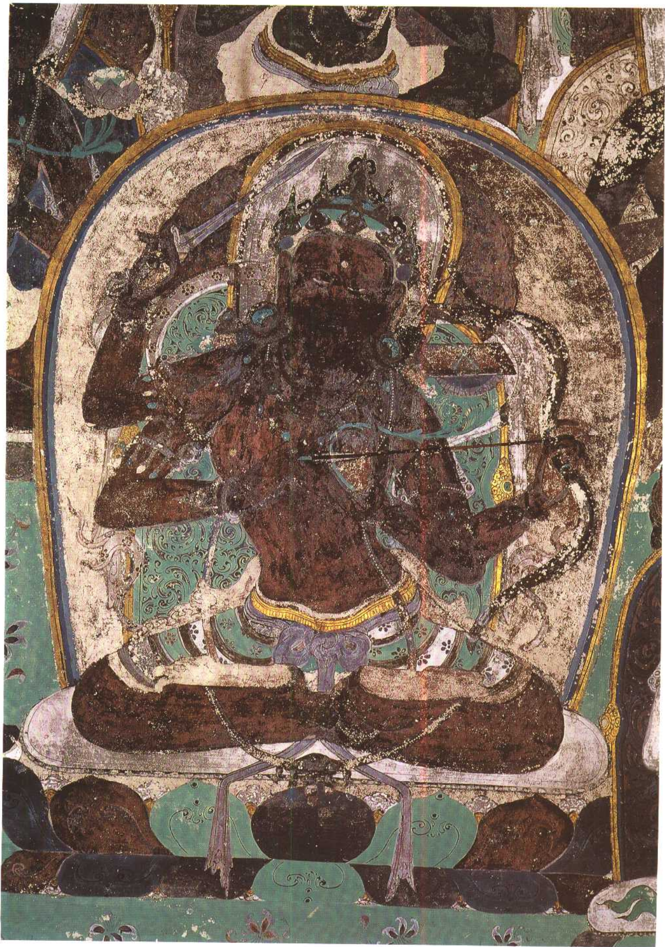
第四六五窟 南披 文殊菩萨