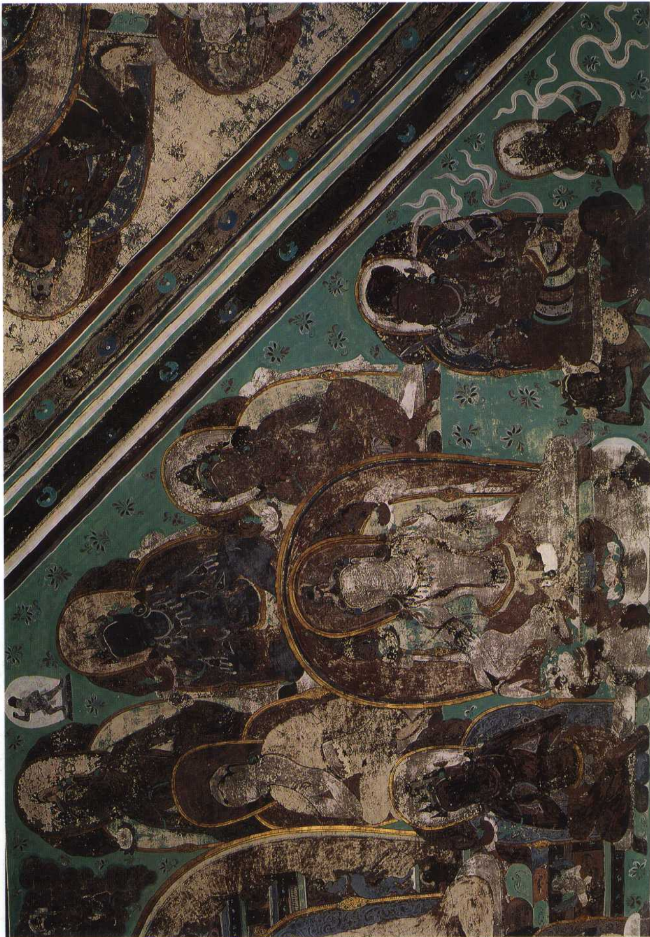
第四六窟 南披 佛、菩萨众