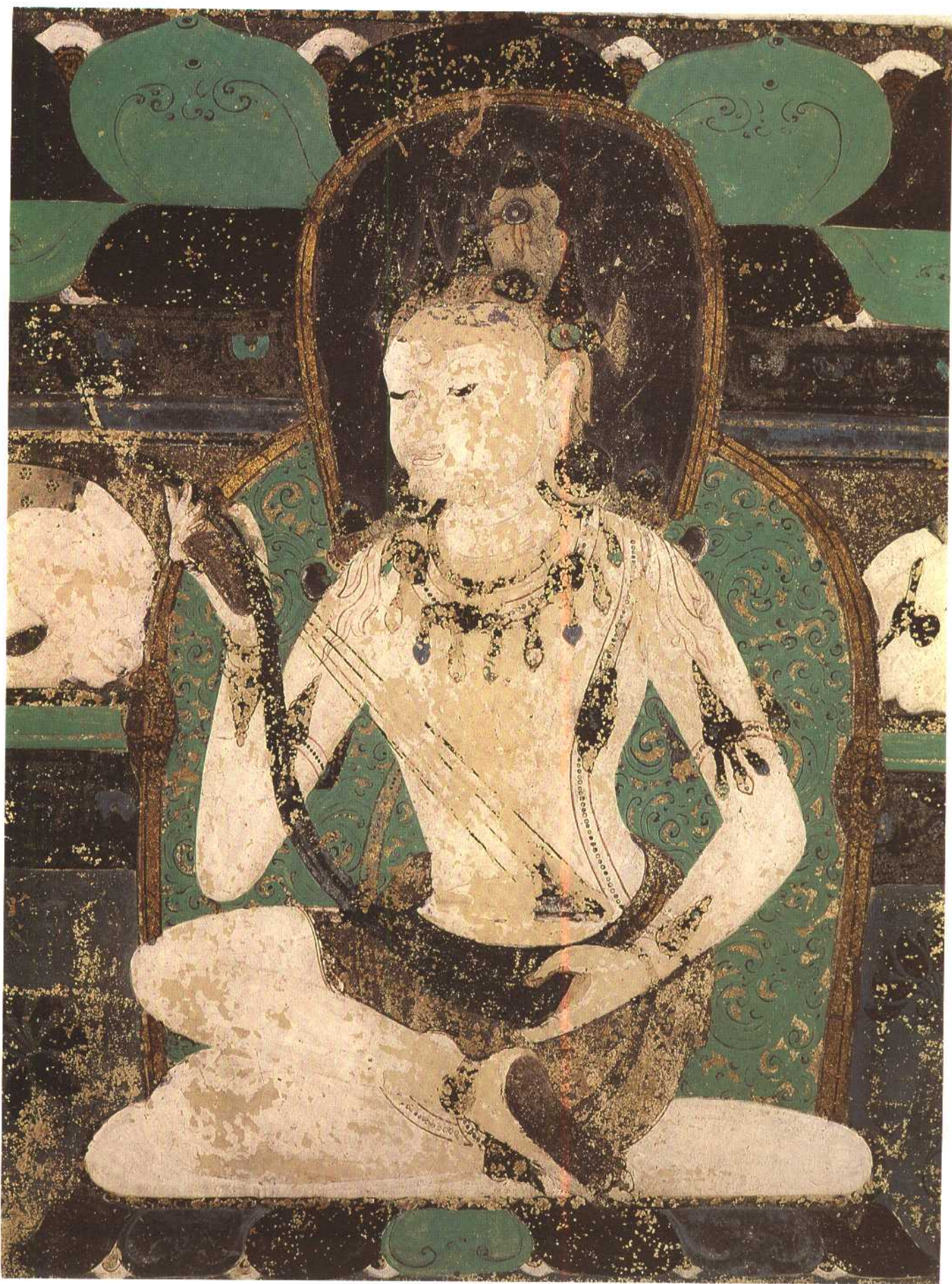
4 第四六五窟 东披 供养菩萨