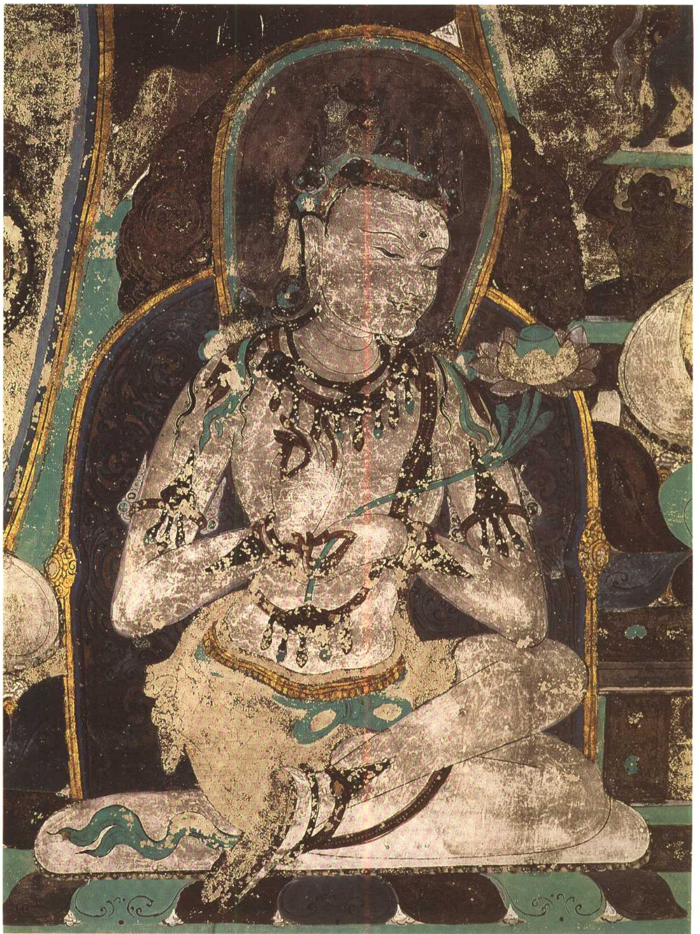
第四六五窟 南披 供养菩萨