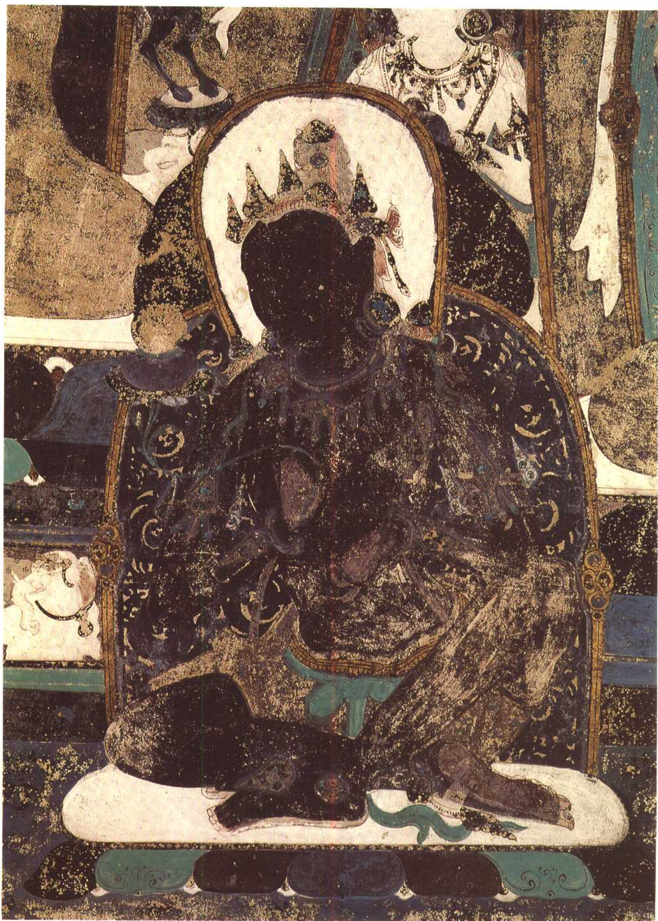
第四六五窟 东披 供养菩萨