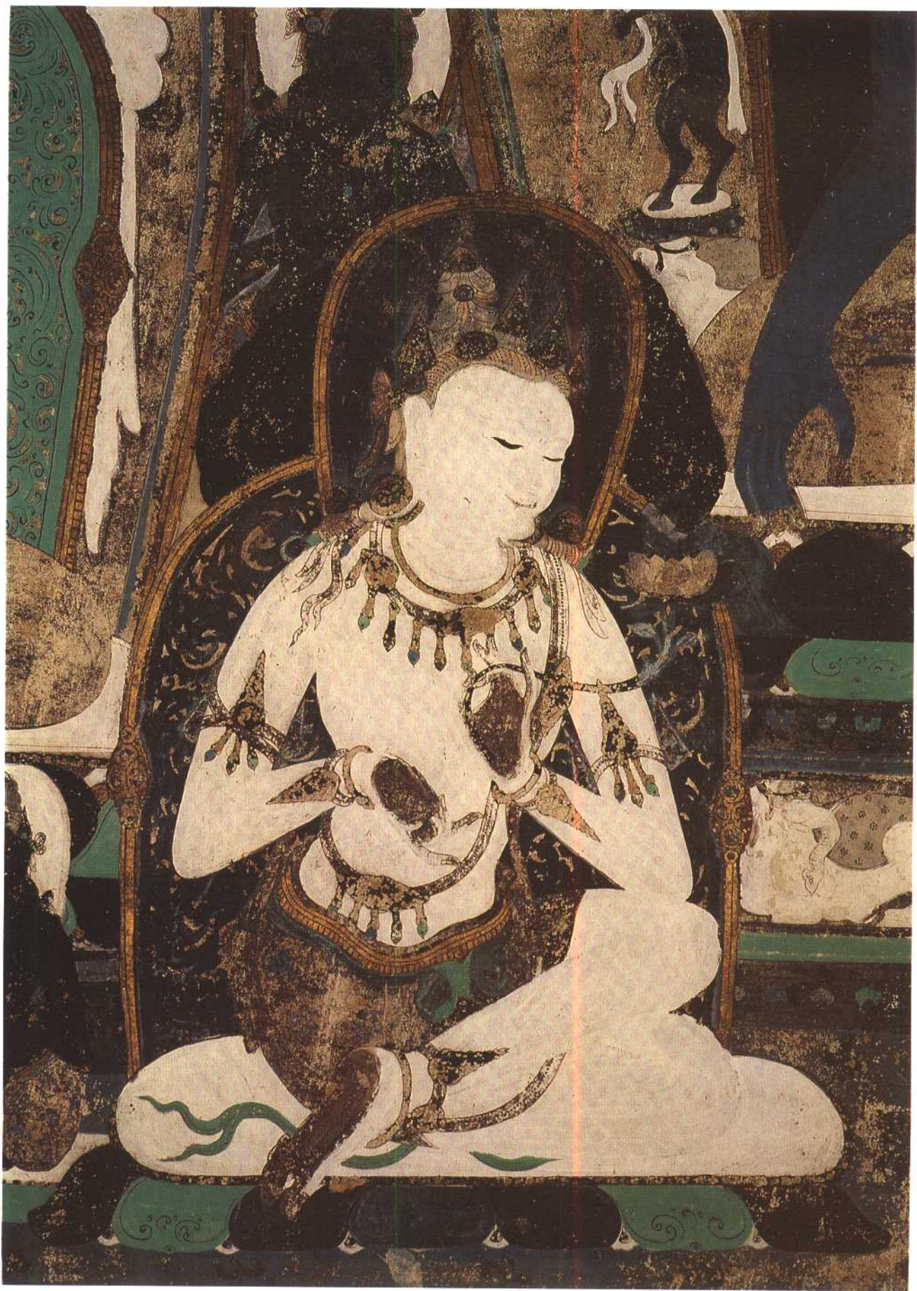
第四六五窟 东披 供养菩萨