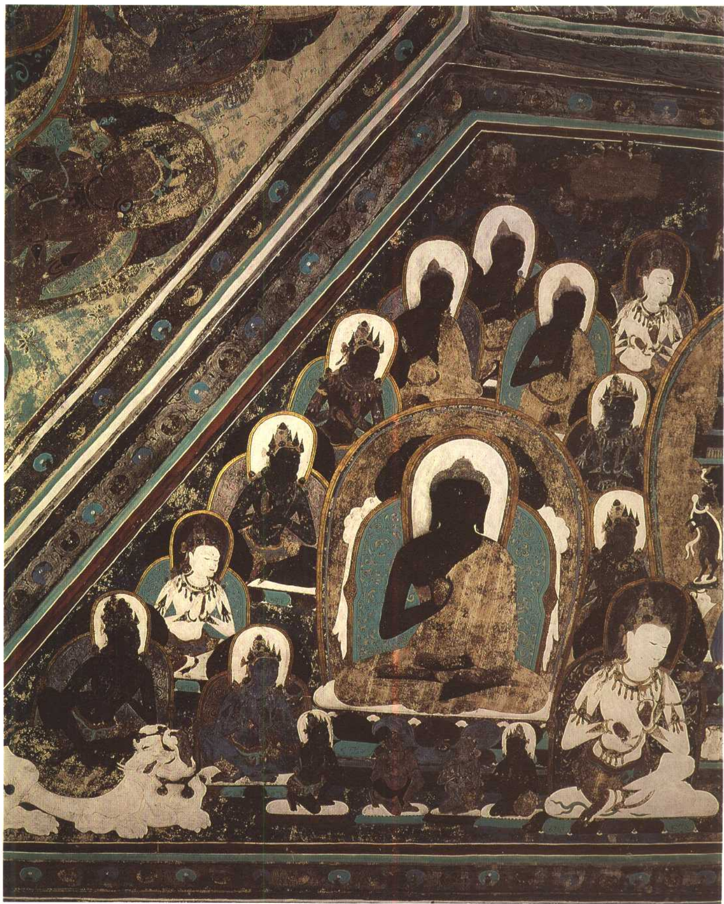
第四六五窟 东披 佛、菩萨