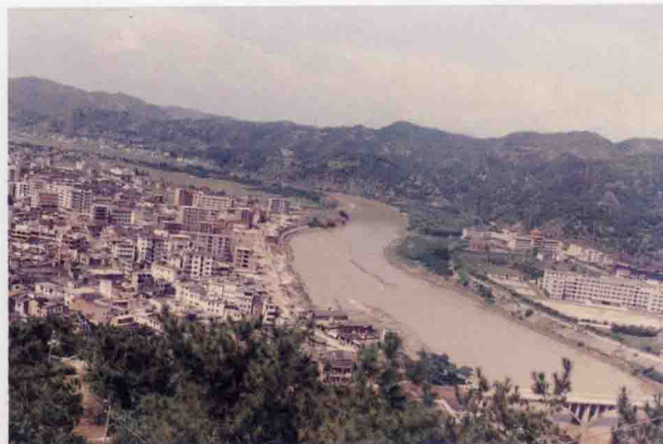
现年代的湖寮新村