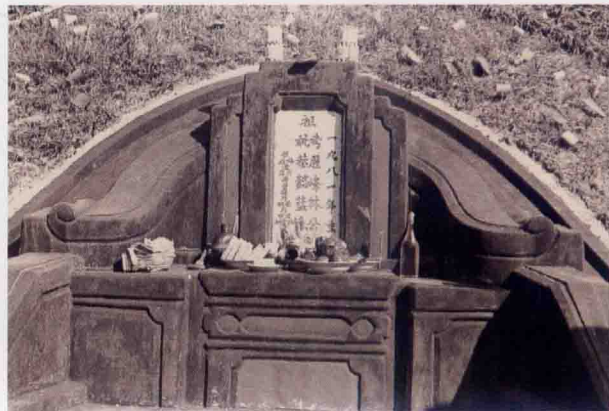
常华公 常华婆之墓