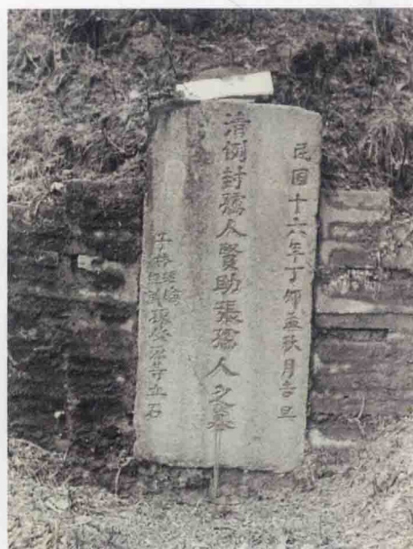
梅坡婆墓碑(攝于湖寮坳背的一面山上)