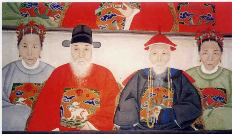
常华公 梅坡公兄弟画像