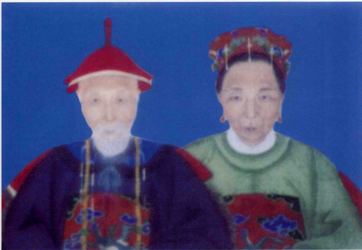
梅坡公 梅坡婆画像