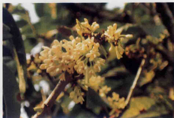
花开繁盛，飘香迷人