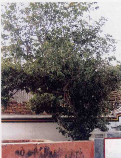
桂花树全景（鲤缸背）