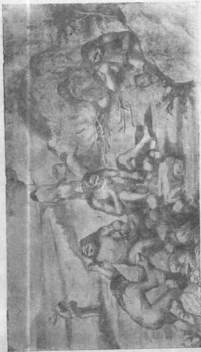
图版 III 北京猿人的生活