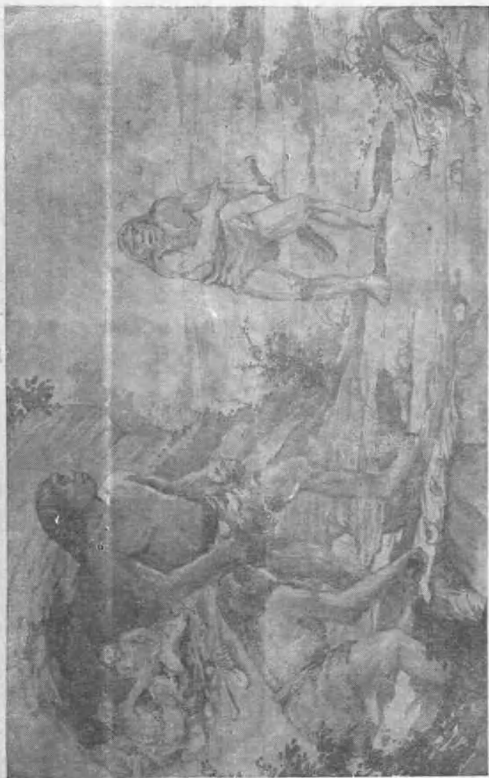
图版 IV 尼安德特人的生活