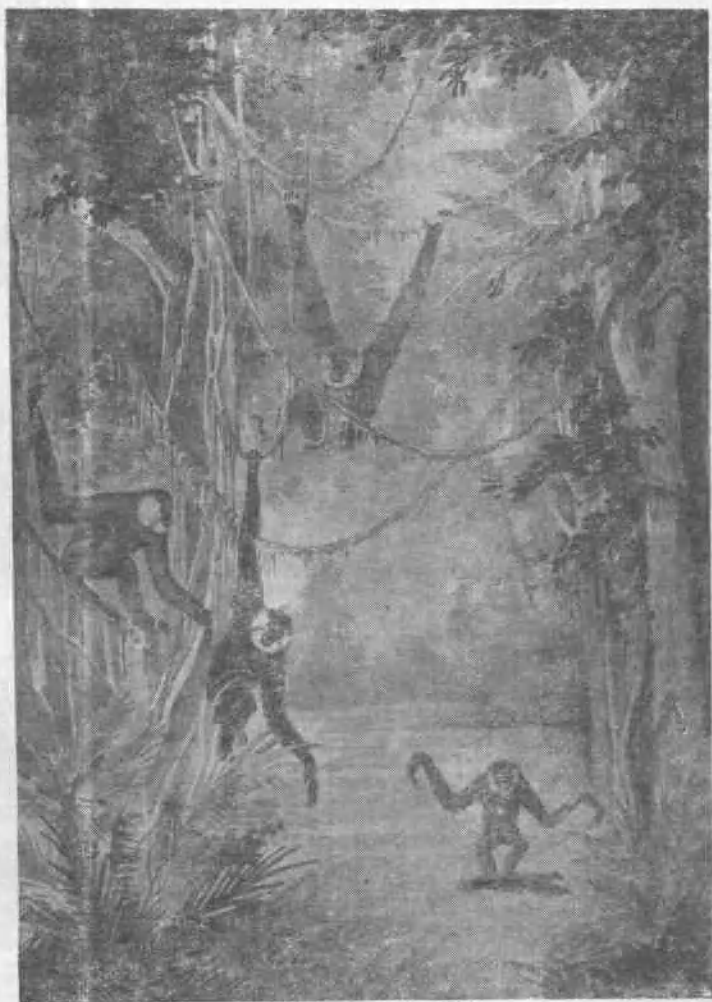
图版 I 长臂猿群的生活