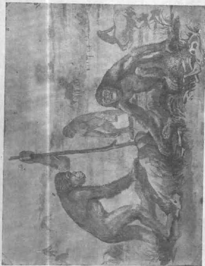
图版 II 南方古猿的生活