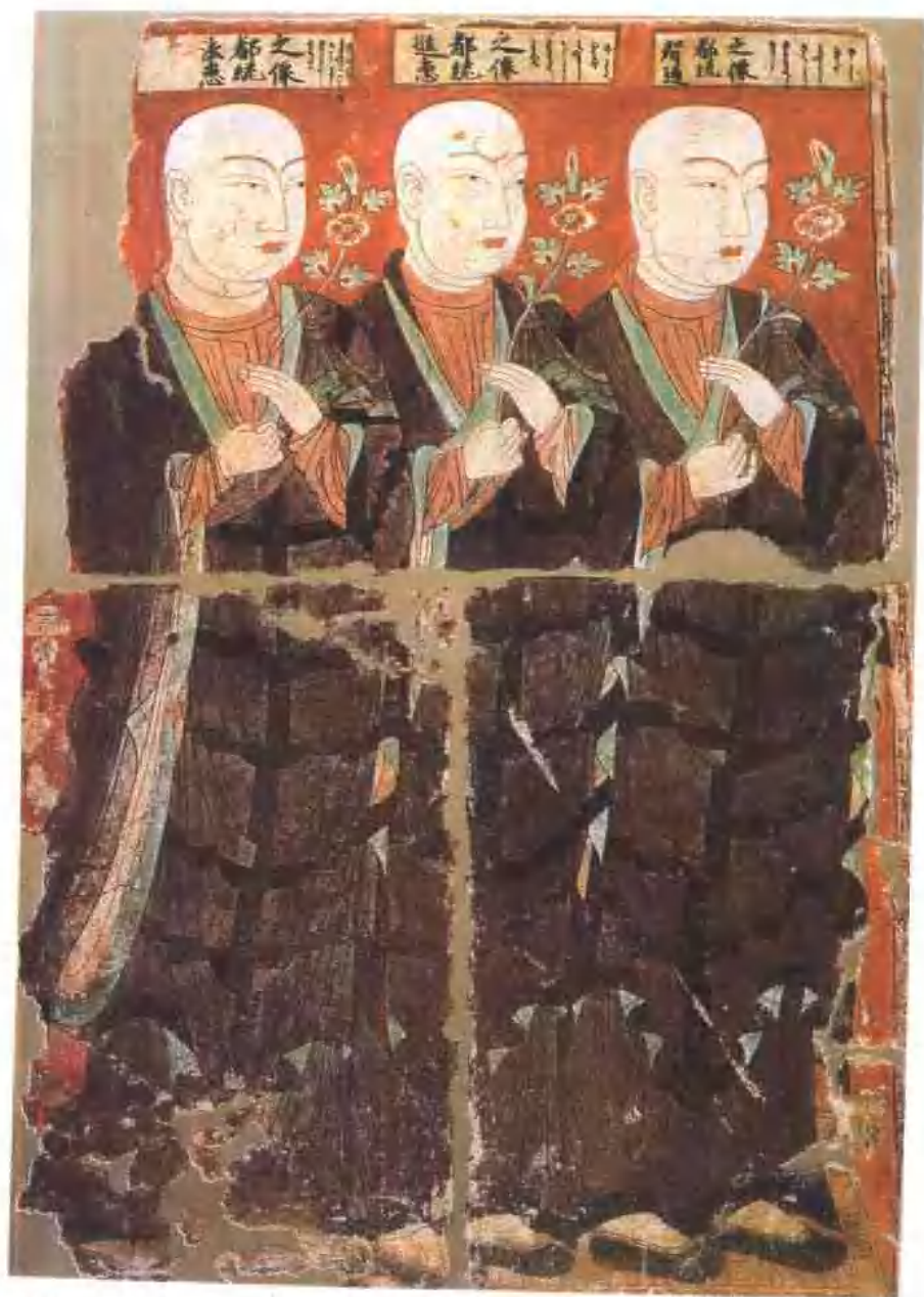
僧都統像 伯孜克里克第三二窟 聯邦德國西柏林印度藝術博物館藏