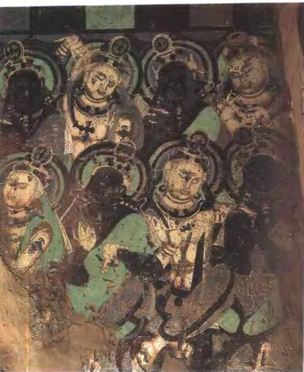
聽法菩薩像(局部) 克孜爾第二七窟