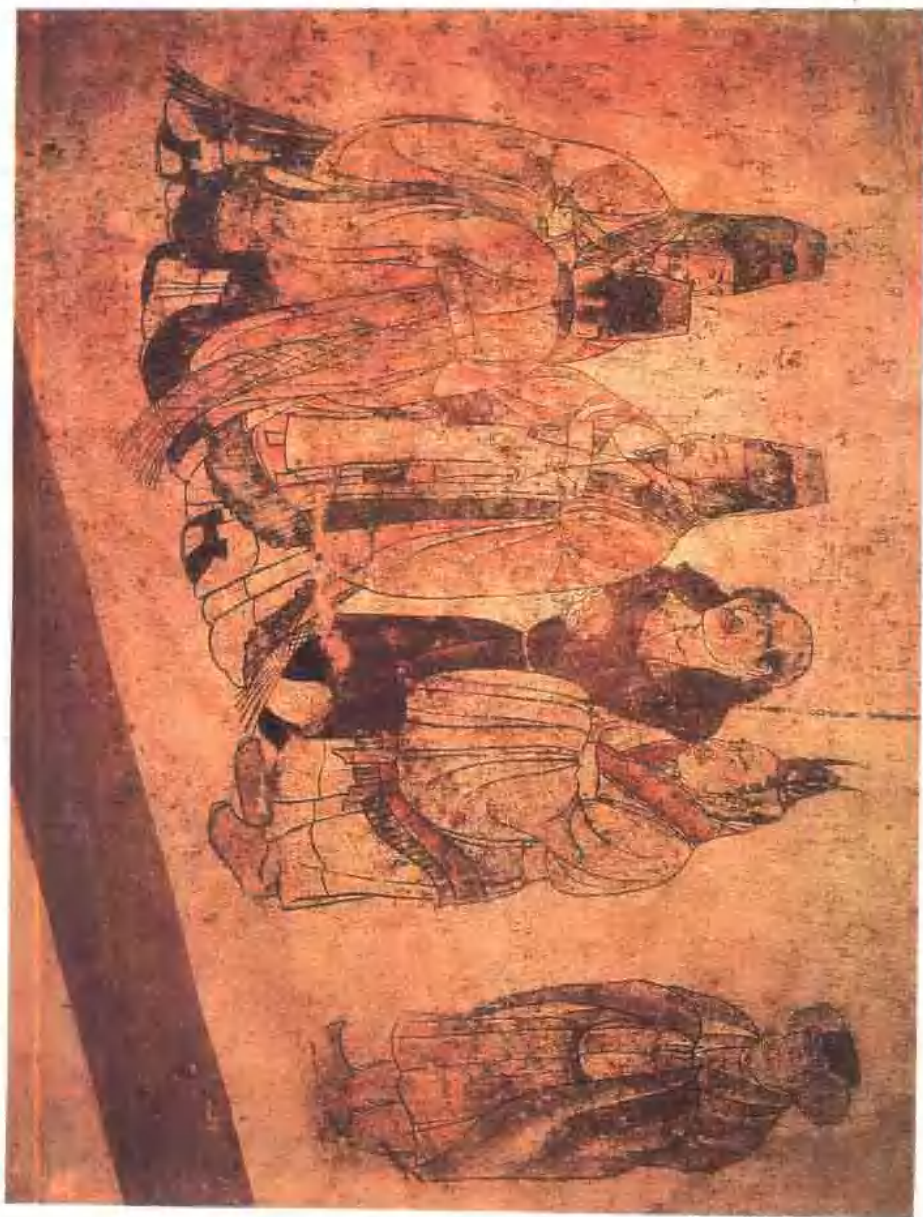
禮賓 唐·貞雲二年 陝西省乾縣乾陵陪葬墓章懷太子墓