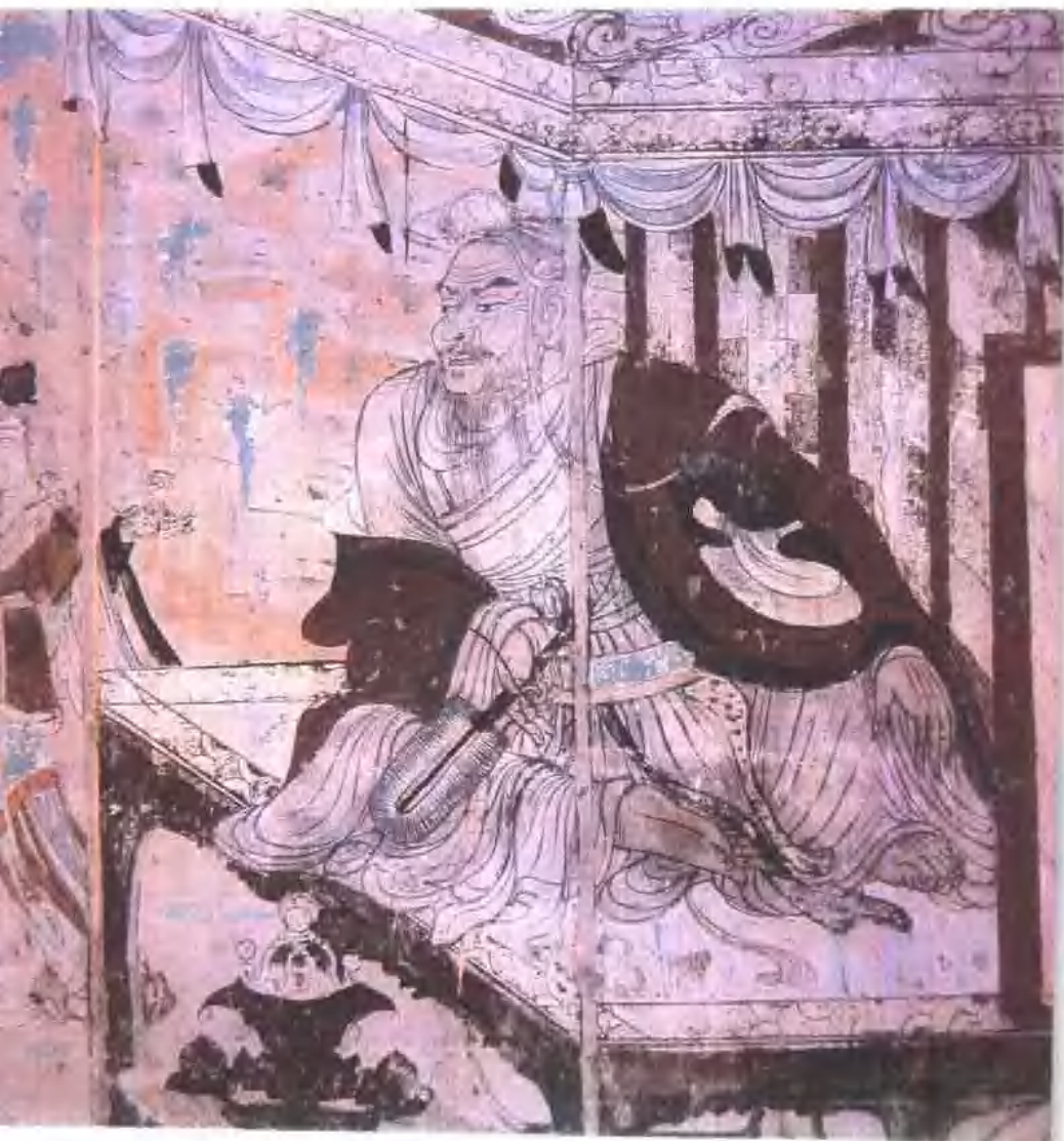
維摩詰經變·維摩詰 盛唐 敦煌一〇三窟