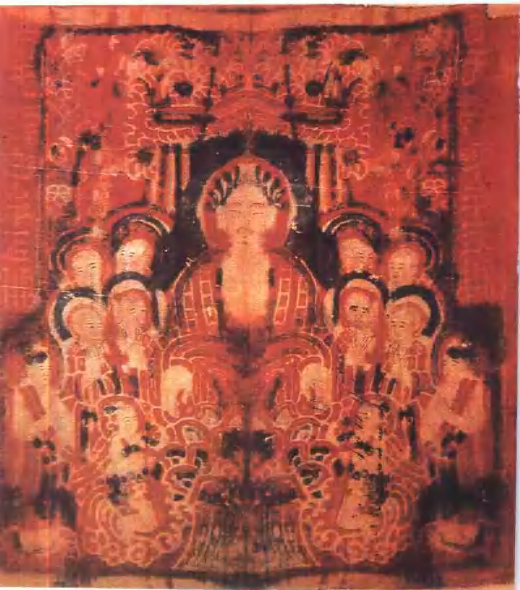
南無釋迦牟尼佛像 遼 山西省雁北地區文物管理委員會藏