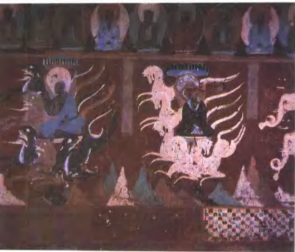
須摩提女緣品(局部) 北魏 敦煌二五七窟