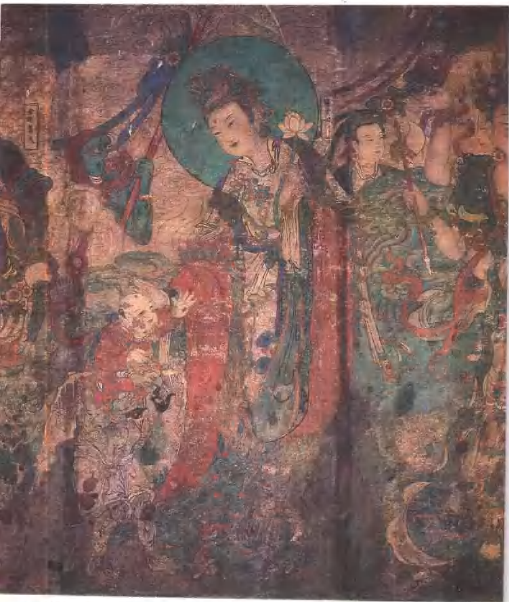
鬼子母 明 河北省正定縣隆興寺摩尼殿