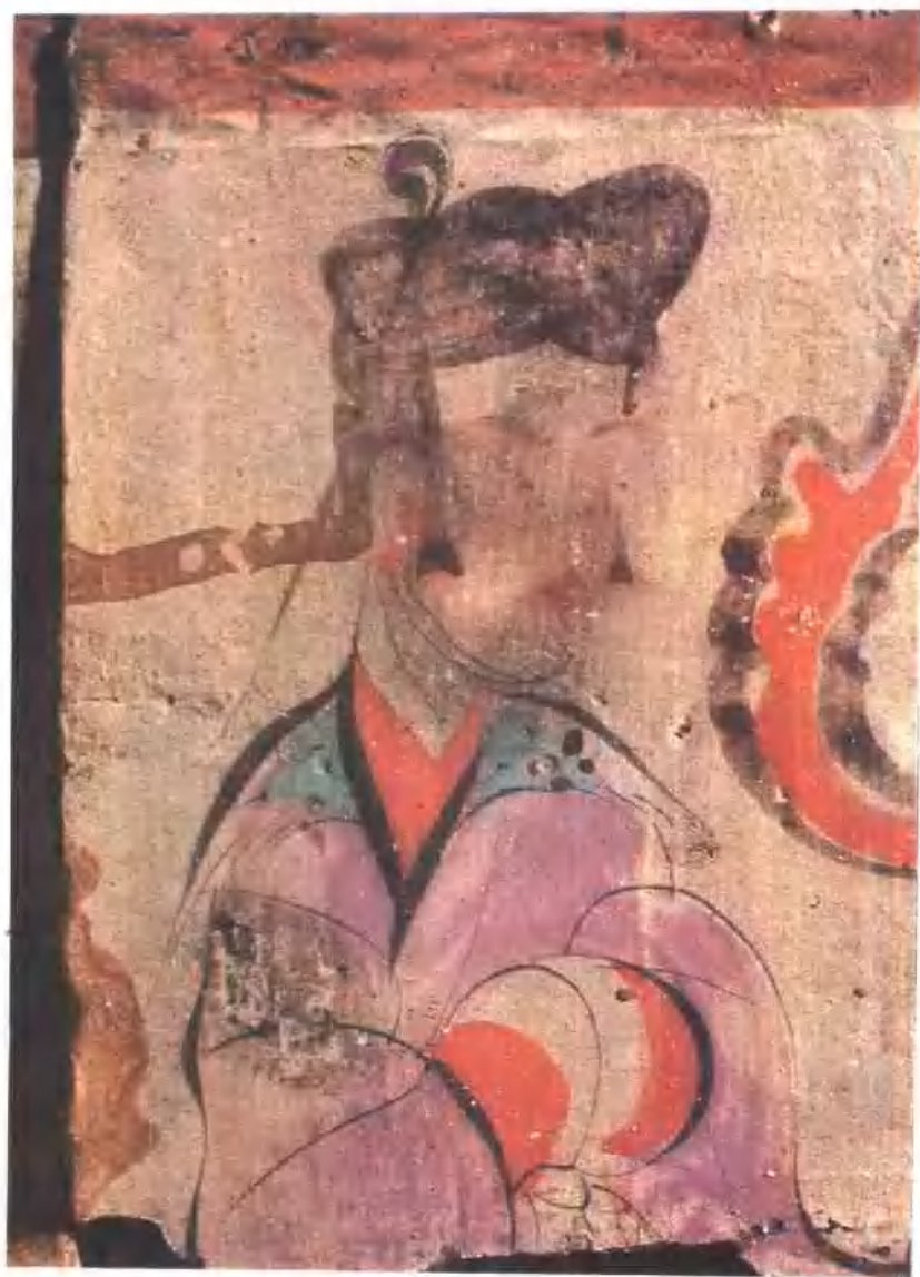
女媧 西漢·昭宣 河南省洛陽市卜千秋墓