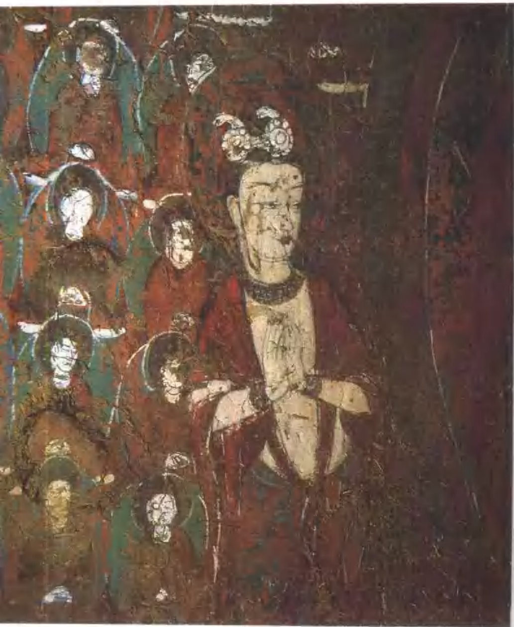
菩薩 北魏 馬蹄寺石窟千佛洞八窟