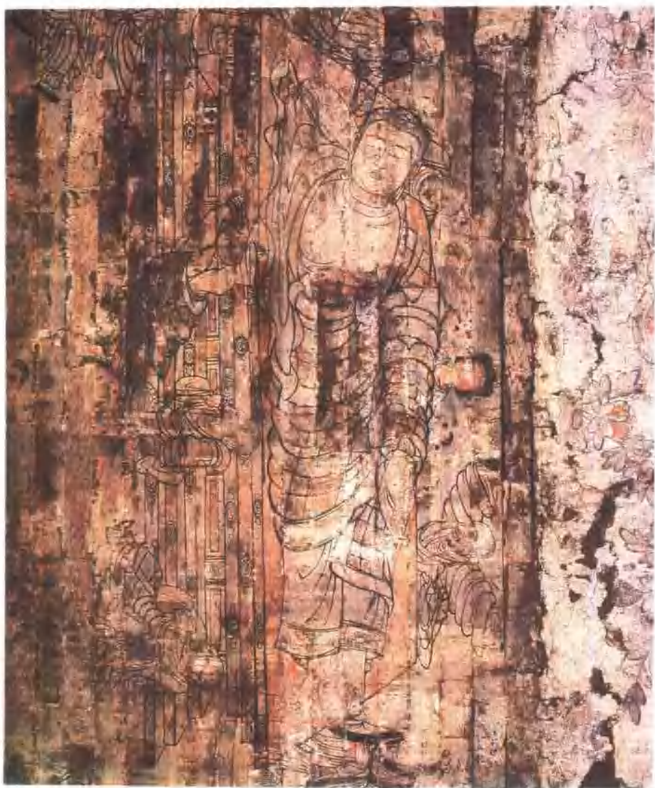
涅槃變 宋 河北省定州市淨眾院塔基地宮