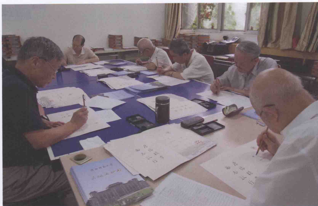
2013年7月，学校用毛笔手写的录取通知书走红网络，被誉为“最值得珍藏”的大学录取通知书。图为我校部分退休教师正在书写录取通知书。