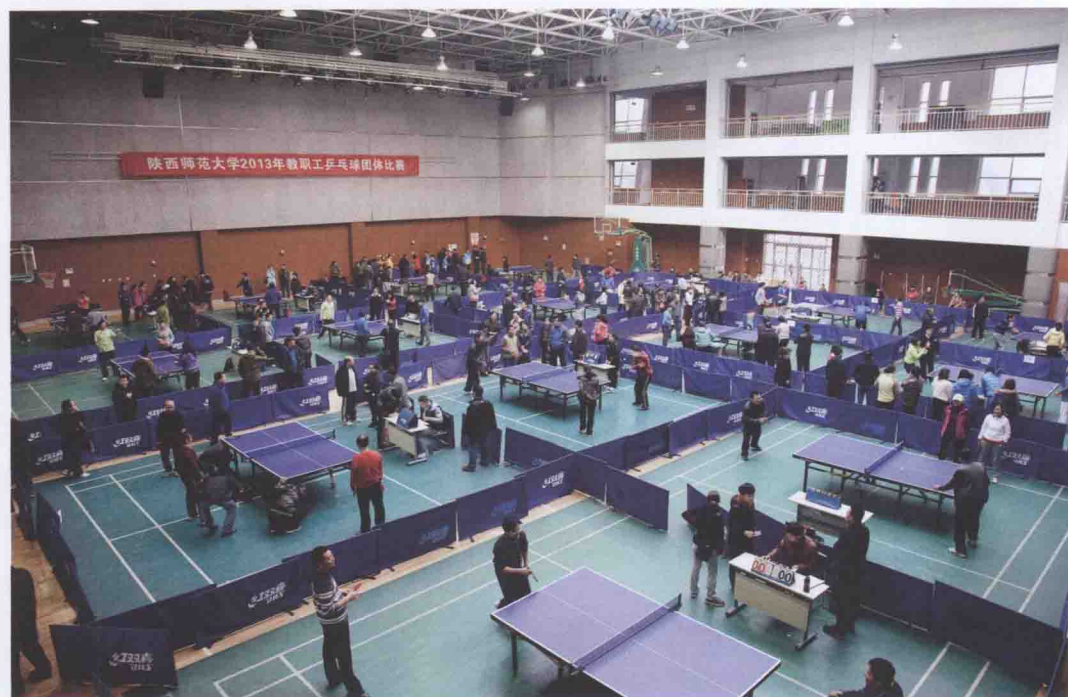
2013年12月9日，我校举行教职工乒乓球团体比赛。