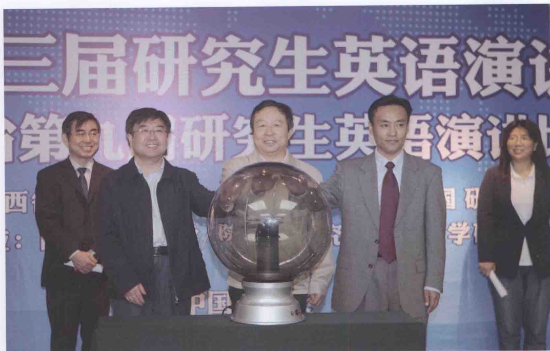
2013年5月9日至10日，西北地区第三届研究生英语演讲邀请赛暨陕西省第九届研究生英语演讲比赛在我校举行，陕西省教育厅副厅长郭立宏（左二）、我校党委书记甘晖（中）、《中国研究生》编辑部副主任关长空（右二）共同启动大赛按钮。