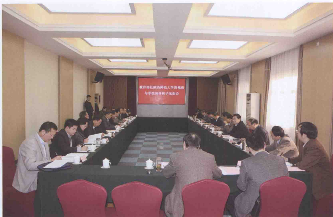
2013年4月11日，教育部巡视组来我校开展为期四周的巡视工作，图为教育部巡视组召开与学校领导班子见面会。