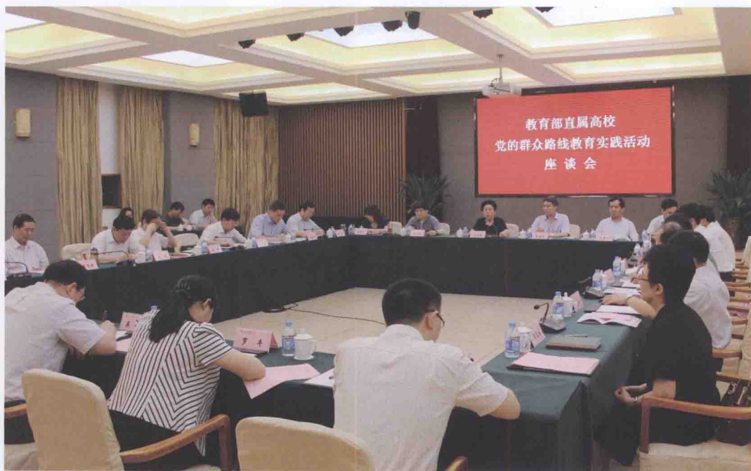
2013年7月18日,由教育部党组成员、中纪委驻教育部纪检组组长王立英带领的教育部督导组莅临我校,对包括我校在内的14所教育部直属高校党的群众路线教育实践活动的开展进行督查和指导。图为教育部直属高校党的群众路线教育实践活动座谈会现场。