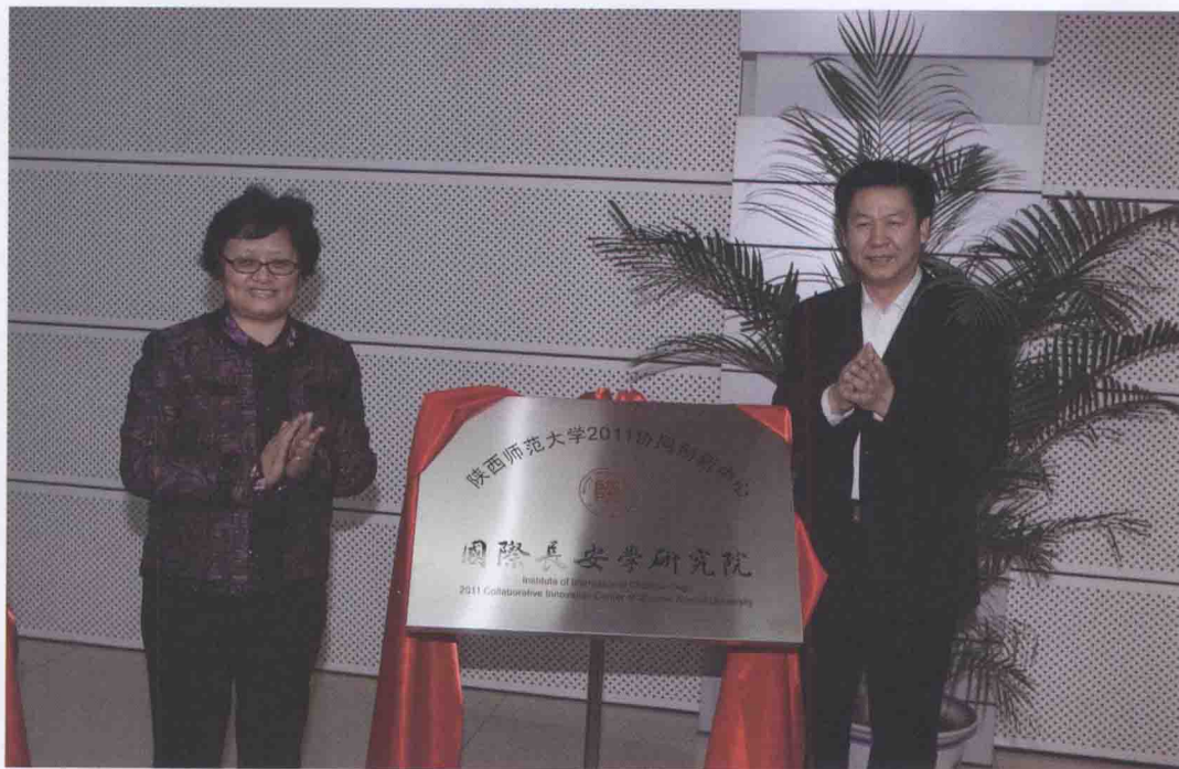
2013年3月29日,陕西师范大学进一步繁荣发展哲学社会科学工作会议召开。会上,教育部副部长李卫红(左)、陕西省副省长庄长兴(右)为陕西师范大学国际长安学研究院揭牌。