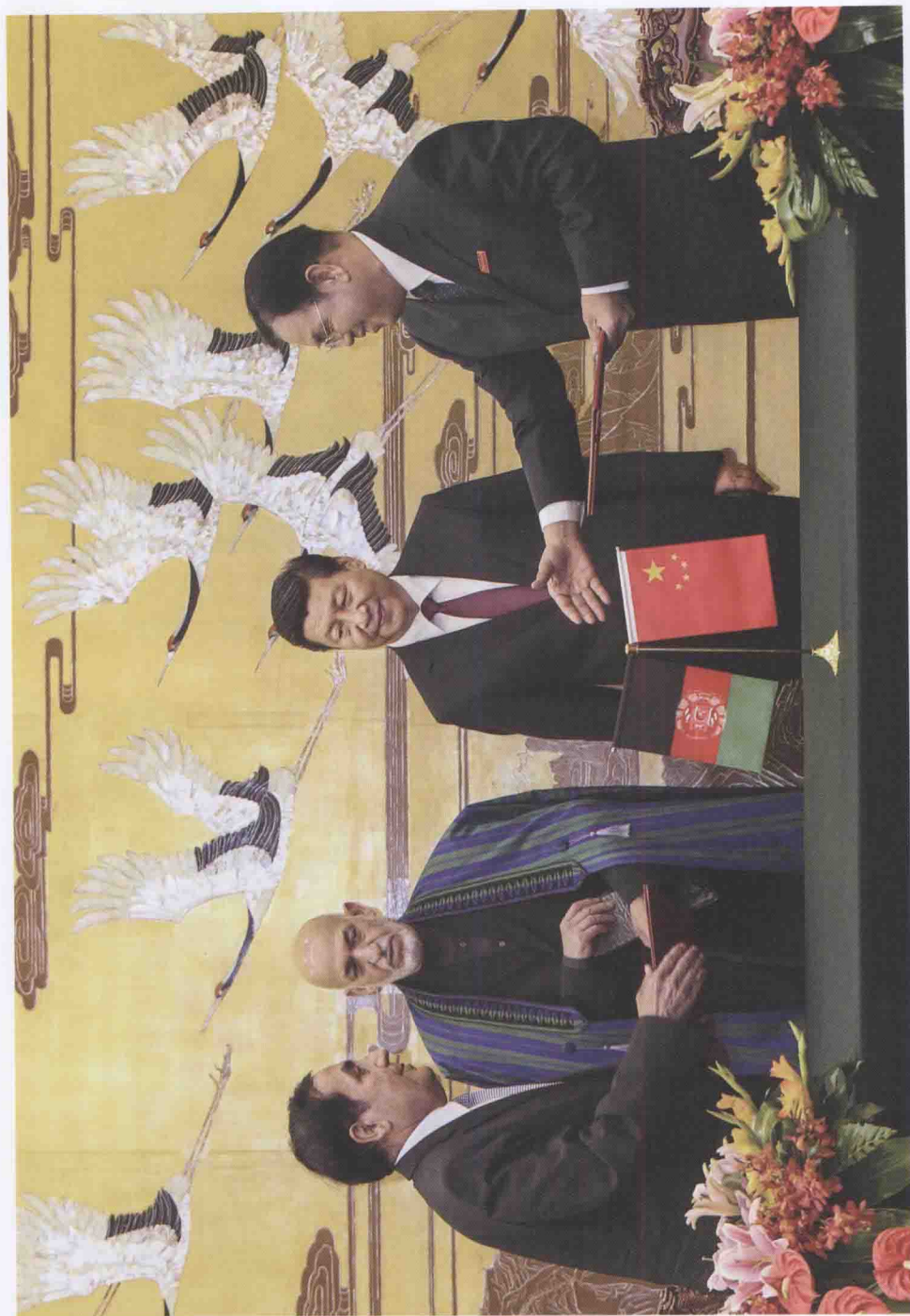
2013年9月27日，在中华人民共和国主席习近平和阿富汗总统卡尔扎伊的见证下，我校房喻校长在北京人民大会堂与阿富汗驻华大使穆罕默德·卡比尔·法拉希先生签署了《中国陕西师范大学与阿富汗喀布尔大学交流合作谅解备忘录》。