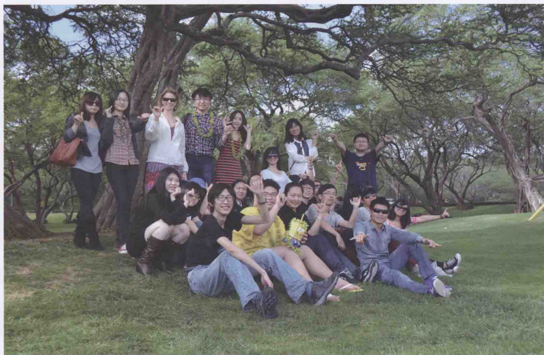
2013年3月，我校赴美国加州大学访学的学生在加州大学河滨分校合影。