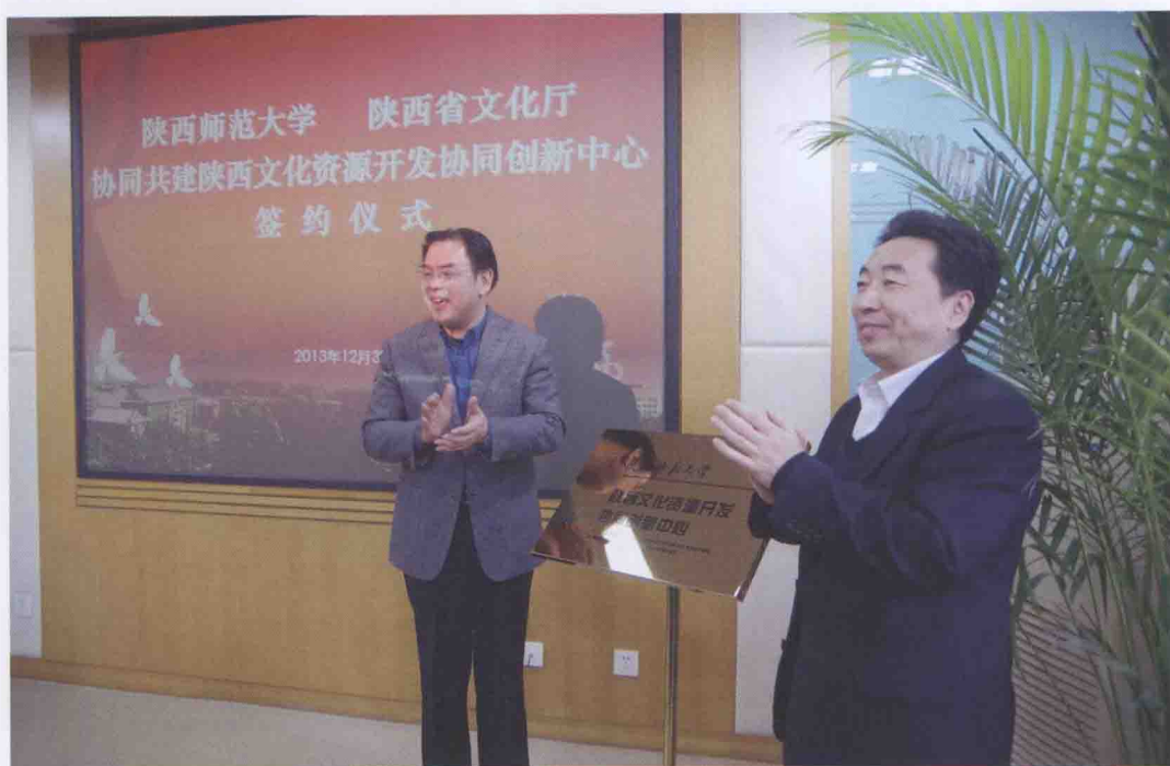
2013年12月30日，陕西师范大学、陕西省文化厅协同共建陕西文化资源开发协同创新中心签约仪式举行。图为陕西省文化厅厅长刘宽忍（右）与我校校长房喻（左）为中心揭牌。