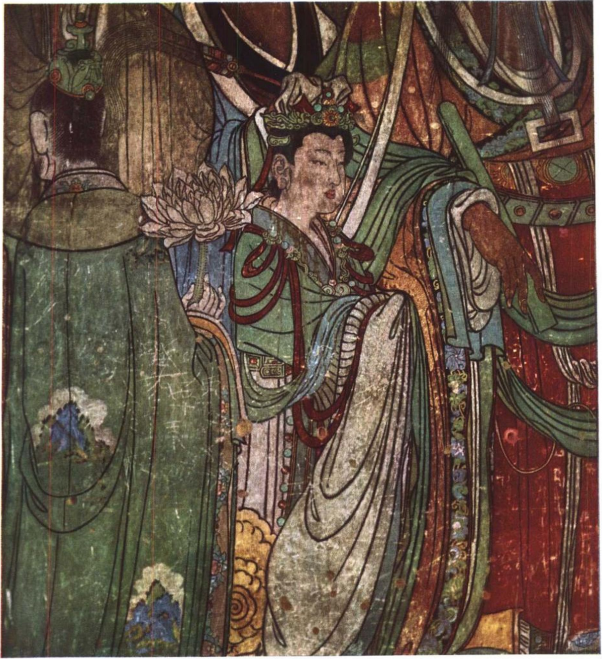
三清殿內槽西扇牆壁畫細部