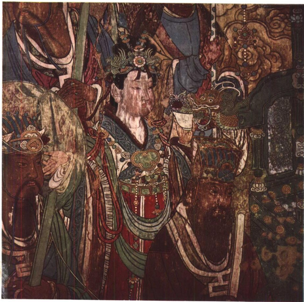
三清殿北壁西部壁画细部