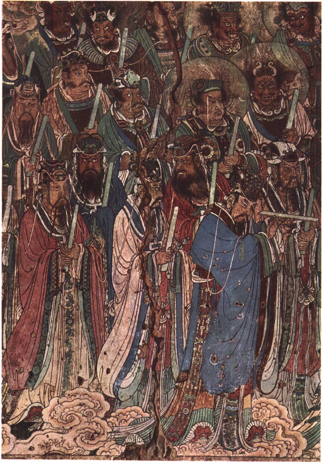
三清殿西壁壁画部分