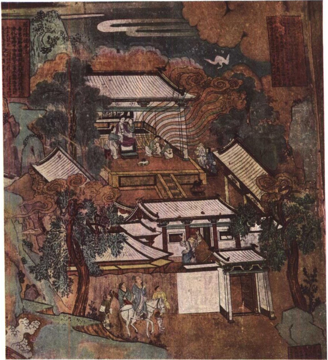
純陽殿東壁壁畫細部