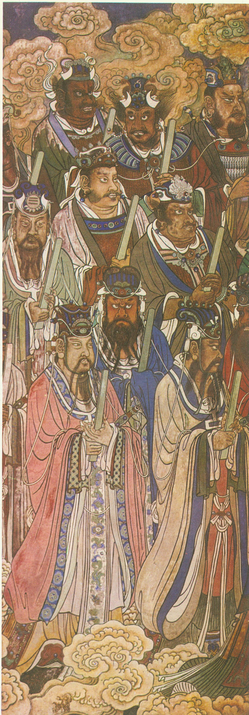
太乙及雷部诸神（三清殿西壁）