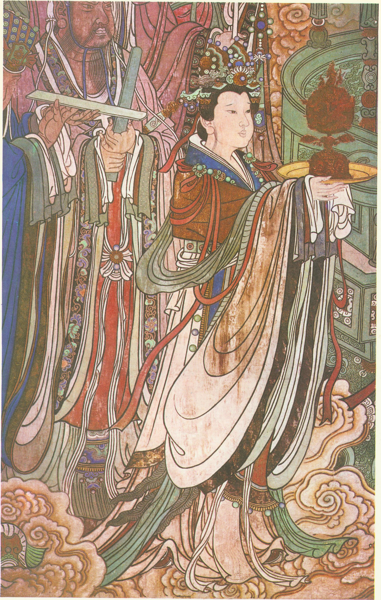
太乙、玉女（三清殿西壁）