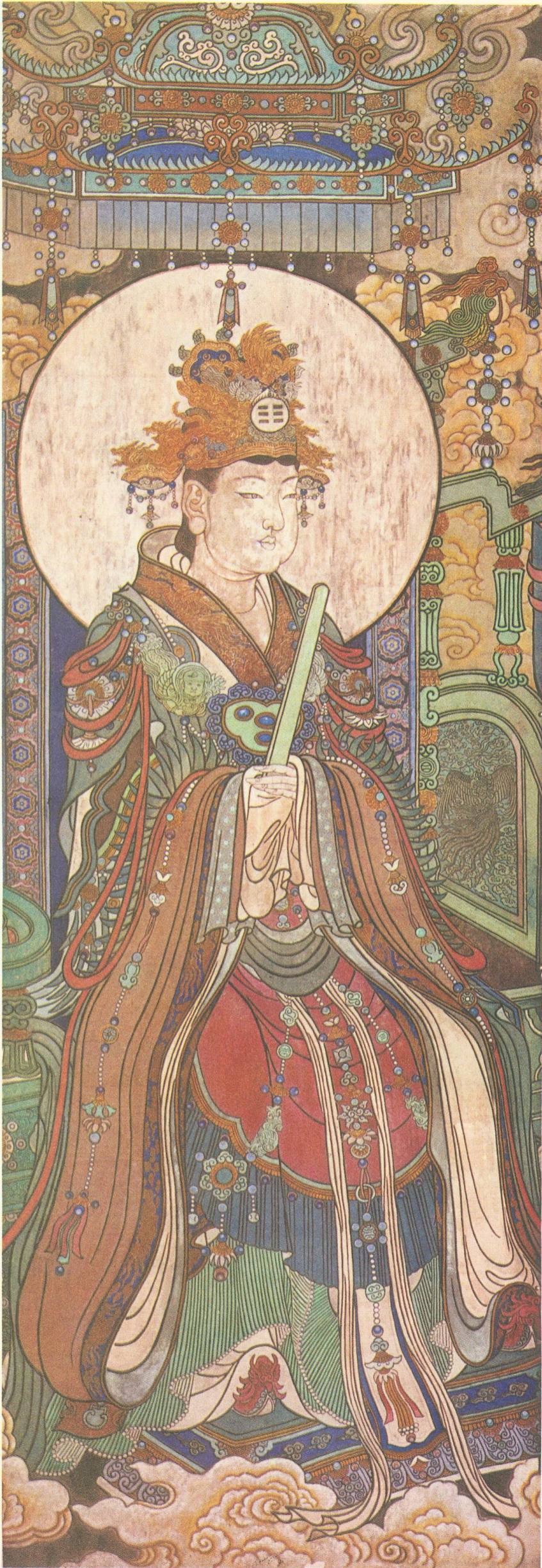
白玉龟台九灵太真金母元君 (三清殿西壁)