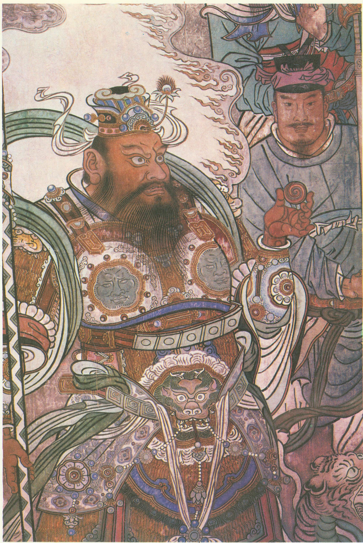
白虎星君（三清殿南壁西侧·局部）