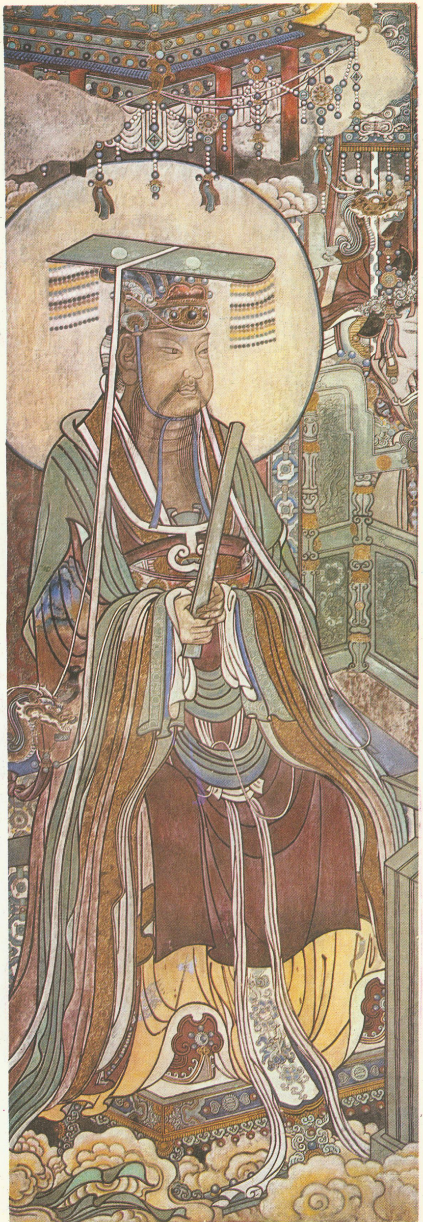
东华上相木公青童道君 (三清殿西壁)