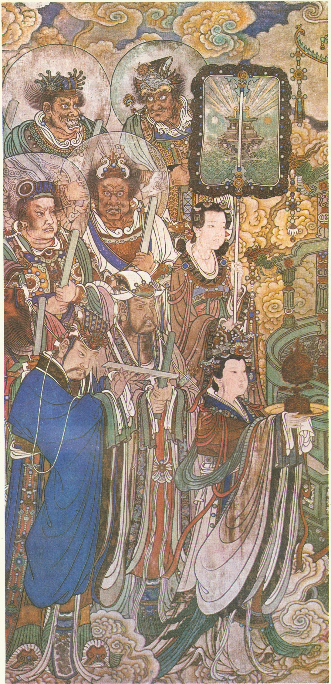
太乙、玉女及雷部诸神（三清殿西壁）