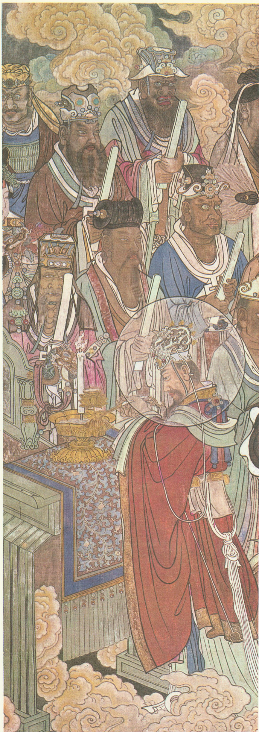
引进香官等诸神 (三清殿西壁)