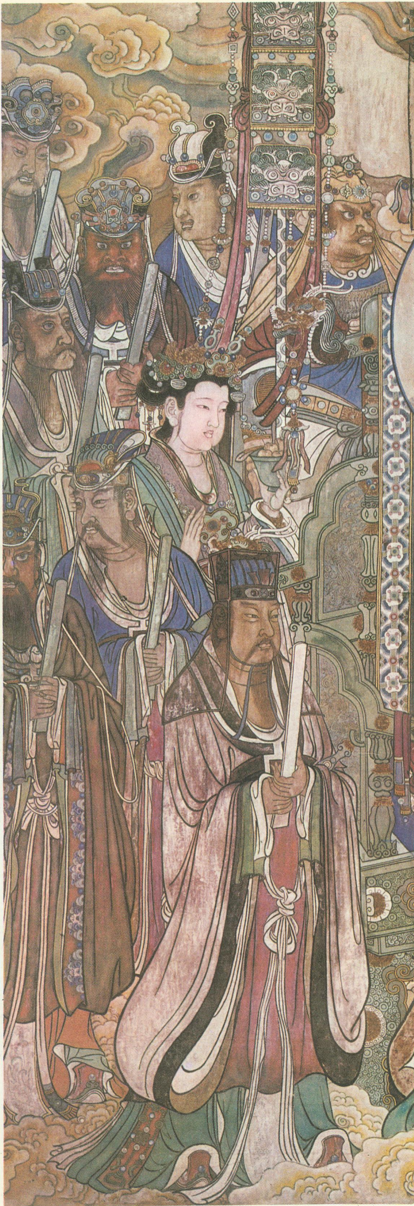
仙曹、玉女及太乙（三清殿西壁）