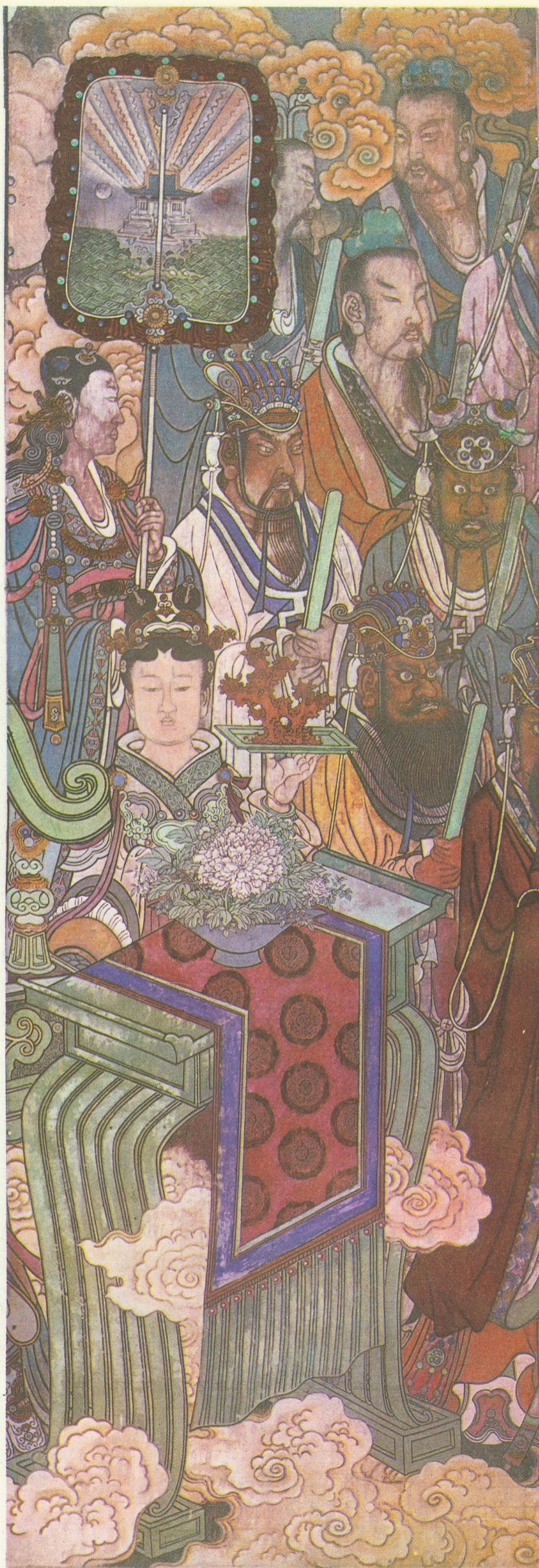
太乙及金母元君侍从 (三清殿西壁)