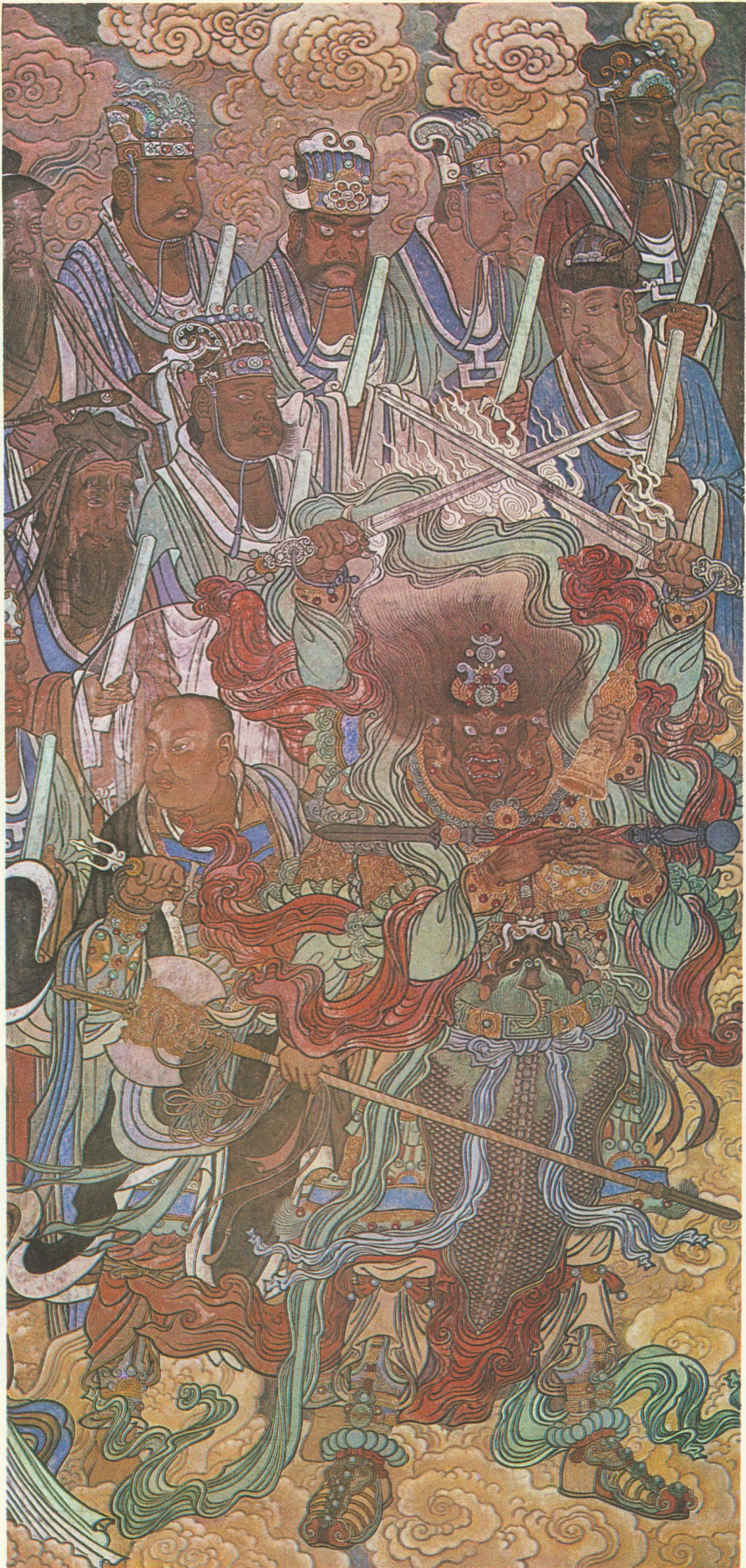
天猷副元帅及佑圣真武（三清殿西壁）