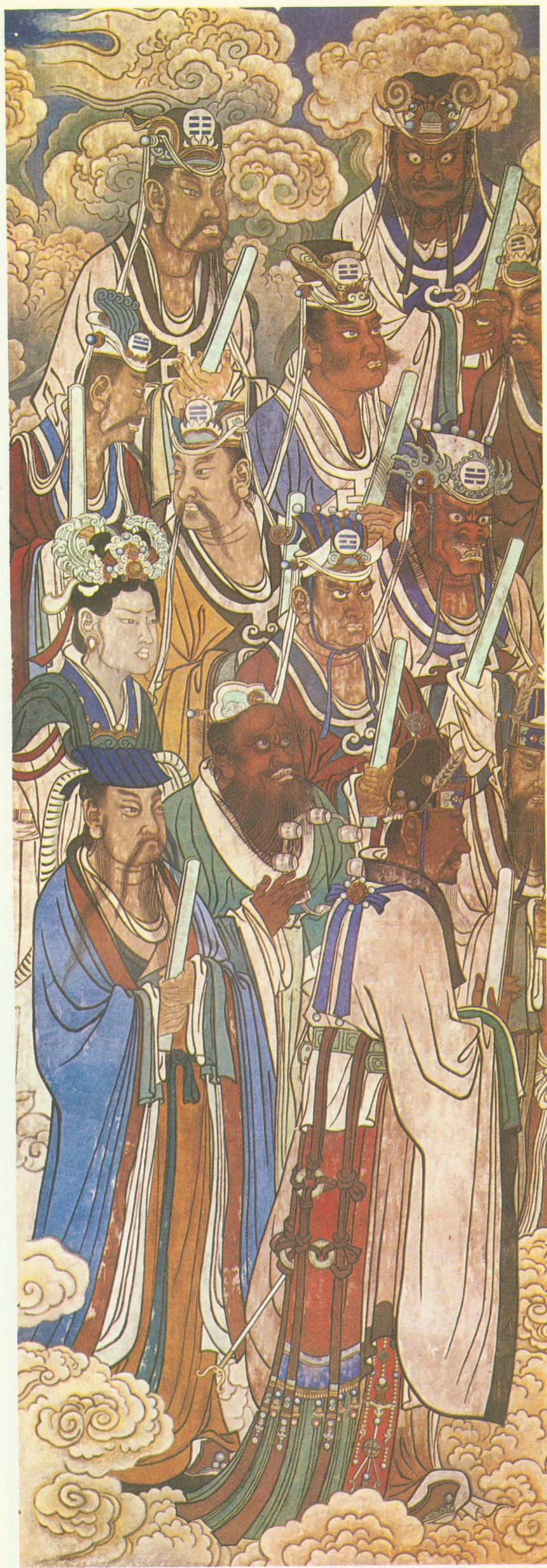
雷公、电母、雨及八卦诸神 (三清殿西壁)