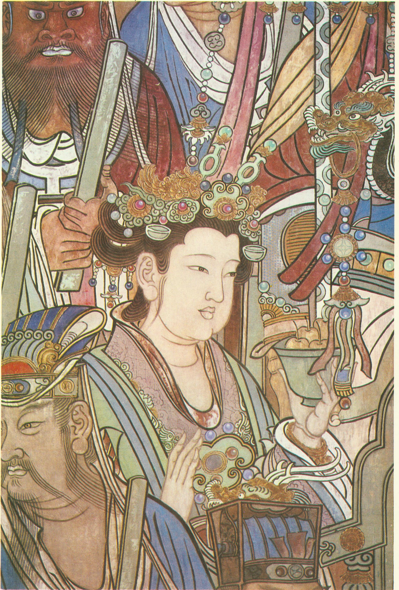
托果碗玉女（三清殿西壁·局部）