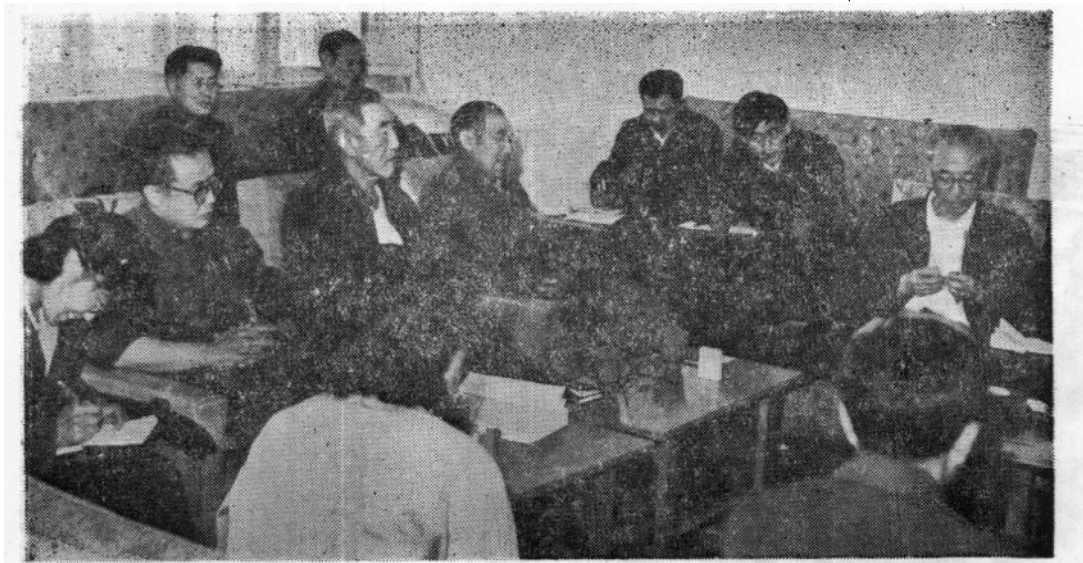
《巴林左旗志》审稿会议会场