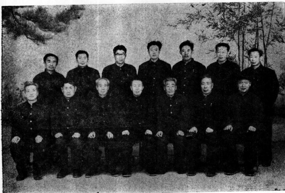
《巴林左旗志》初次审稿会议全体成员