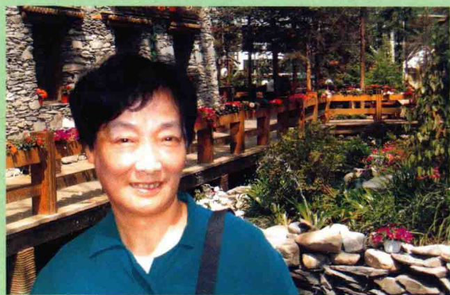
◆九寨沟（天堂饭店） 二〇〇四年