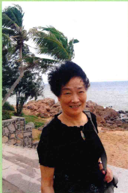
◆ 黄山二〇〇五年七月十日 我七十周岁生日