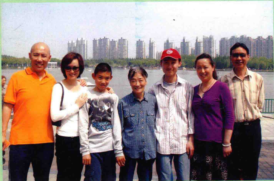
◆合家欢。摄于二〇〇八年五一节，上海世纪公园