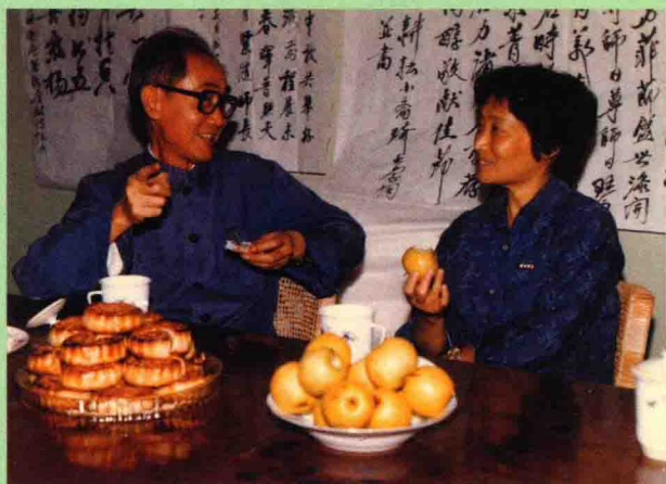
◆相濡以沫。摄于一九八七年湖州市“九三”学社的茶话会上