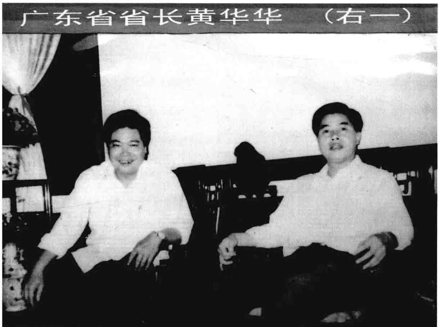
广东省省长黄华华 (右一)