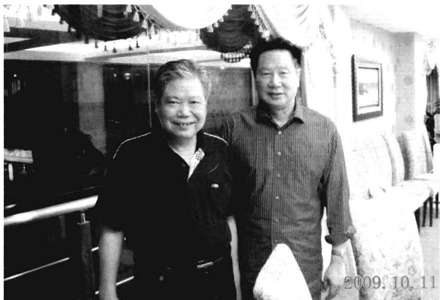
全国政协委员、中国汽车工业部蔡诗晴部长（右一）