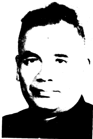
中共右江特委书记、右江苏维埃政府主席 雷经天