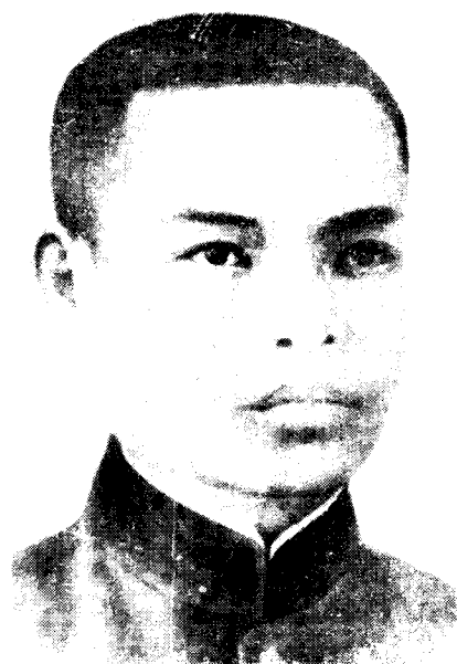
红七军总指挥 李明瑞