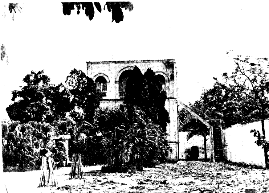
红八军司令部旧址