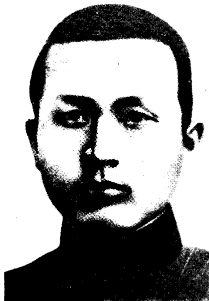
红七军、红八军总指挥 李明瑞