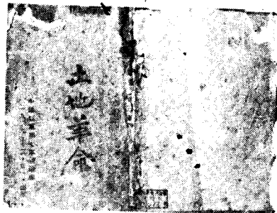
红七军政治部编印的 《土地革命》小册子