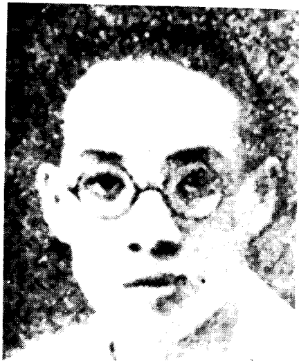
红七军政治部主任 陈豪人