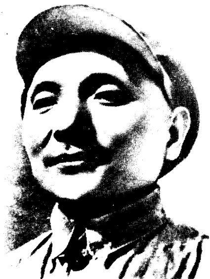
中共红七军前敌委员会书记、红七军、红八军政治委员 邓小平