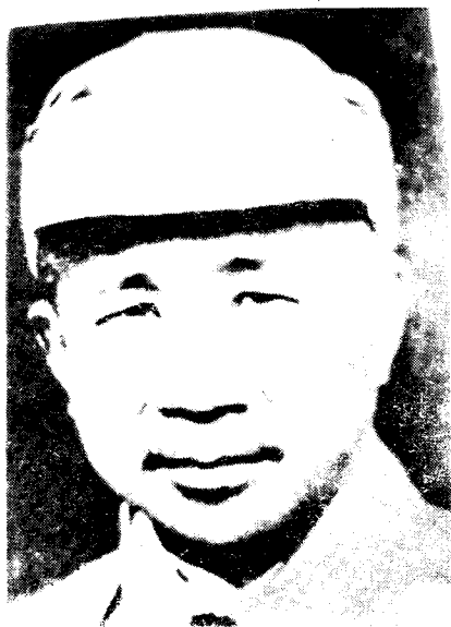
红七军总指挥 李明瑞