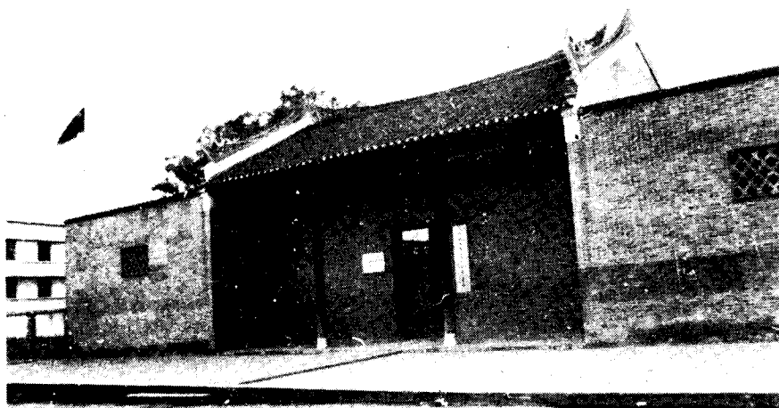
右江苏维埃政府旧址