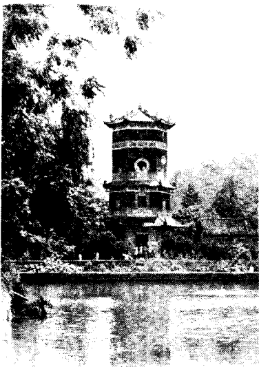
东兰县武篆魁星楼——中共红七军前委曾设在这里。邓小平曾在这里办公和居住

中國紅軍第七軍司令部政治部通告 為佈告事：前由本司令部政治部分令各分區，以經濟文化宣傳，對於革命，至為重要。凡我革命同志，不可不為。當此革命成功在即，尤宜注意。茲將本司令部政治部通告，分列於左，希各同志，遵照辦理。此佈。 一、土地革命：土地革命，是革命成功之基礎。凡我革命同志，不可不為。當此革命成功在即，尤宜注意。茲將本司令部政治部通告，分列於左，希各同志，遵照辦理。此佈。 二、土地革命：土地革命，是革命成功之基礎。凡我革命同志，不可不為。當此革命成功在即，尤宜注意。茲將本司令部政治部通告，分列於左，希各同志，遵照辦理。此佈。 三、土地革命：土地革命，是革命成功之基礎。凡我革命同志，不可不為。當此革命成功在即，尤宜注意。茲將本司令部政治部通告，分列於左，希各同志，遵照辦理。此佈。 四、土地革命：土地革命，是革命成功之基礎。凡我革命同志，不可不為。當此革命成功在即，尤宜注意。茲將本司令部政治部通告，分列於左，希各同志，遵照辦理。此佈。 五、土地革命：土地革命，是革命成功之基礎。凡我革命同志，不可不為。當此革命成功在即，尤宜注意。茲將本司令部政治部通告，分列於左，希各同志，遵照辦理。此佈。 六、土地革命：土地革命，是革命成功之基礎。凡我革命同志，不可不為。當此革命成功在即，尤宜注意。茲將本司令部政治部通告，分列於左，希各同志，遵照辦理。此佈。 七、土地革命：土地革命，是革命成功之基礎。凡我革命同志，不可不為。當此革命成功在即，尤宜注意。茲將本司令部政治部通告，分列於左，希各同志，遵照辦理。此佈。 八、土地革命：土地革命，是革命成功之基礎。凡我革命同志，不可不為。當此革命成功在即，尤宜注意。茲將本司令部政治部通告，分列於左，希各同志，遵照辦理。此佈。 九、土地革命：土地革命，是革命成功之基礎。凡我革命同志，不可不為。當此革命成功在即，尤宜注意。茲將本司令部政治部通告，分列於左，希各同志，遵照辦理。此佈。 十、土地革命：土地革命，是革命成功之基礎。凡我革命同志，不可不為。當此革命成功在即，尤宜注意。茲將本司令部政治部通告，分列於左，希各同志，遵照辦理。此佈。