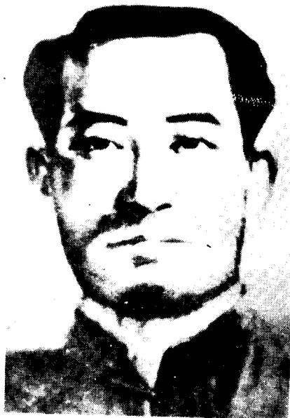
右江农民运动领袖、红七军廿一师师长 韦拔群