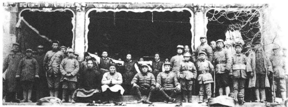
红四方面军与群众联欢。