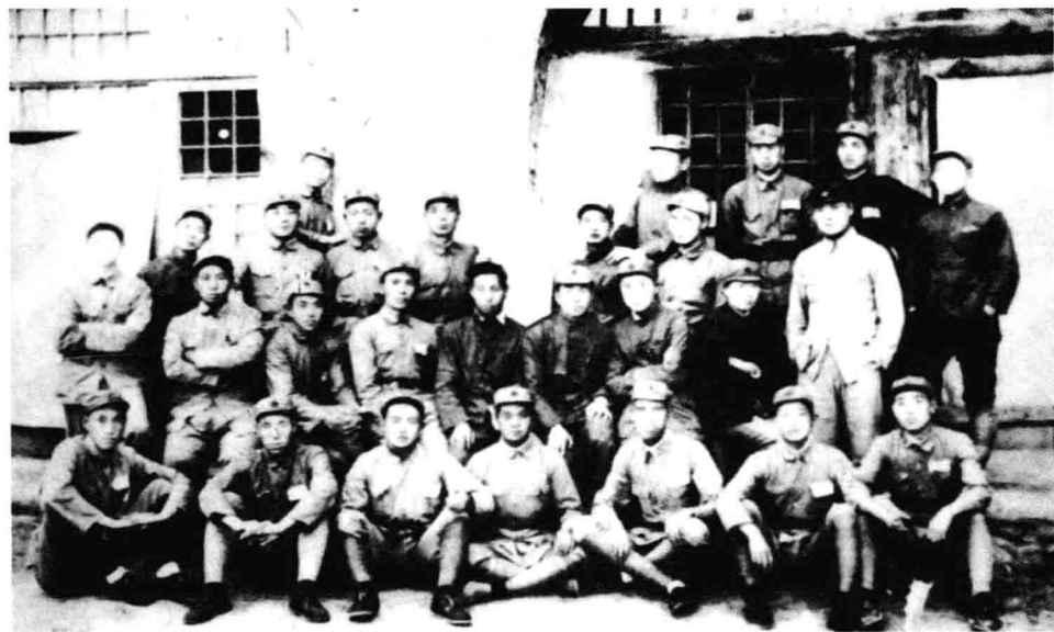
陕甘苏区红军一部。