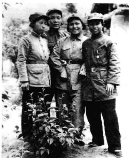
1936年，刘英（右1）与陈琮英、蔡畅、夏明长征到陕北。