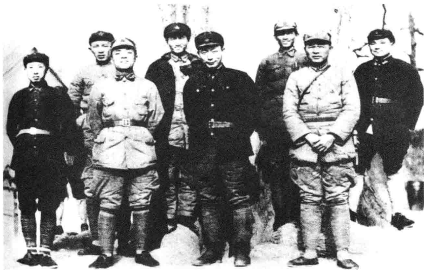
陕甘支队和红十五军团 会师后部分干部合影。