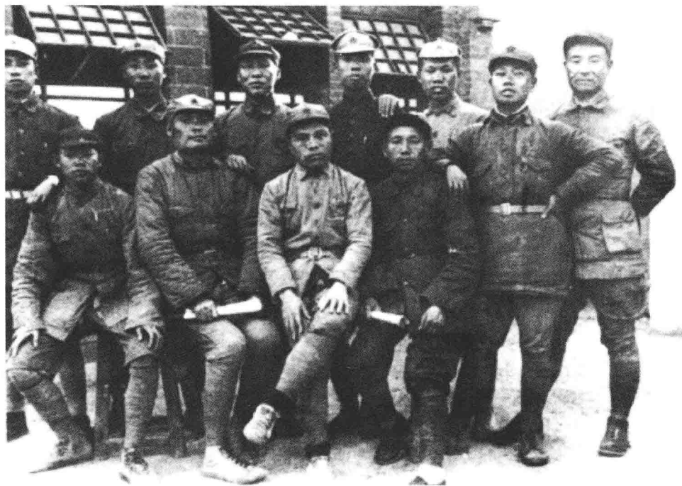
红十军团部分领导人合影。