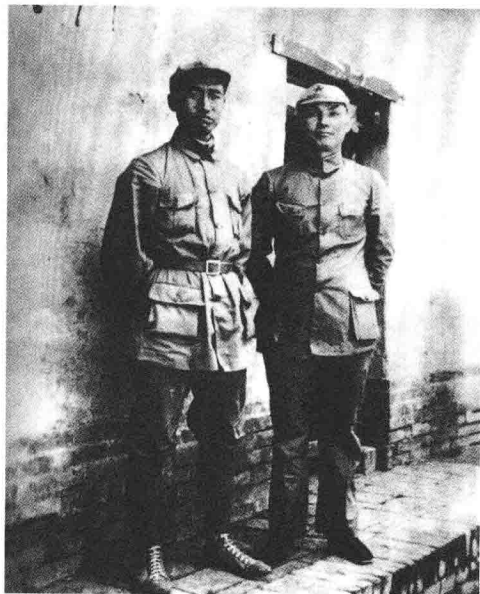
红四方面军总指挥徐向前（左）与红军前敌参谋长叶剑英（右）。