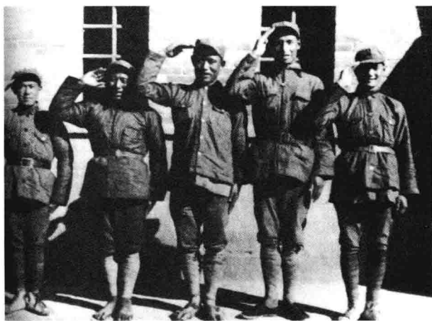
参加长征的部 分彝族红军战士。