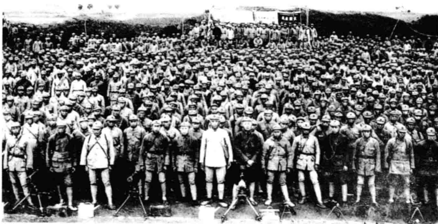
红军在陕北会师后誓师抗日。