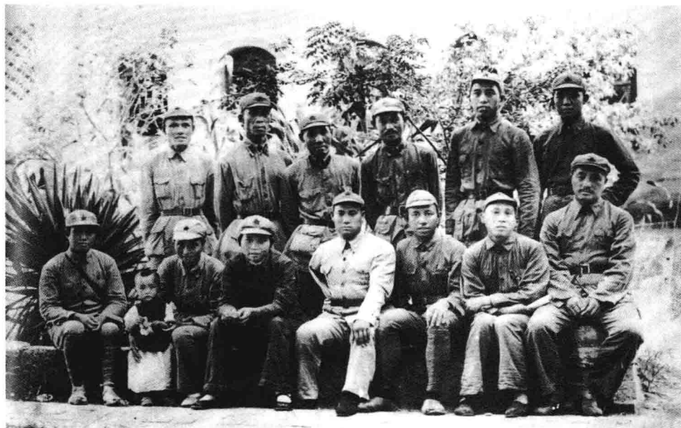
贺龙（前排右1）与红二方面军部分同志在陕西富平县庄里镇。