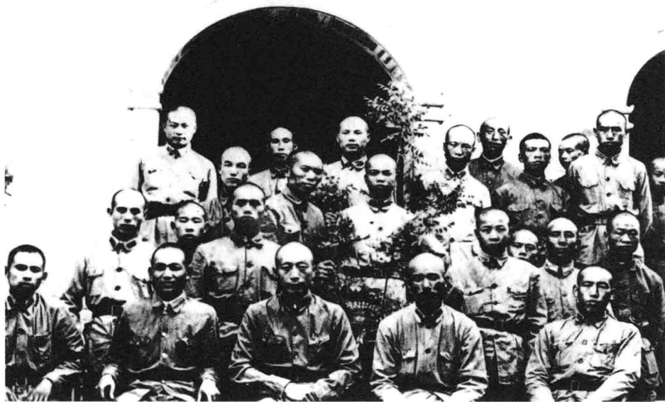
红一方面军一部在甘肃宫和镇合影。

日軍以計詭陝之 抗九証獨幹於區 民軍長策的影蘇安 五田來動最上正 1937.4.30.