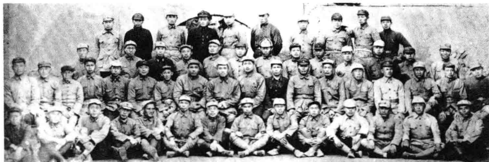
朱德（二排左9）与红四方面军部分人员合影。