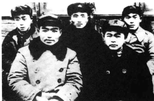
红25军部分干部合影 (前排左1郑位三、前排右1徐海东、后排中程子华)。