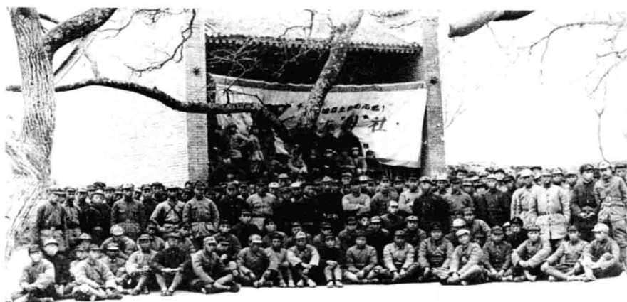
红一、二、四方面军团以上干部合影。