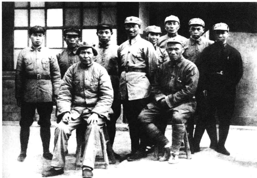
毛泽东（前排左）、朱德（前排右）与红一方面军部分将领在一起。