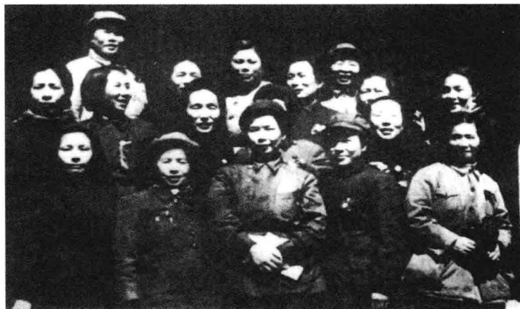
参加长征的 部分女红军。