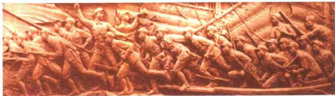
胜利渡长江（人民英雄纪念碑浮雕 局部）