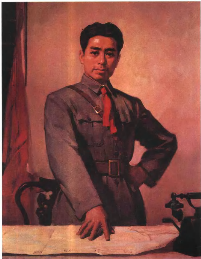
八一决策 (油画) 王征华 康东作