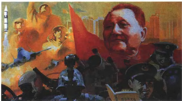
以邓小平新时期军队建设思想为指导，建设强大的现代化、正规化革命军队（宣传画） 于凉作