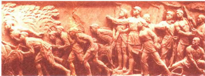
抗日游击队 (人民英雄纪念碑浮雕 局部)