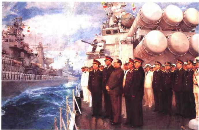
检阅（油画） 艾民有 张庆涛 作