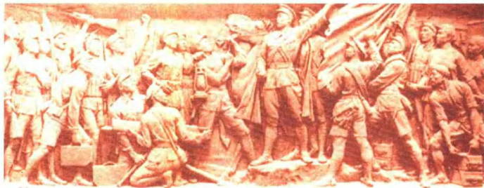
八一南昌起义 (人民英雄纪念碑浮雕 局部)