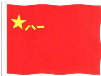
中国人民解放军军旗、军徽