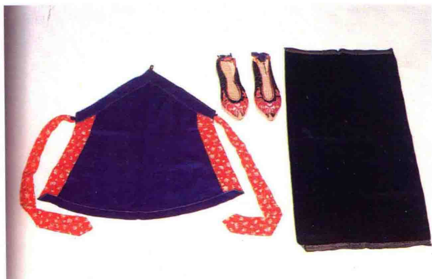
平远妇女装束的头巾、绣花鞋、围身裙