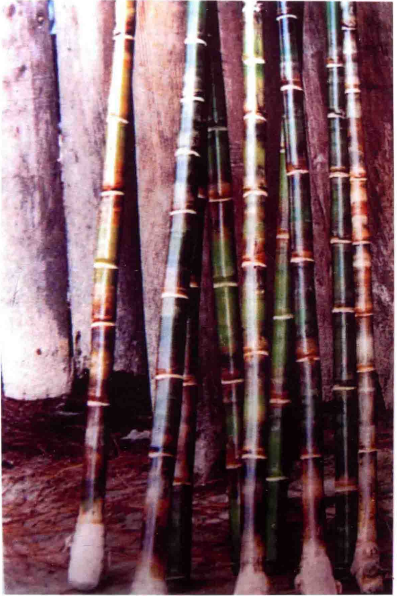
梅子畚相国卦竹（血色）