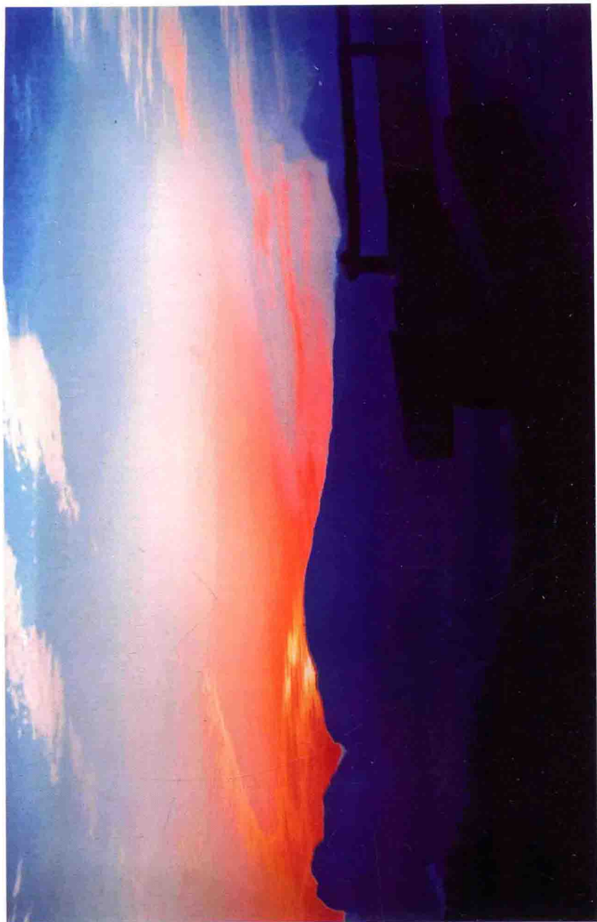
天下第一卧佛——南台山