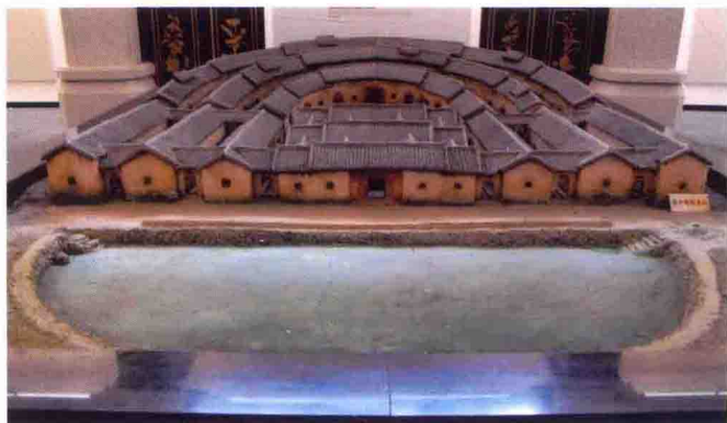
客家围龙屋模型图