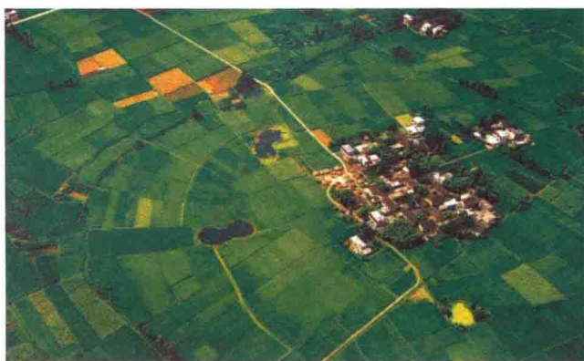
天府之國 漢川平原物產富饒