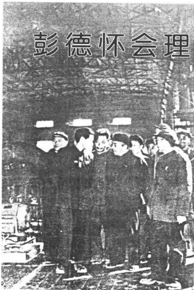
彭德怀视察三线工厂

1966年3月31日，黎明。一辆军用吉普车驶出会理县城，沿着泥泞的川滇公路，向着山峻水险的攀枝花奔去。车上坐着一位鬓发斑白的老人。他宽额厚唇，浓眉善目，不时取下头上的帽子，贪婪地看着外面层峦起伏的大山。