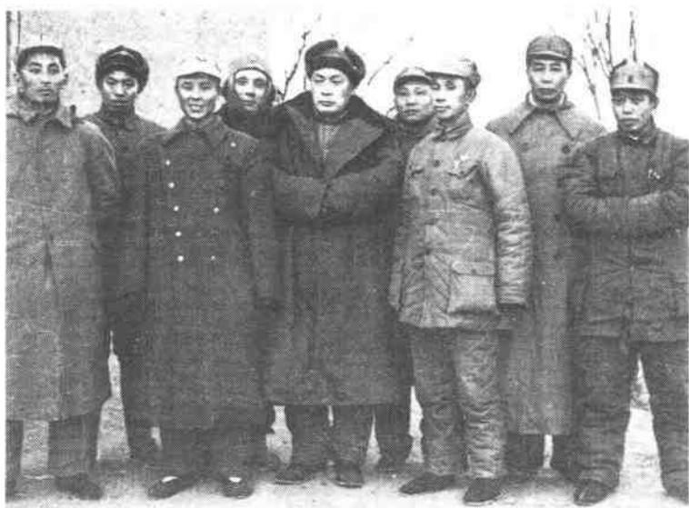
华东野战军领导同志合影。左起：叶飞、丁秋生、韦国清、邓子恢、陈毅、唐亮、粟裕、陈士榘、谭震林。（1947年1月摄）

万人。经过开封、睢杞两个阶段共20个昼夜的连续作战，我军全歼敌人1个兵团部、2个整编师部、4个正规旅、2个保安旅、1个正规团和3个保安团，并歼灭其他援敌一部，共9万余人。这是华东野战军主力转入外线作战后进行的第一个大歼灭战，也是在解放战争开始以后的整整两年中华东野战军进行的一次最大的歼灭战。在这次战役中，我军广大指战员不畏艰险，不怕困难，顽强奋战，表现了无比的勇敢和伟大的牺牲精神。我写这篇回忆录，首先是为了纪念在这次战役中英勇献身的烈士们；同时，也期望能为研究我军灵活机动的战略战术和大兵团作战的指挥问题提供一些情况，和同志们共同探讨。