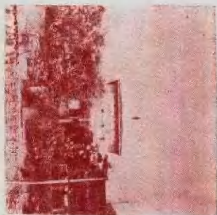
抗战时期的巴县中学校址