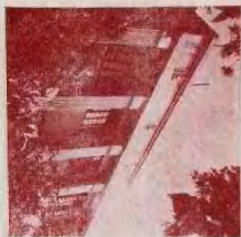
重庆市二中之一角——教学大楼