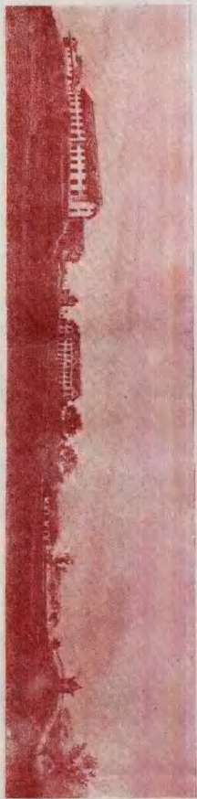
原巴县县立中学全景